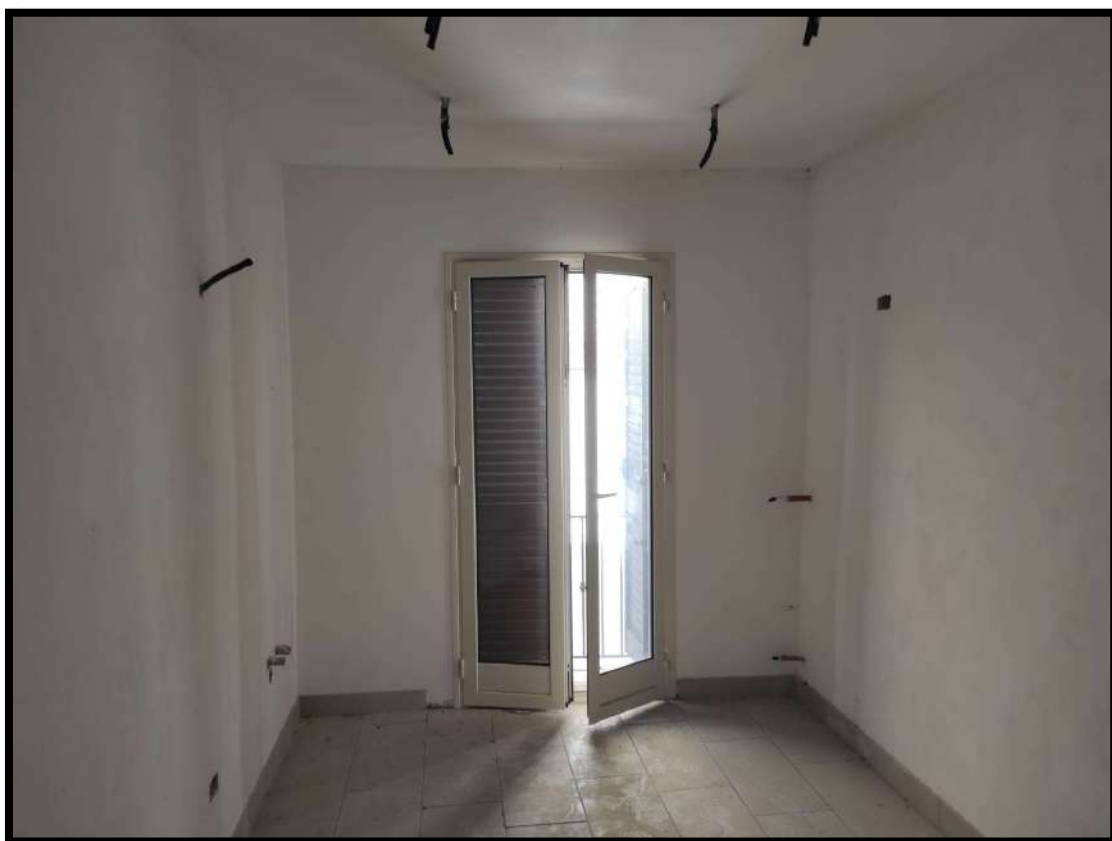
Vista interna – Locale cucina