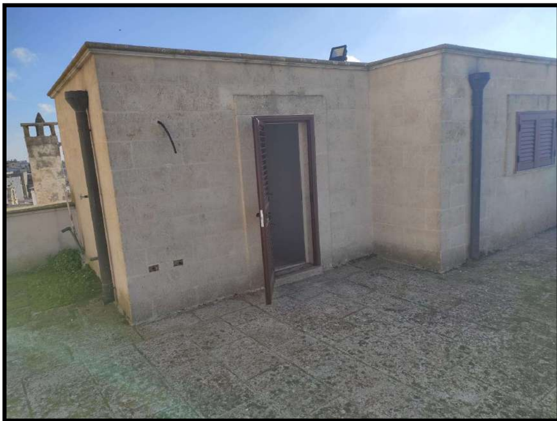
Vista esterna – Piano terrazzo