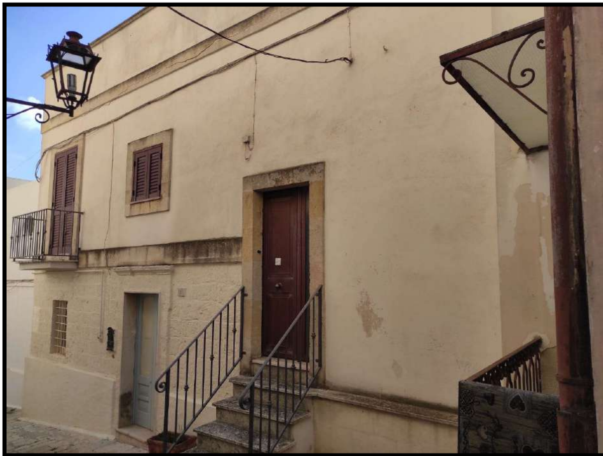
Ingresso Principale su via Francesco Russo