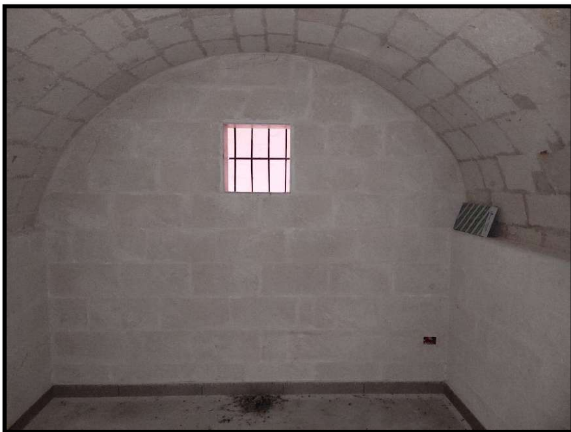
Vista interna – Locale deposito al piano seminterrato