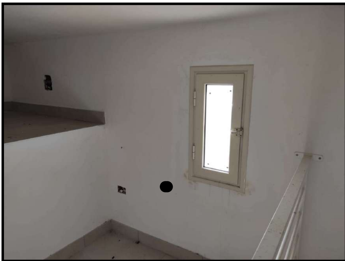
Vista Interna – Locale soppalco