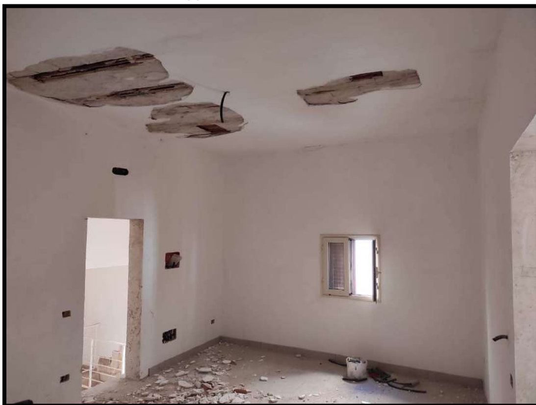
Vista interna – Stato di degrado del locale soggiorno