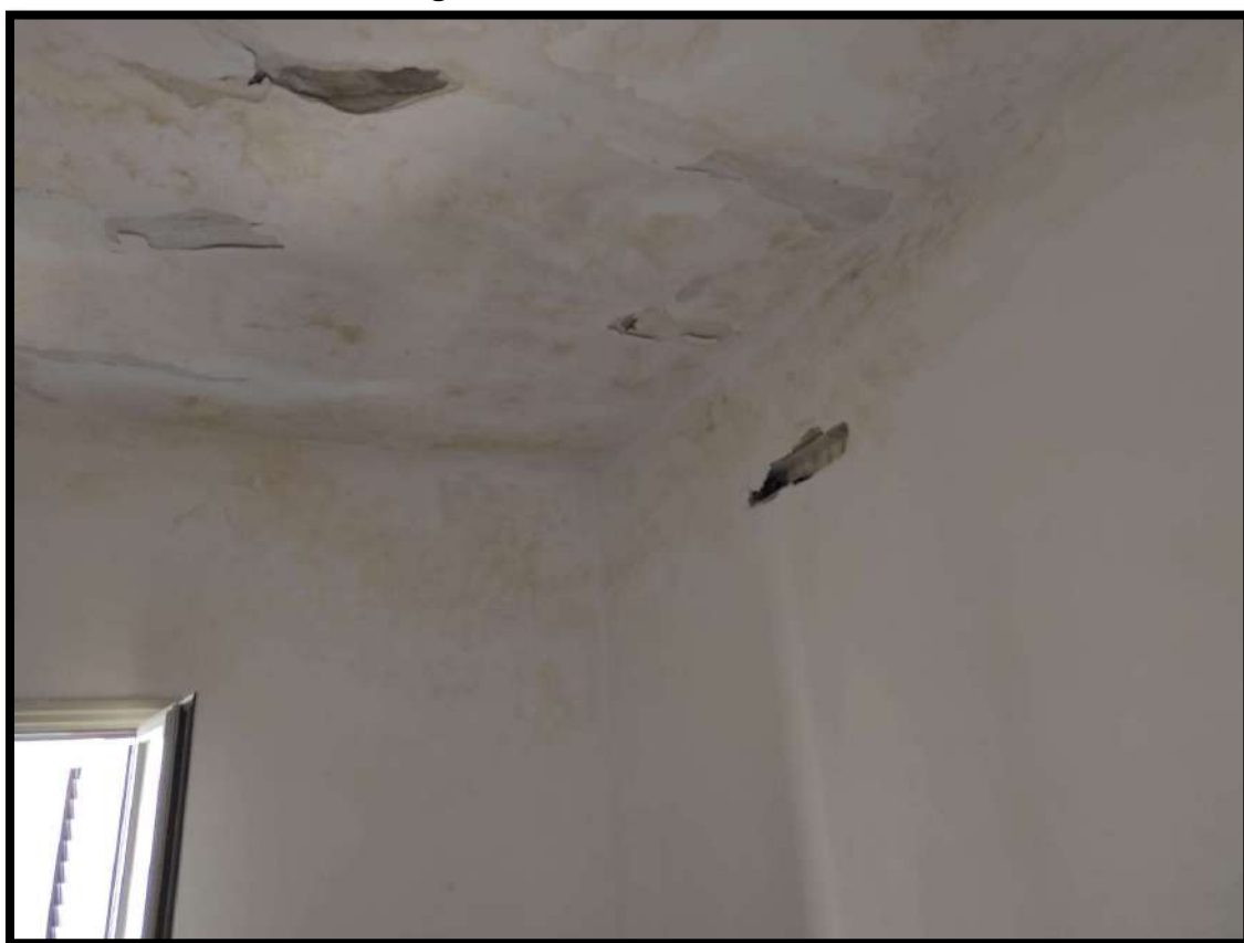
Vista interna – Stato di degrado solaio camera da letto 1