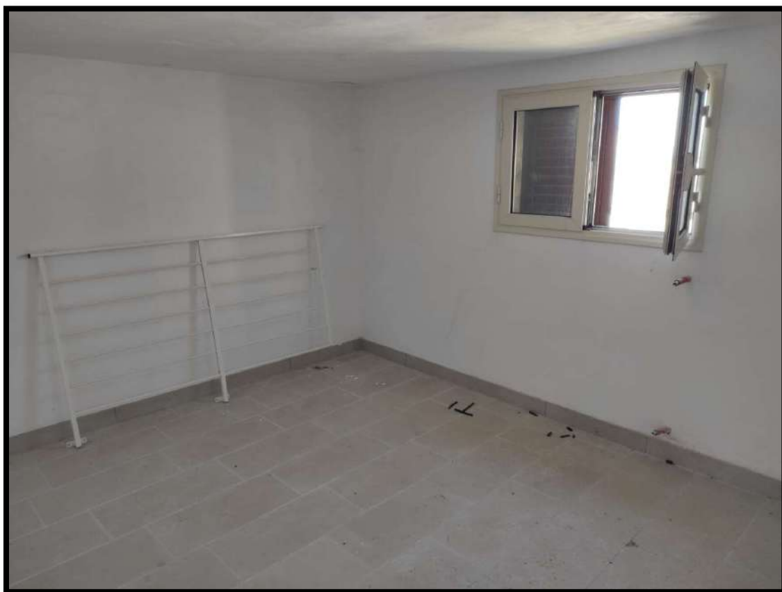
Vista interna – Locale lavanderia