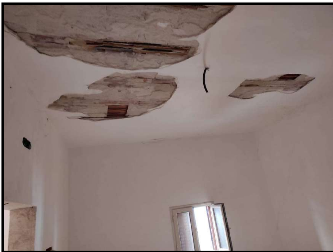
Vista Interna – Stato di degrado Camera da letto 2