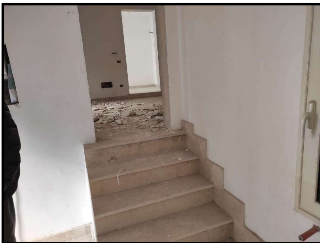
Vista interna – Rampa di scale che conduce al locale soggiorno