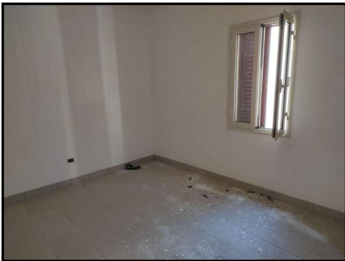
Vista interna – Camera da letto