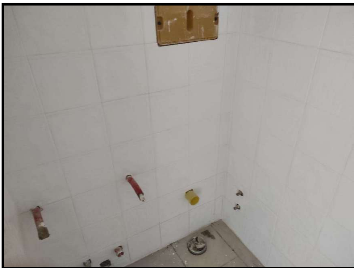
Vista interna – Locale bagno al piano terrazzo