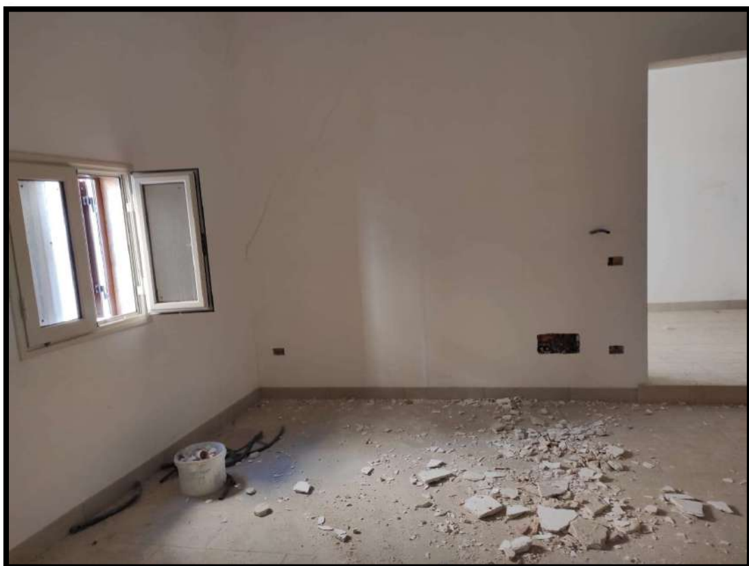
Vista interna – Locale Soggiorno