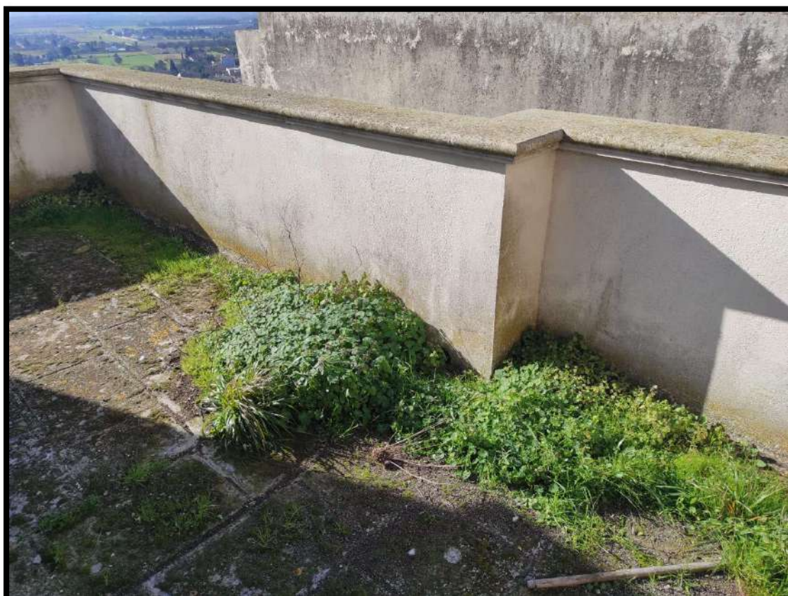
Vista esterna – Stato di degrado lastrico solare