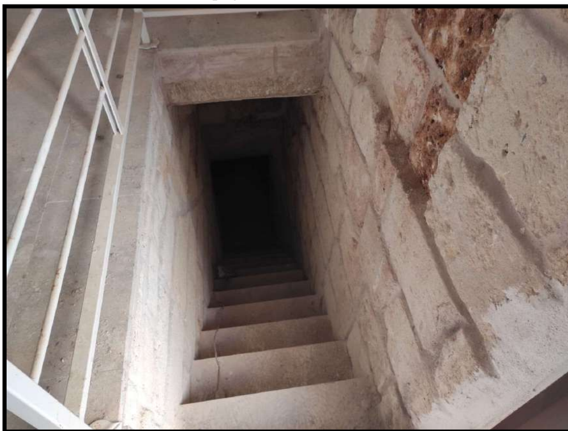
Vista interna – Rampa di scale che conduce al piano seminterrato