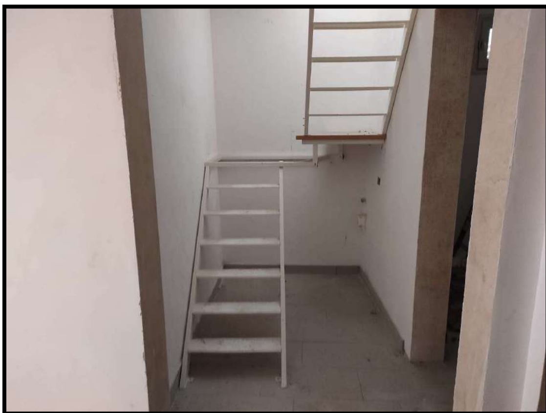
Vista interna – Vano scale