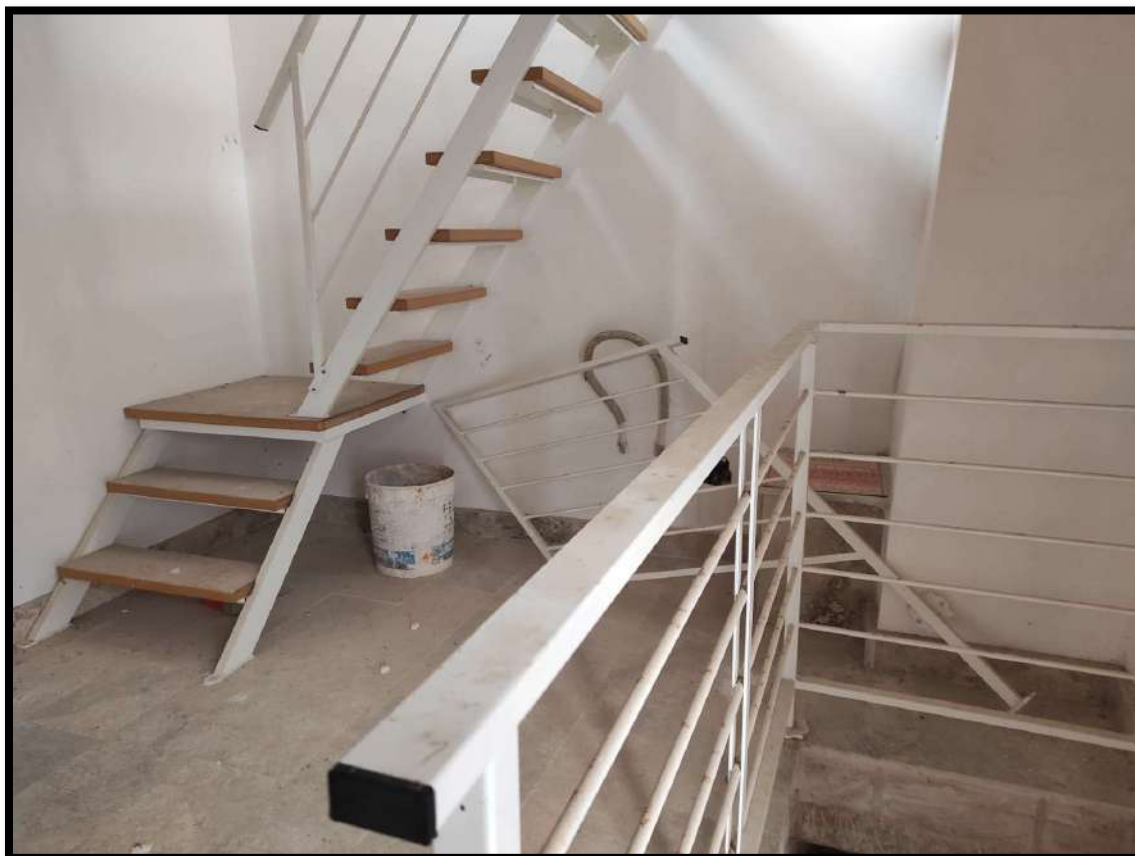
Vista interna – Locale disimpegno 1