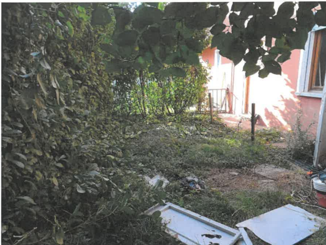
Dettaglio giardino di proprietà