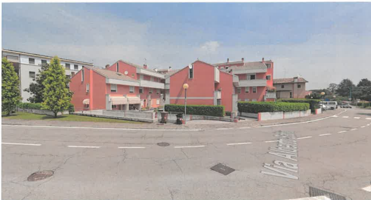
Vista condominio "Margherita" _ Via Albert Sabin