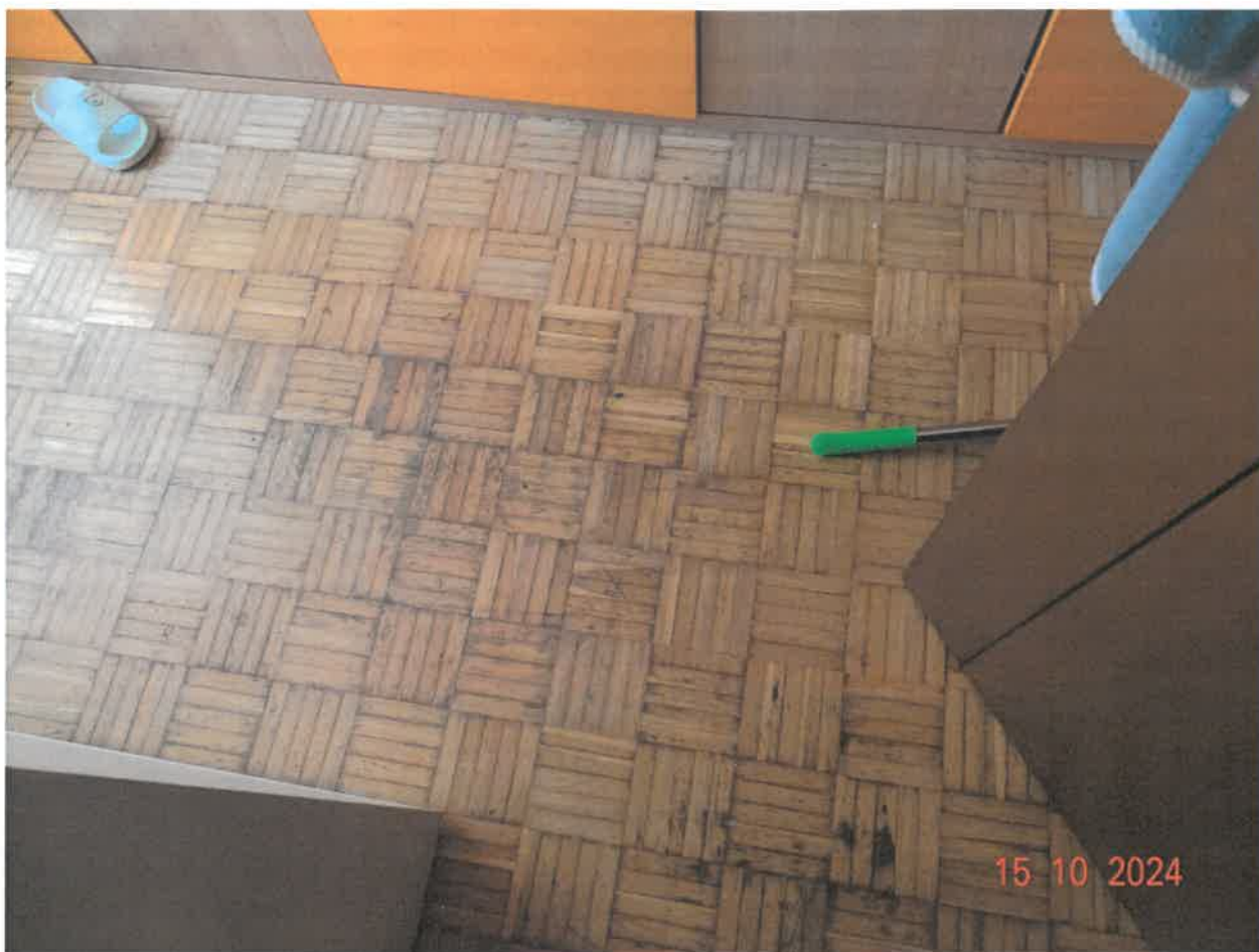
Dettaglio pavimento cameretta