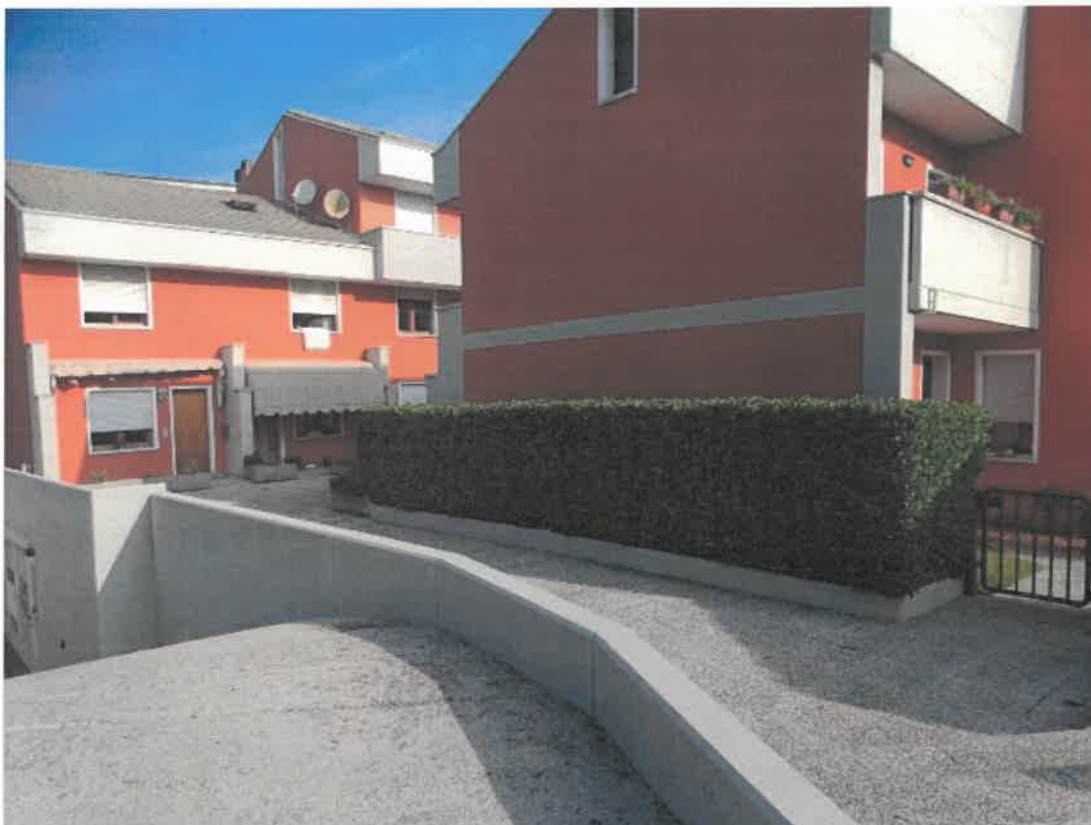
Dettaglio rampa di accesso ai locali al piano interrato