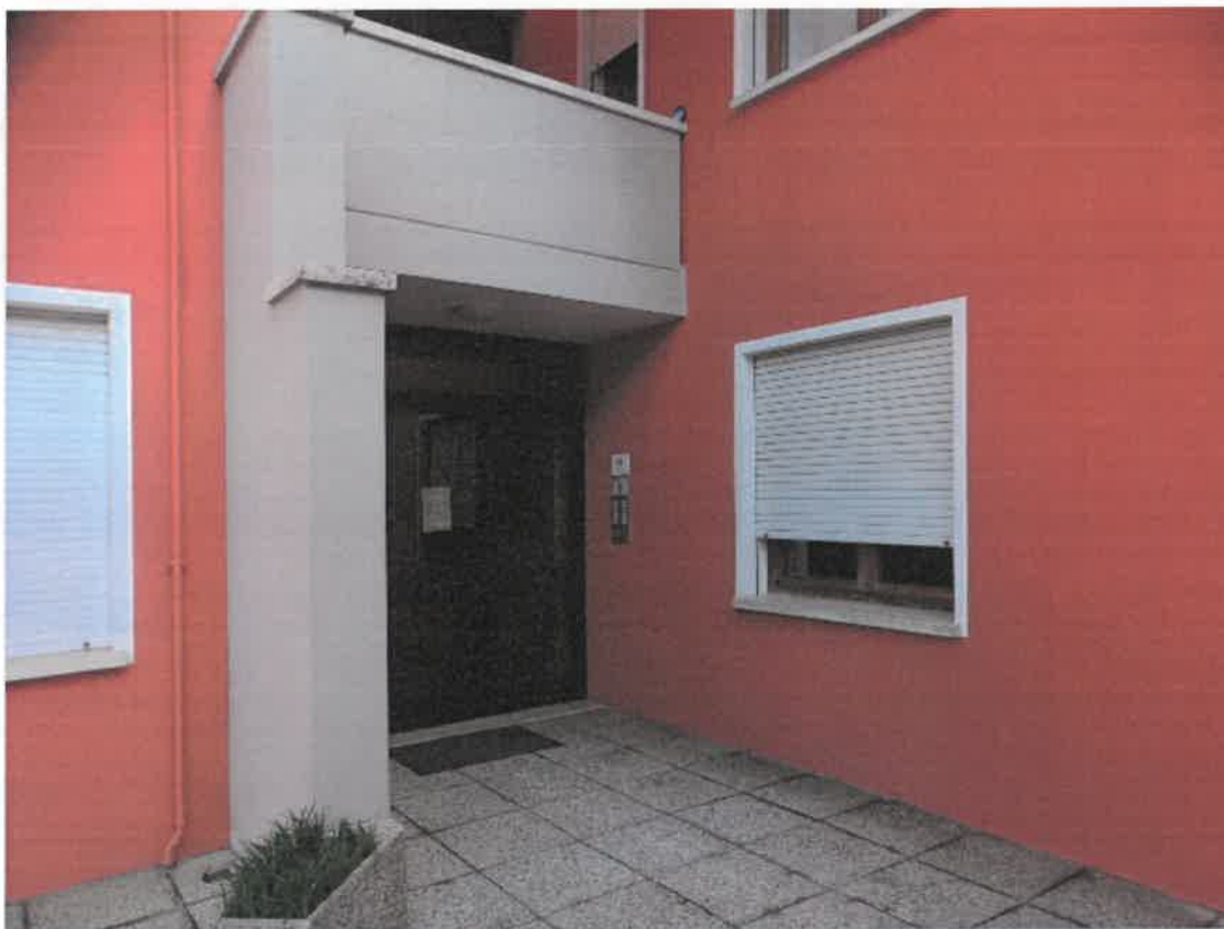
Androne di ingresso