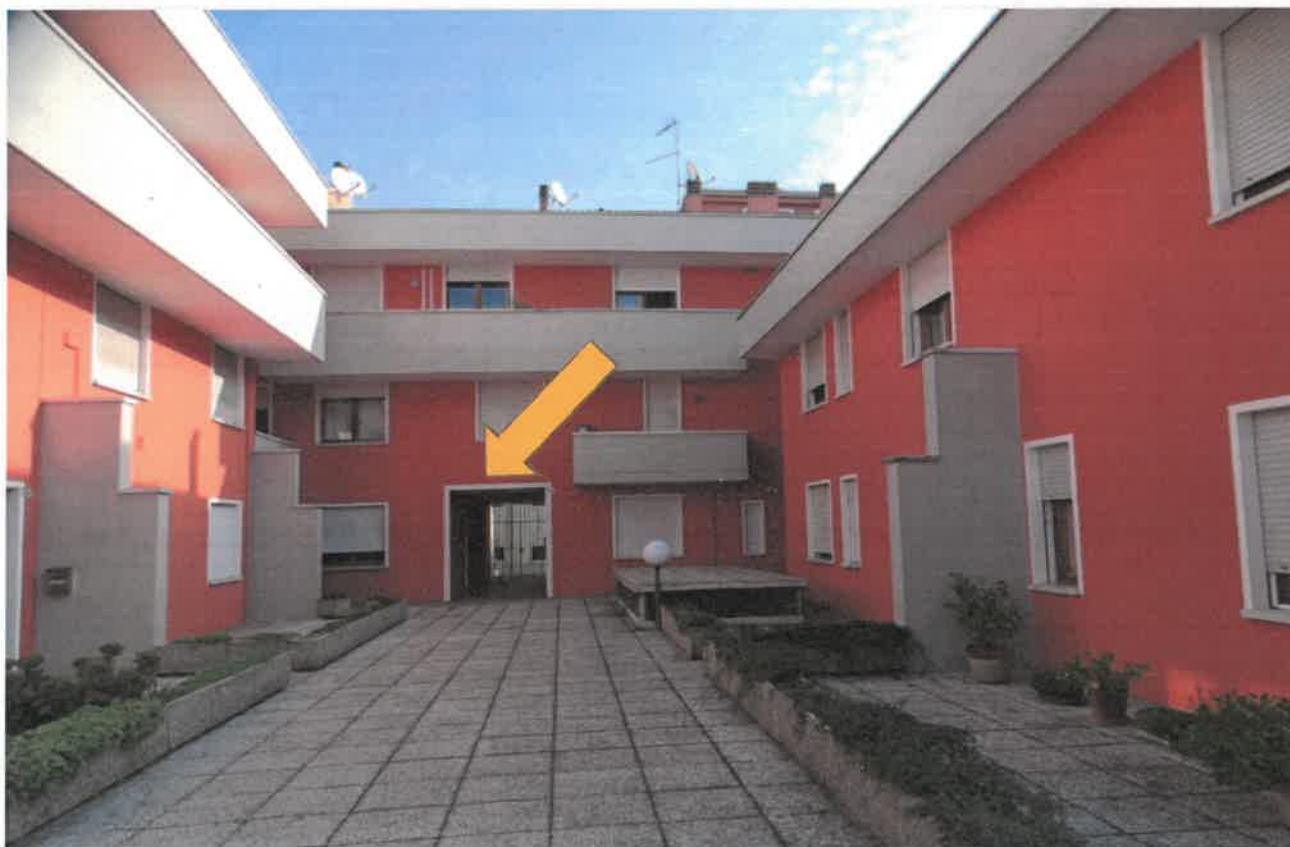
Vista ingresso comune all'appartamento