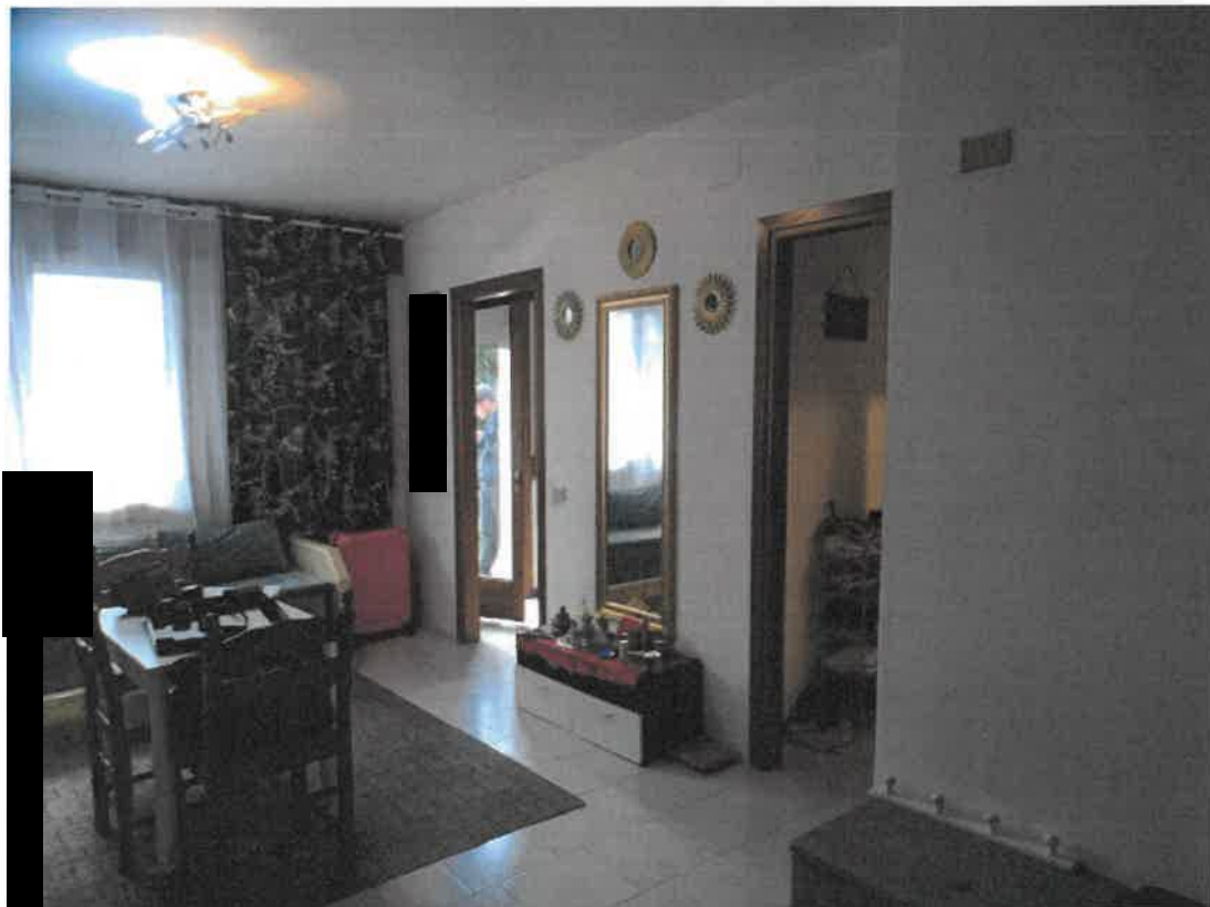
Viste locale soggiorno