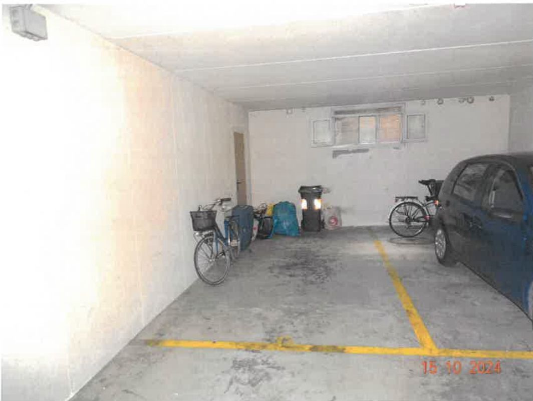
Posto auto Coperto per una automobile