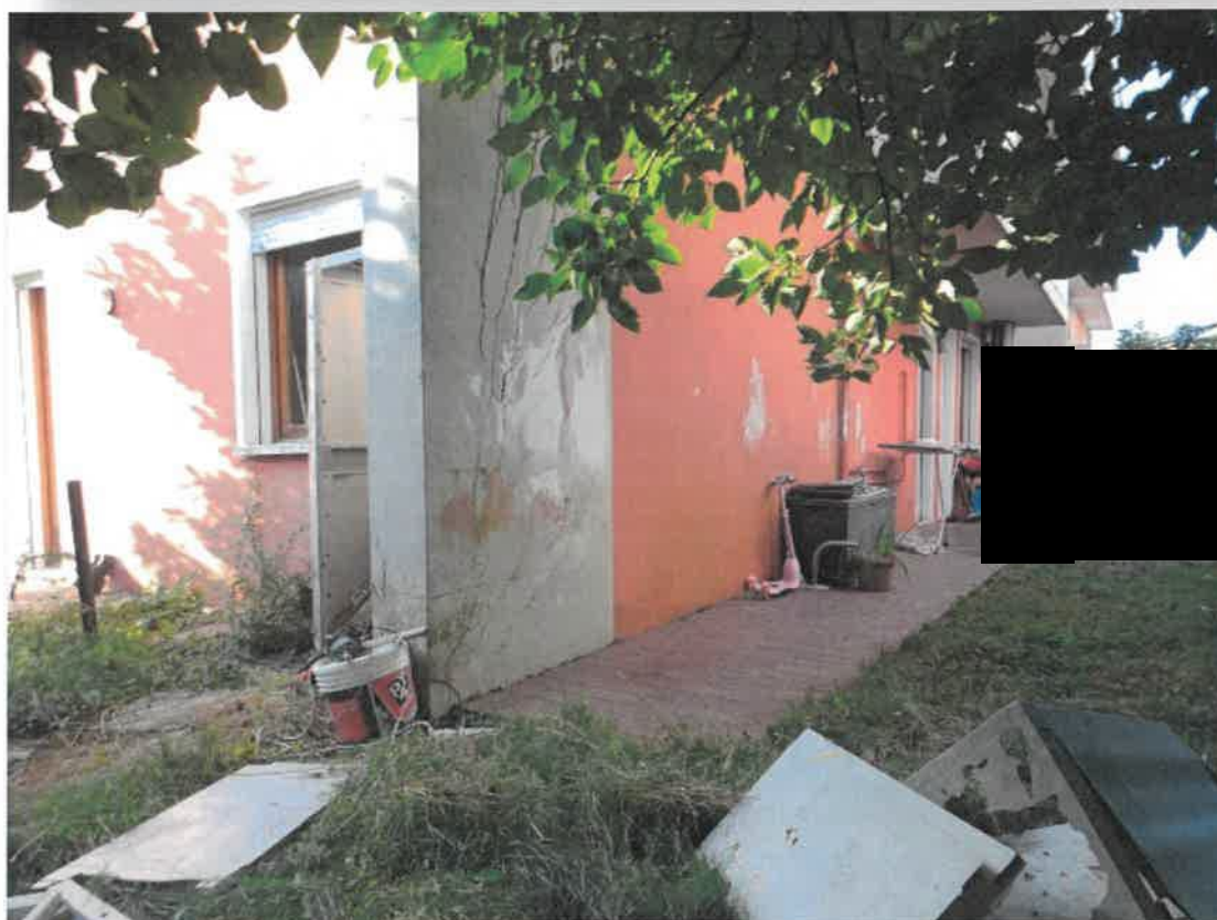
Giardino di proprietà