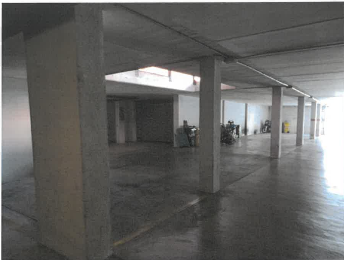
Locali al piano interrato