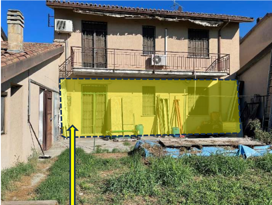
Abitazione, Piano Terra, pignorato