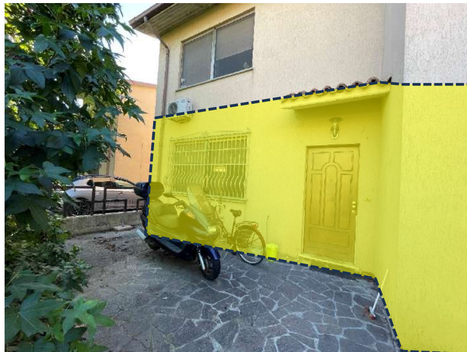
Appartamento, piano terra, pignorato