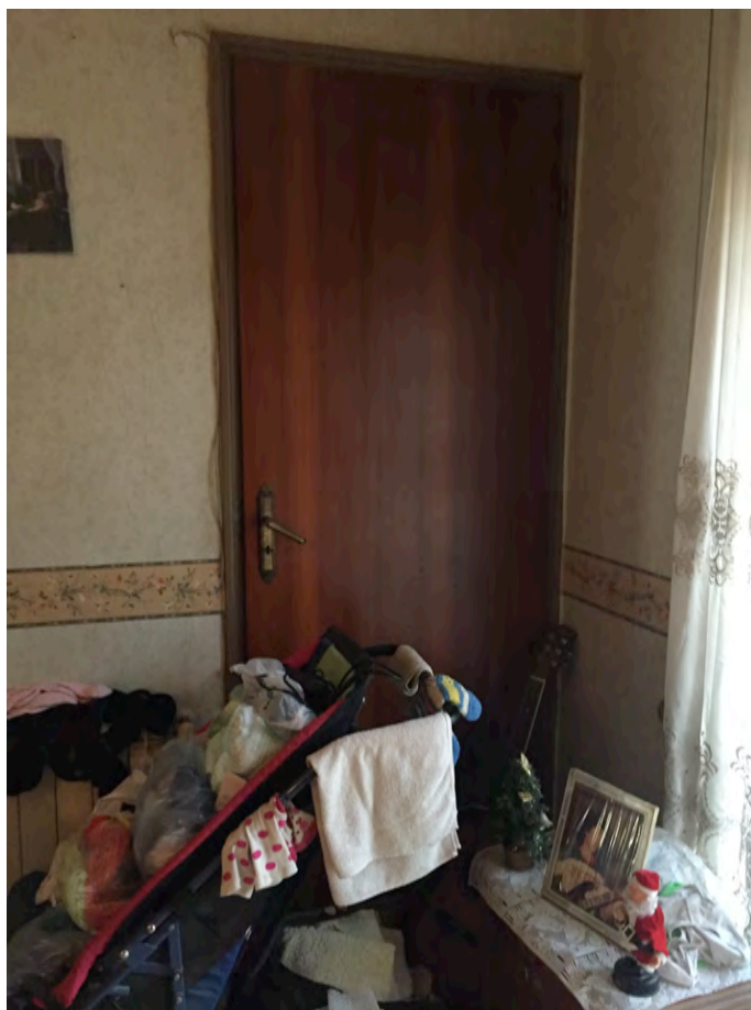
Foto n°9 – Porta di accesso al piano superiore chiusa e non accessibile.