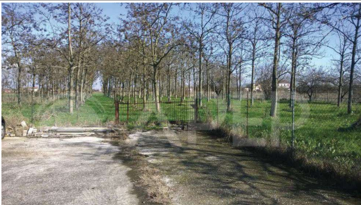
Foto 36 - Vista dall'angolo nord-est del Mappale 451 con il cancello per accedere al Mappale 303