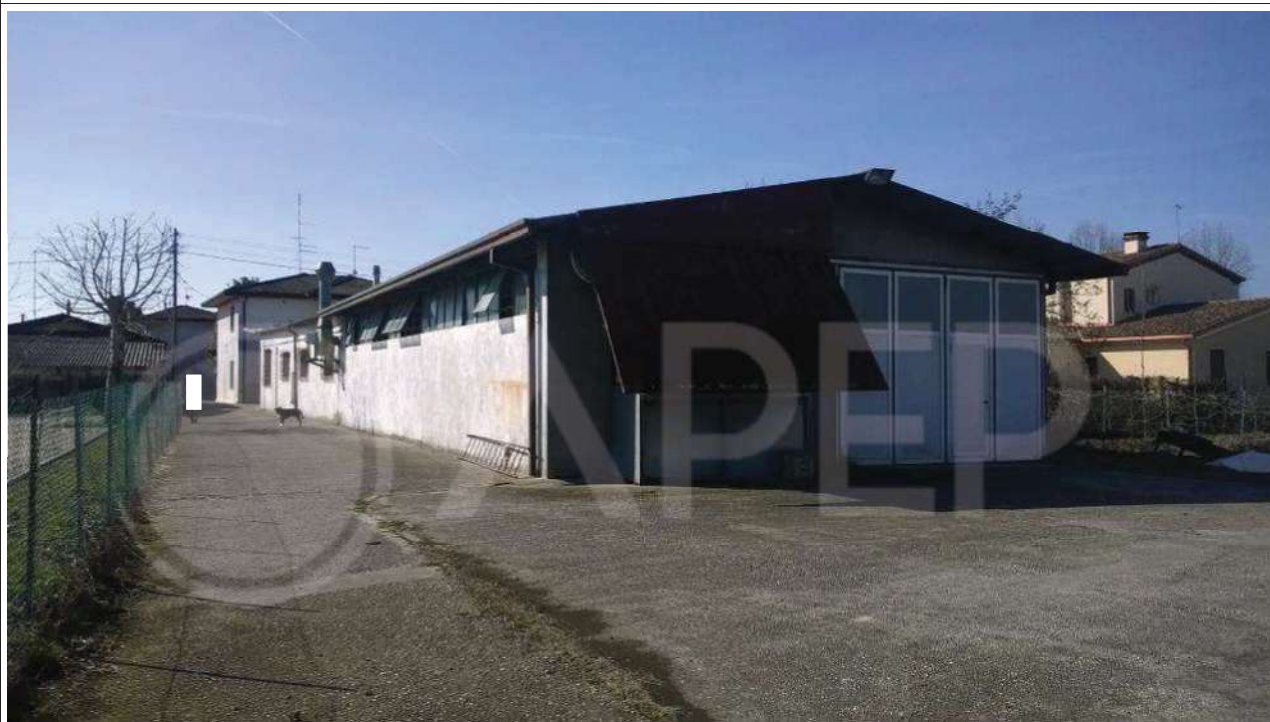
Foto 34 - Prospetti nord-est Laboratorio est