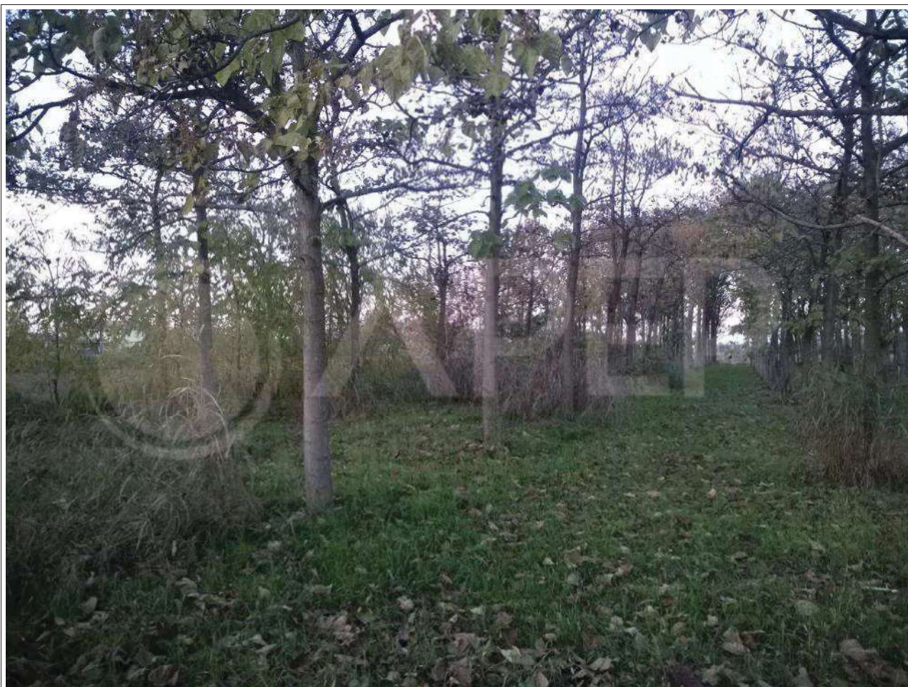
Foto 43 - Particolare alberature Mappale 303