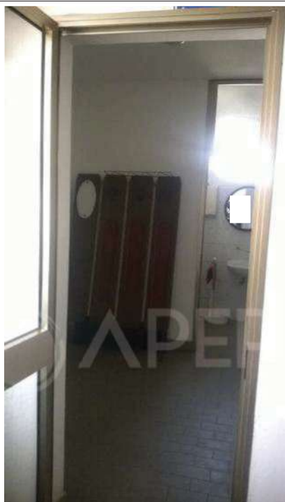
Foto 3 – Zona “Spogliatoi e Servizi” - Spogliatoio posto più a nord