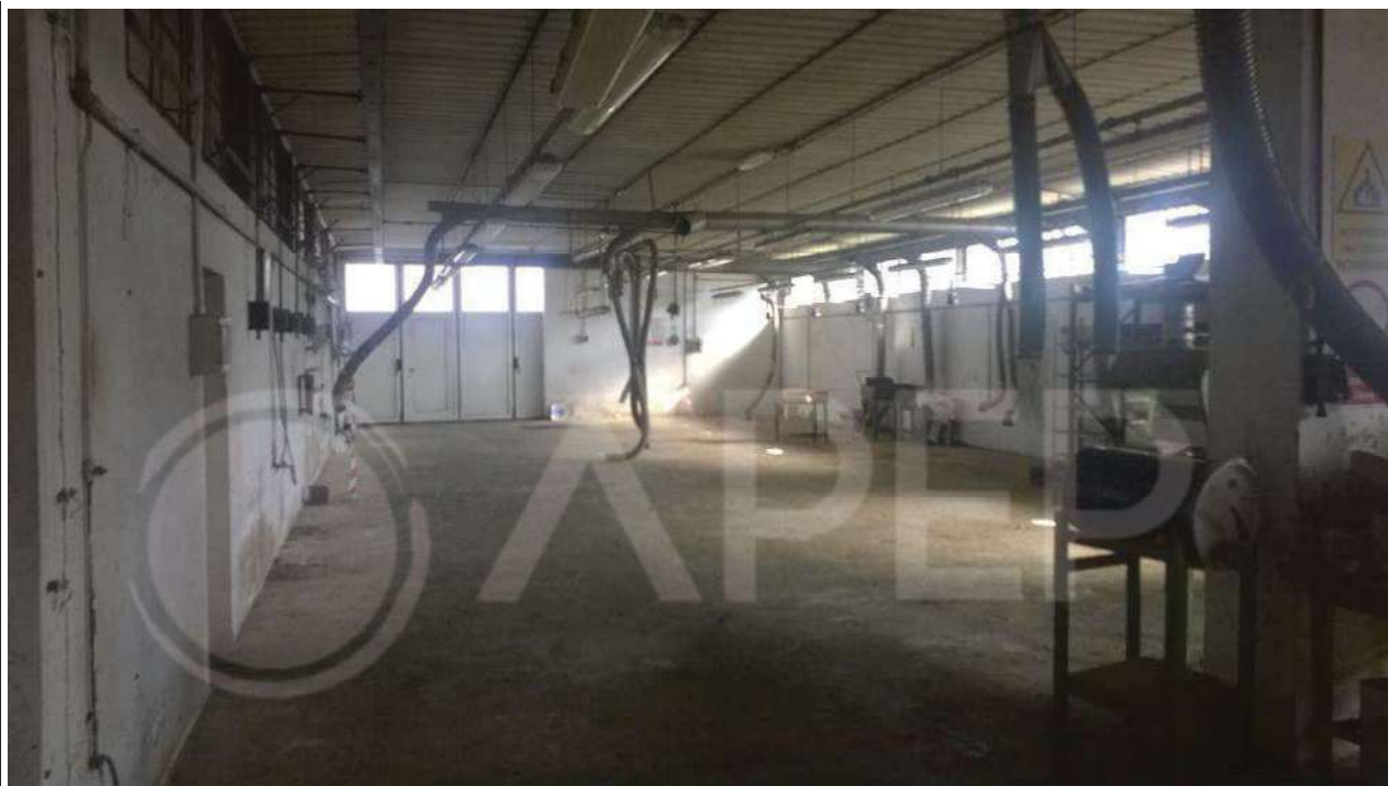
Foto 13 – Laboratorio est – Zona di lavorazione - pareti ovest-nord-est