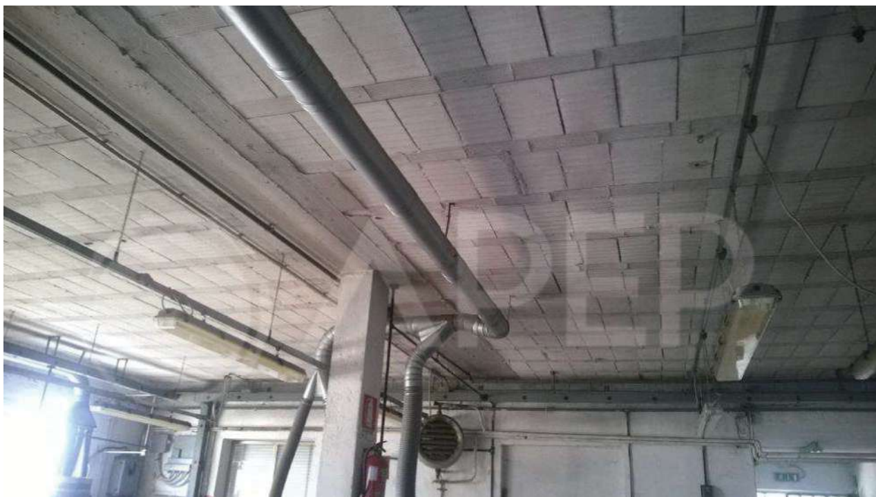
Foto 15 – Laboratorio est – Zona di lavorazione – particolare soffitto