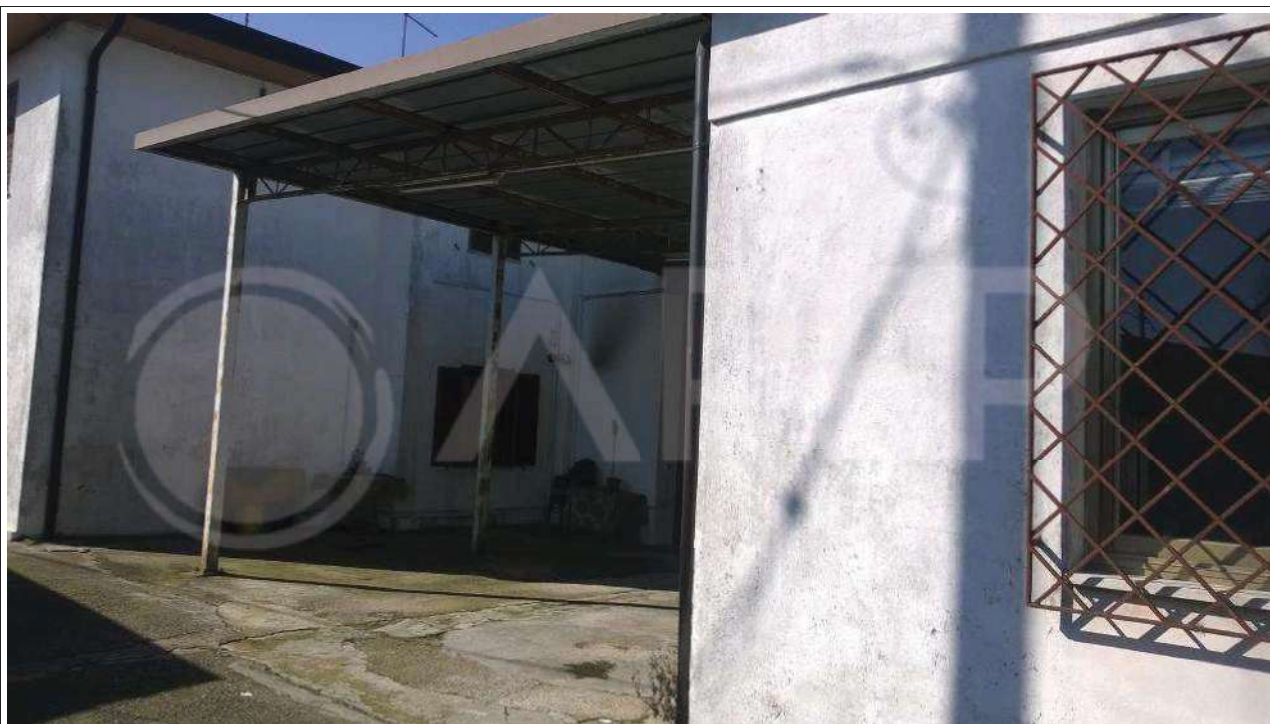
Foto 37 - Prospetto e portico lato est. A sinistra prospetto nord dell'edificio ad uso residenziale altra proprietà