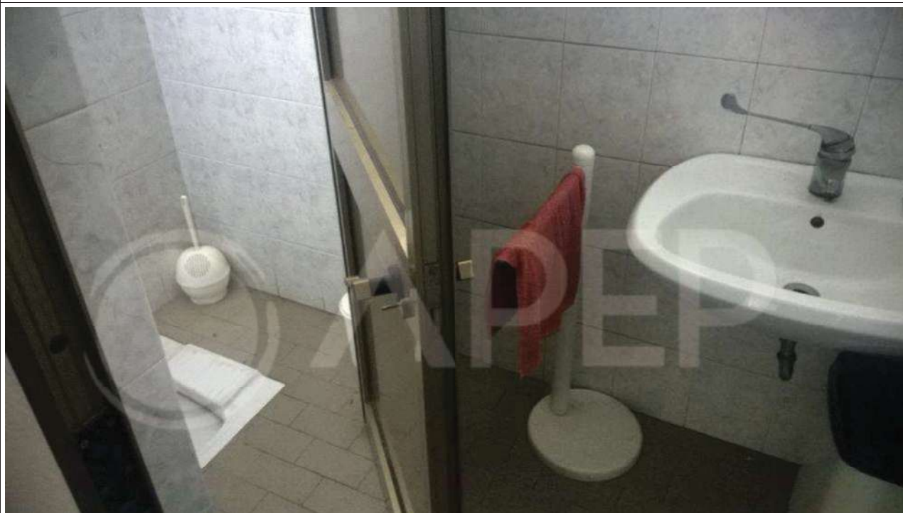
Foto 4 – Zona “Spogliatoi e Servizi” - Anti-wc e Wc posti più a nord