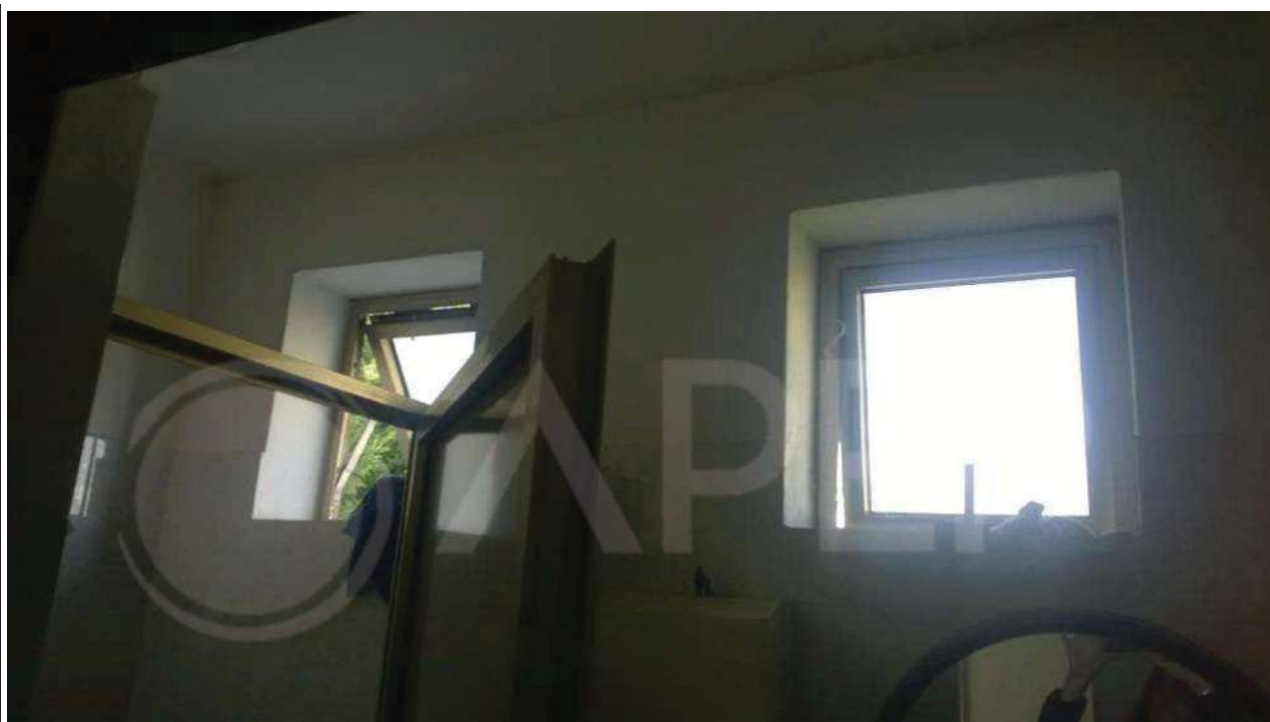
Foto 5 – Zona “Spogliatoi e Servizi” - Parete perimetrale ovest finestrata (rif. Foto precedente)