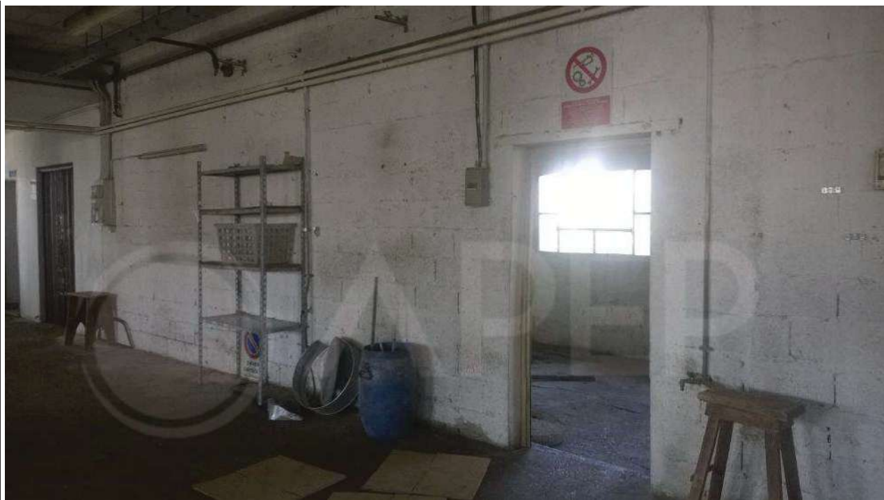
Foto 19 – Laboratorio est – parete est con collegamento al Laboratorio ovest