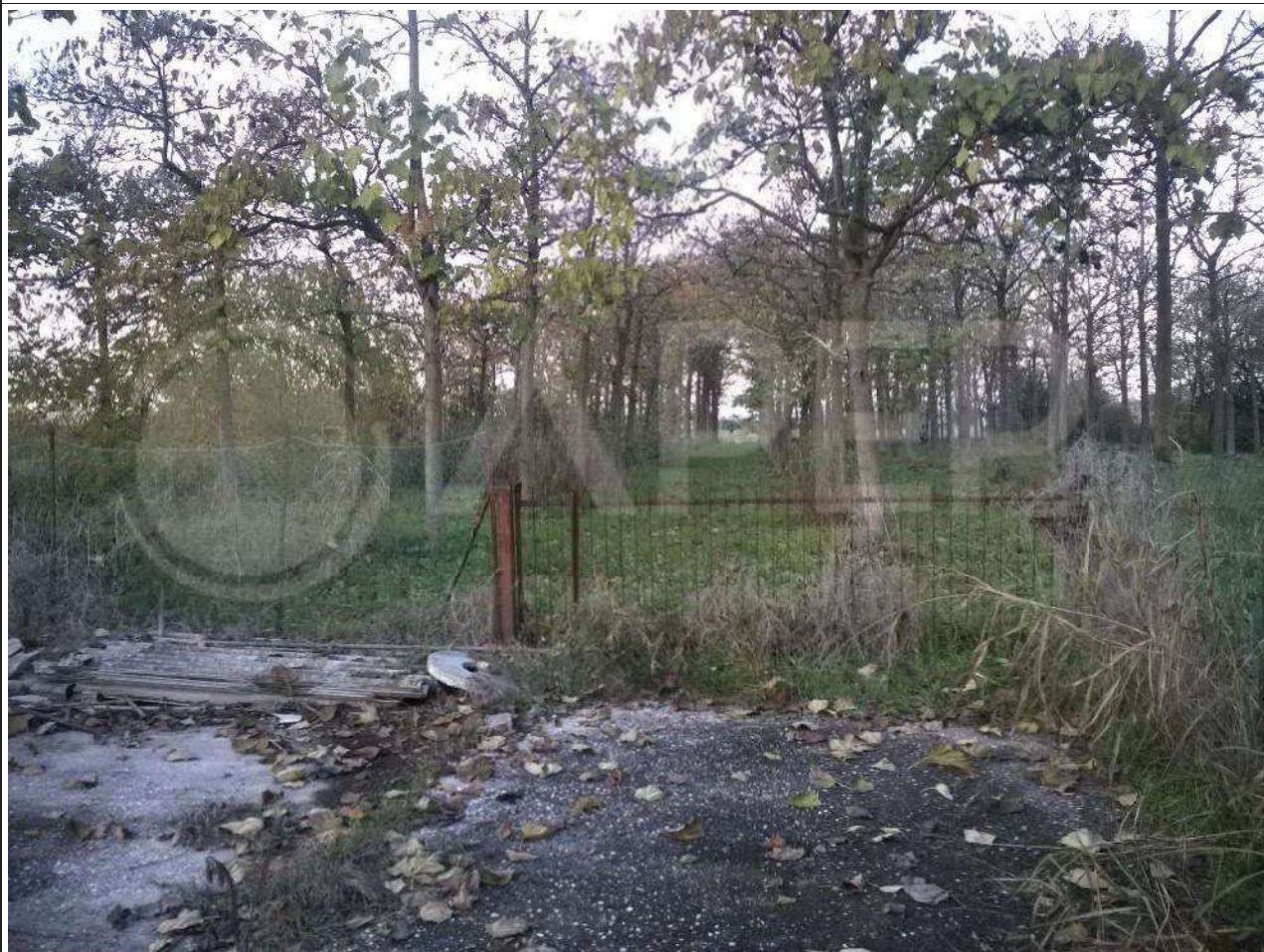
Foto 42 - Cancelli che separa il Mappale 451 (pavimentato) dal Mappale 303 (alberato)