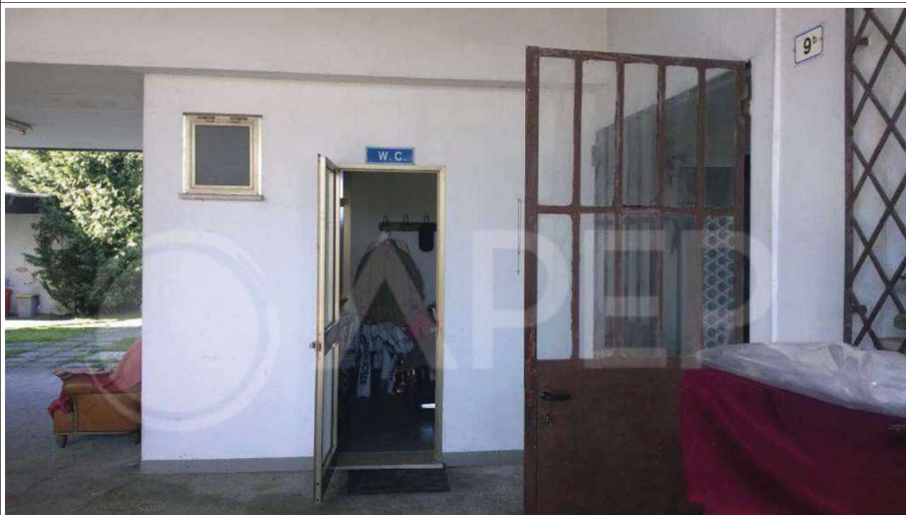
Foto 6 – Zona “Spogliatoi e Servizi” - Ingresso Spogliatoio posto a sud