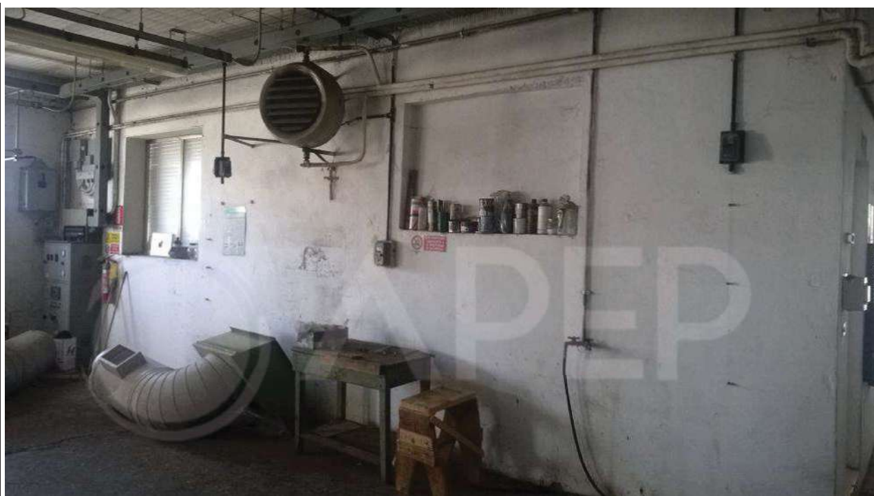
Foto 11 – Laboratorio est – Zona di lavorazione – parete interna sud