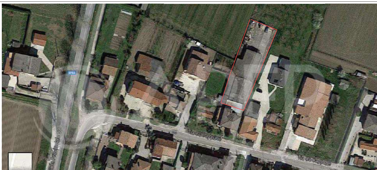
Individuazione sommaria del Lotto

Lotto: Piove di Sacco PD – Via Cò Cappone n.9