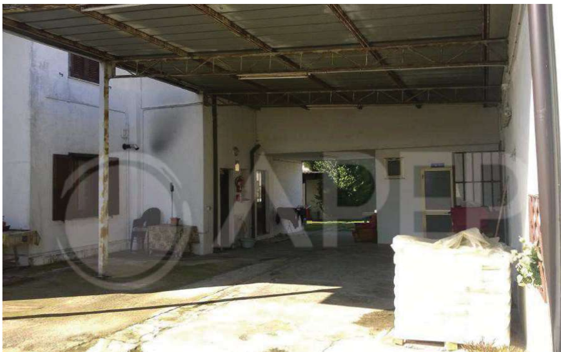
Foto 39 - Portico