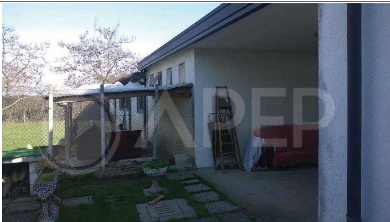
Foto 38 - Prospetto ovest - ripresa fotografica da zona esterna di altra proprietà