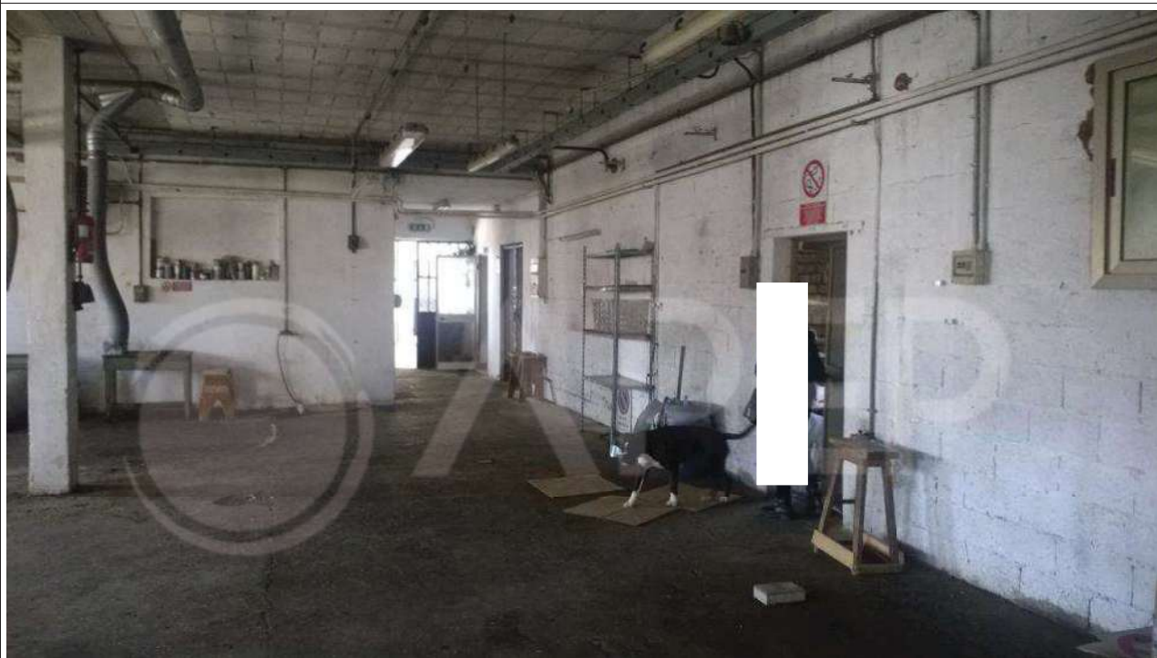
Foto 14 – Laboratorio est – Zona di lavorazione – angolo sud-ovest