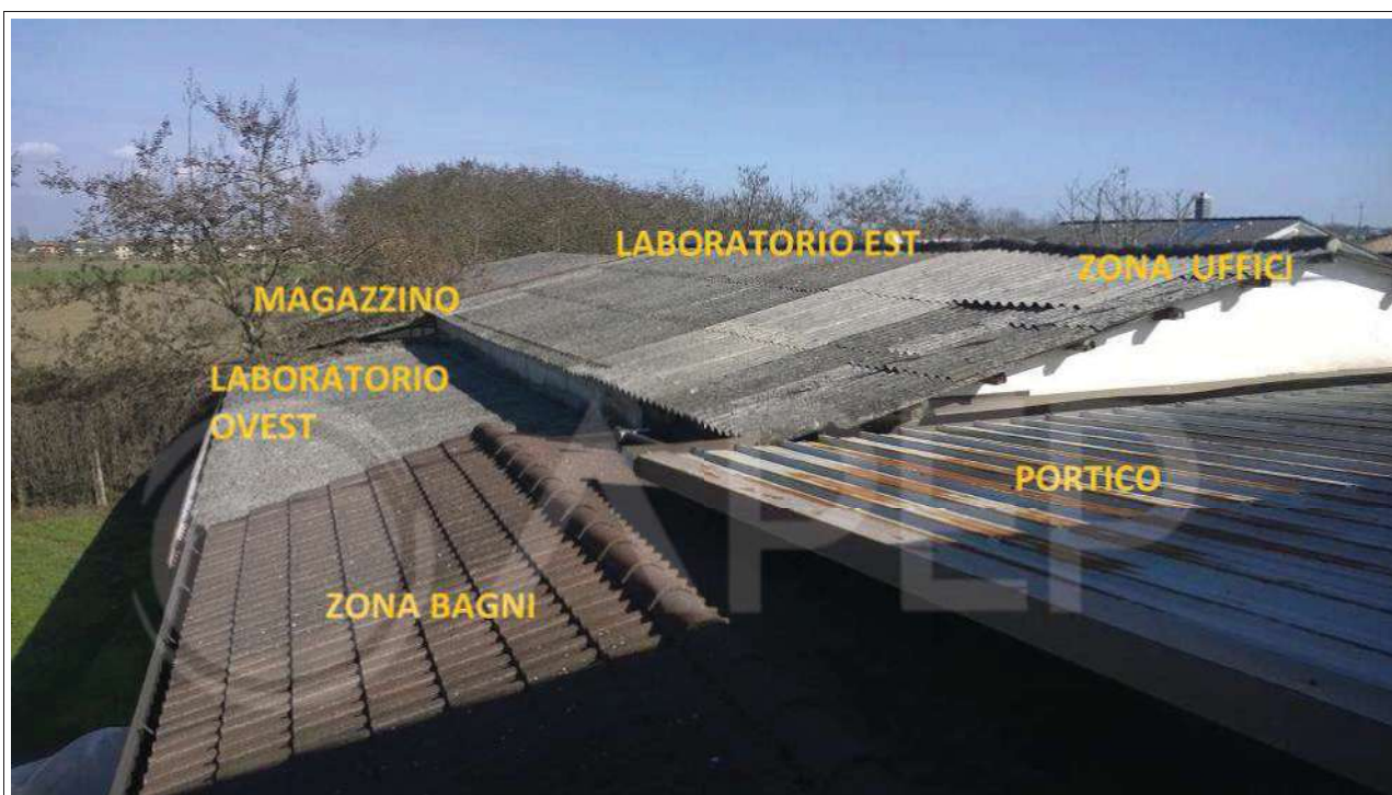
Foto 41 - Coperture riprese dalla terrazza dell'edificio confinante di altra proprietà