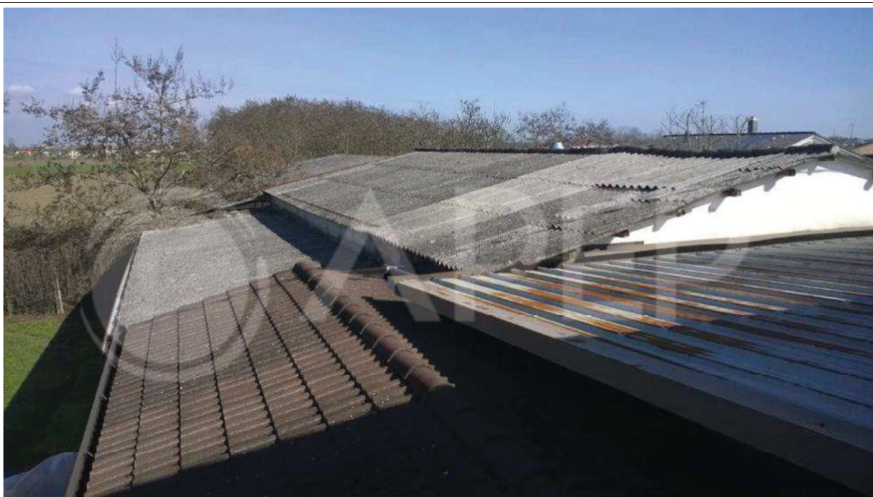
Foto 40 - Coperture riprese dalla terrazza dell'edificio confinante di altra proprietà