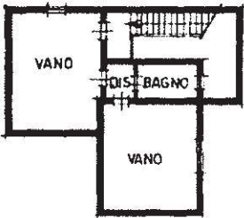
PRIMO PIANO H=2.60