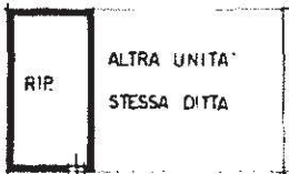
PIANO TERRA Hm=2.20

Allegata alla dichiarazione presentata all'Ufficio Tecnico Erariale di PADOVA Scheda N.°