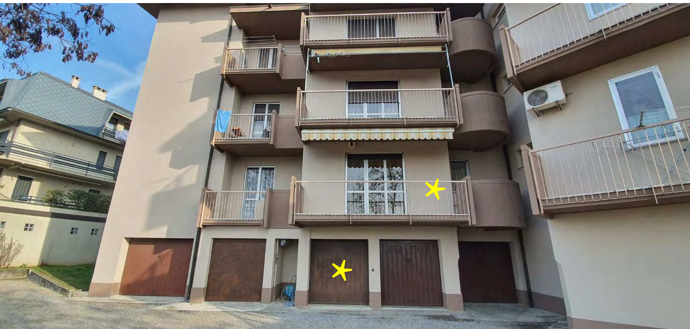
VISTA LATO SUD CONDOMINIO, APPARTAMENTO PIANO PRIMO ED AUTORIMESSA PIANO TERRA