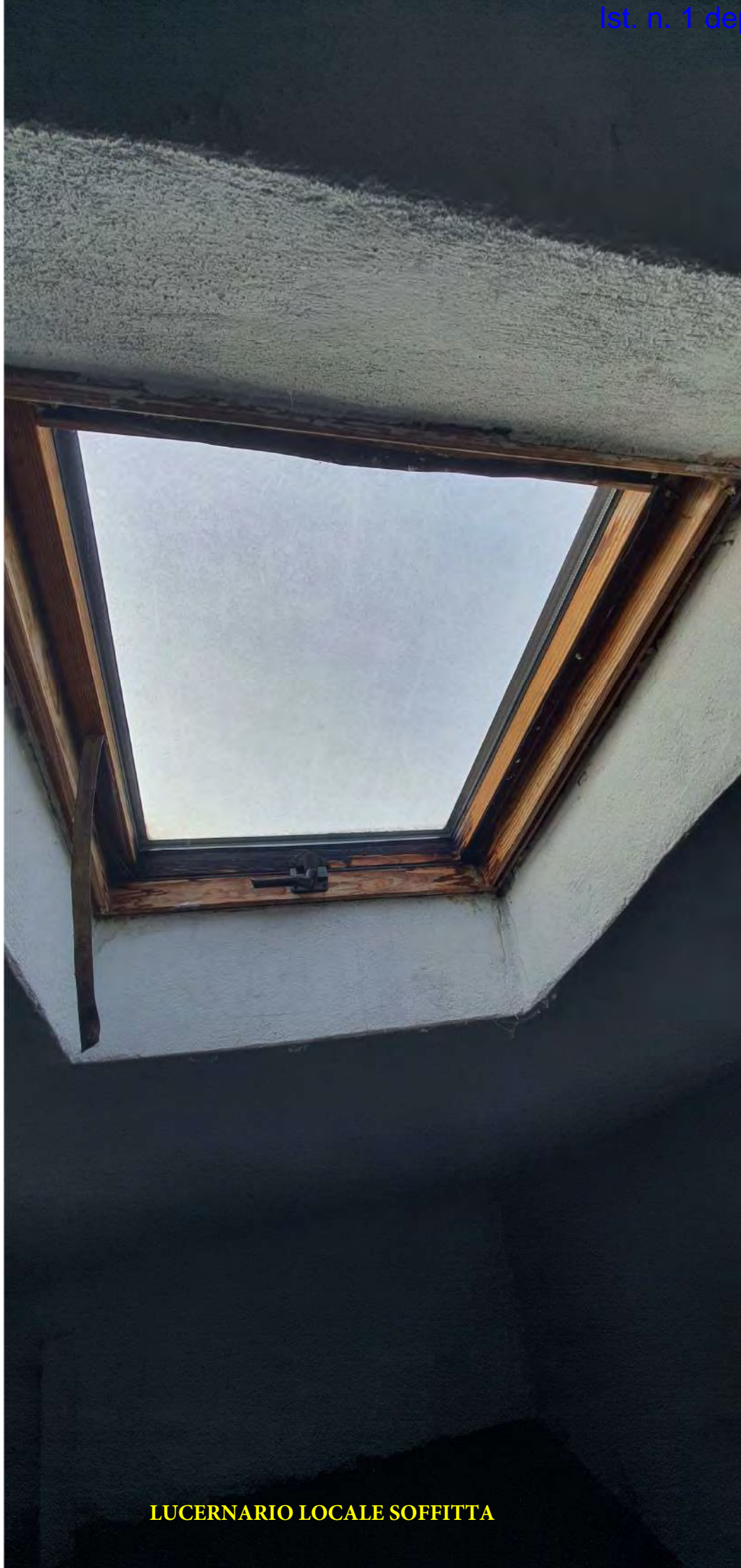
LUCERNARIO LOCALE SOFFITTA