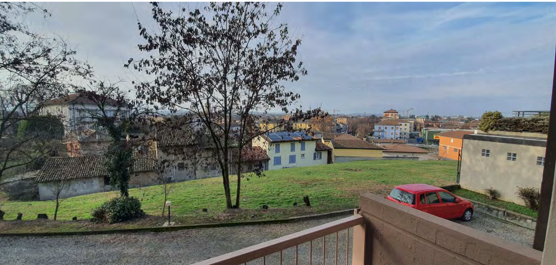
PANORAMA VERSO SUD