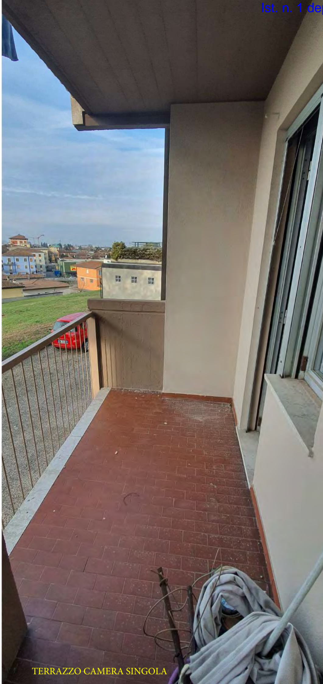
TERRAZZO CAMERA SINGOLA