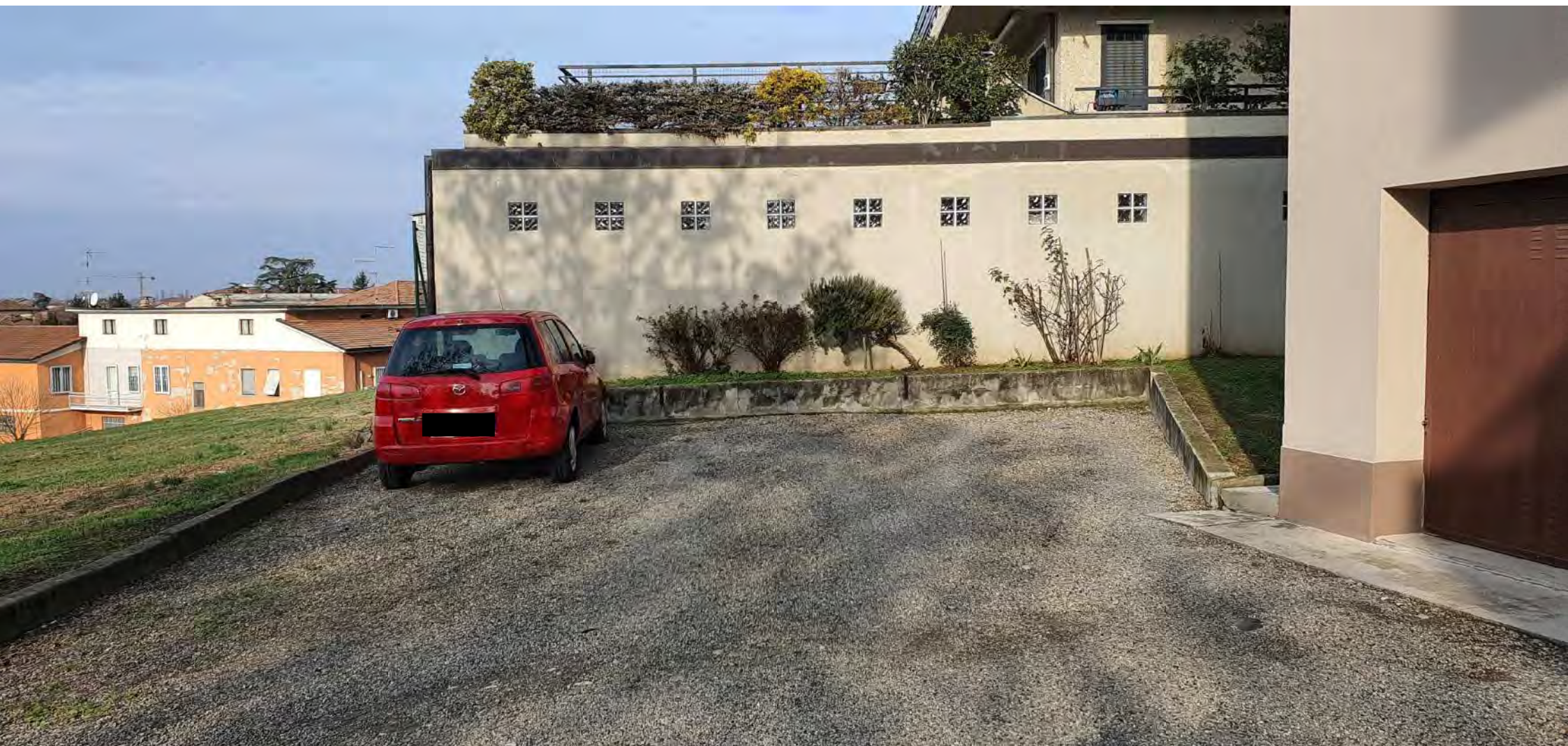
POSTO AUTO NEL CORTILE