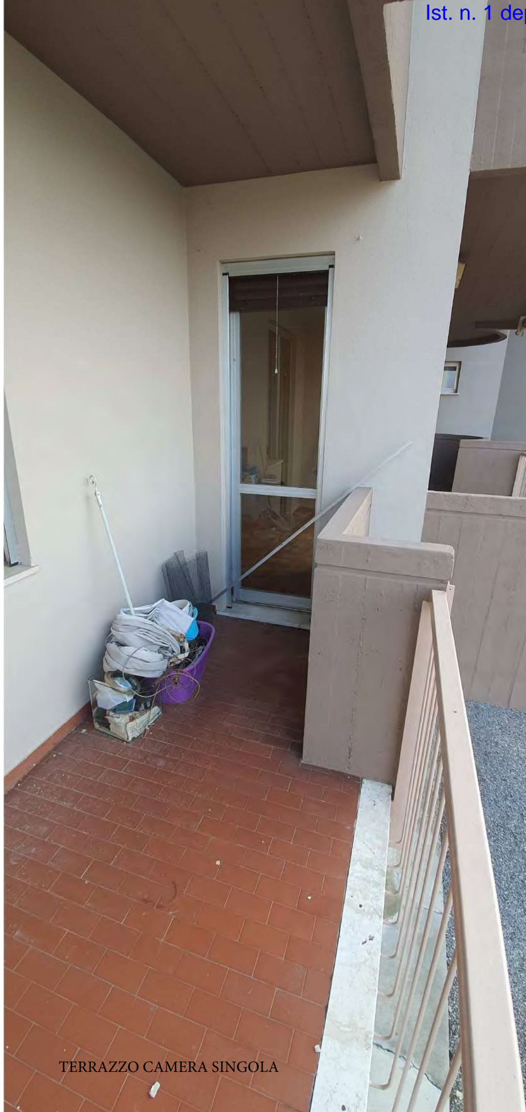
TERRAZZO CAMERA SINGOLA