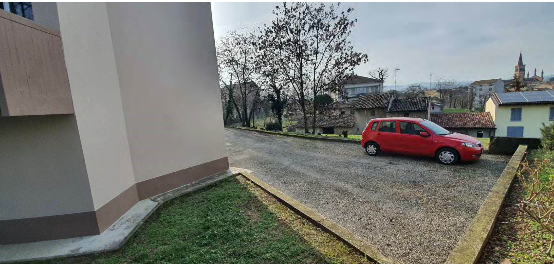
POSTO AUTO CORTILE