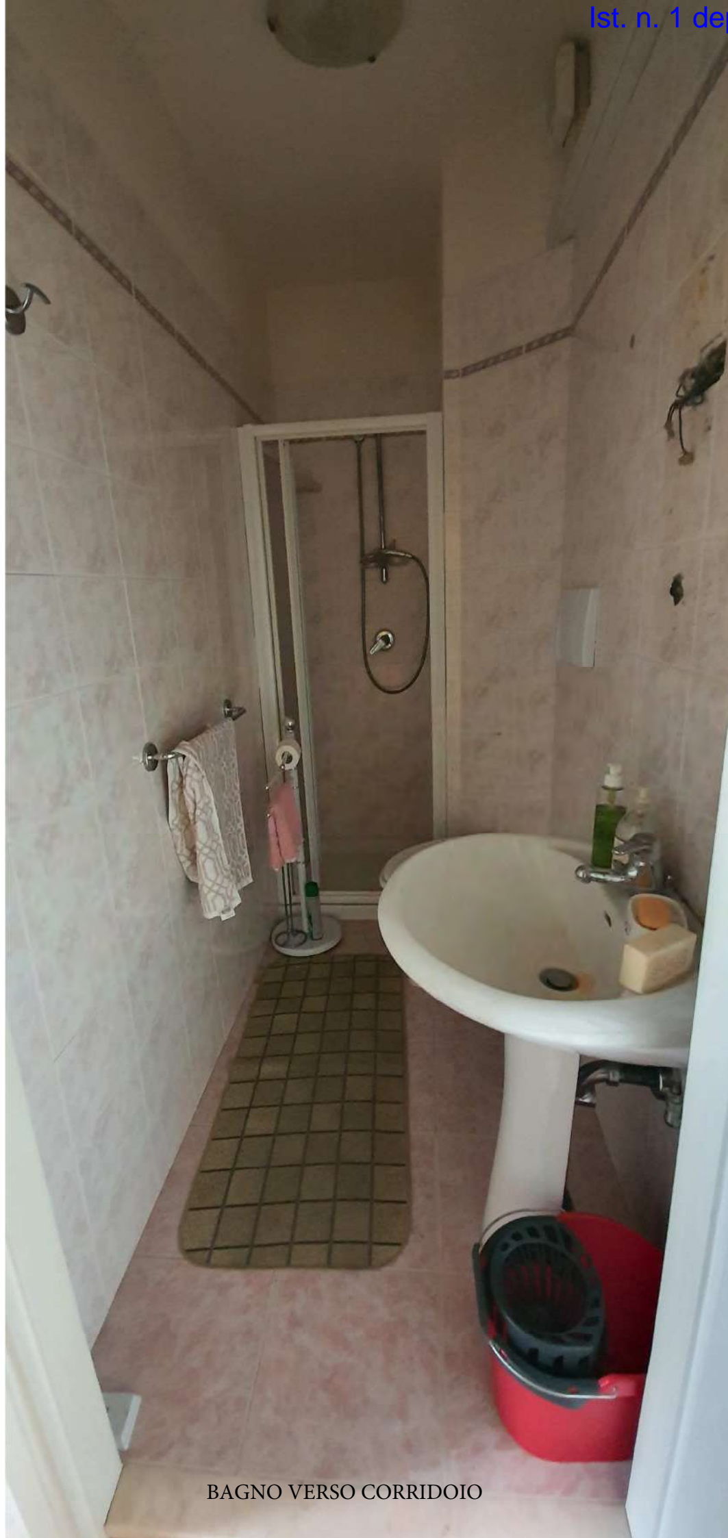
BAGNO VERSO CORRIDOIO