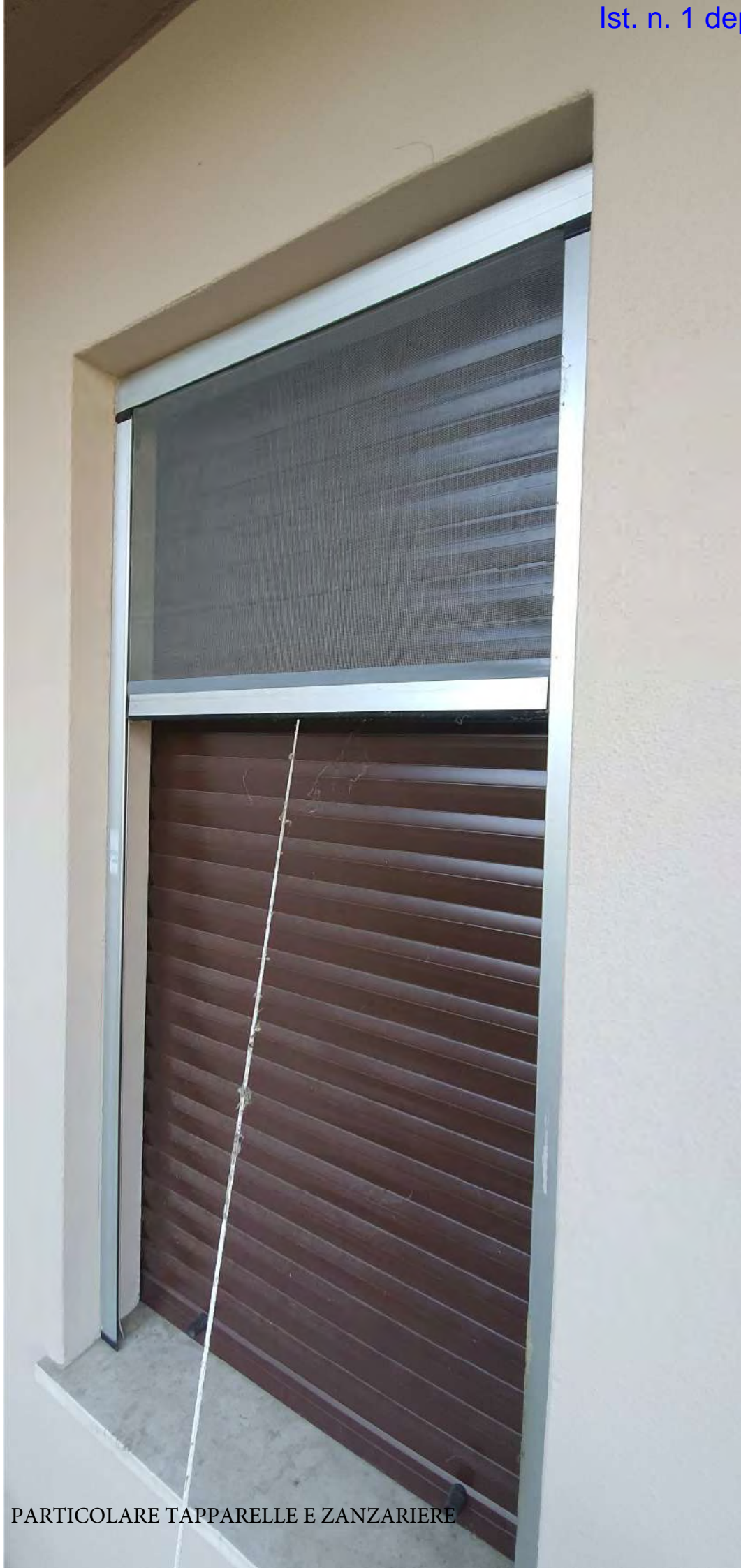
PARTICOLARE TAPPARELLE E ZANZARIERE