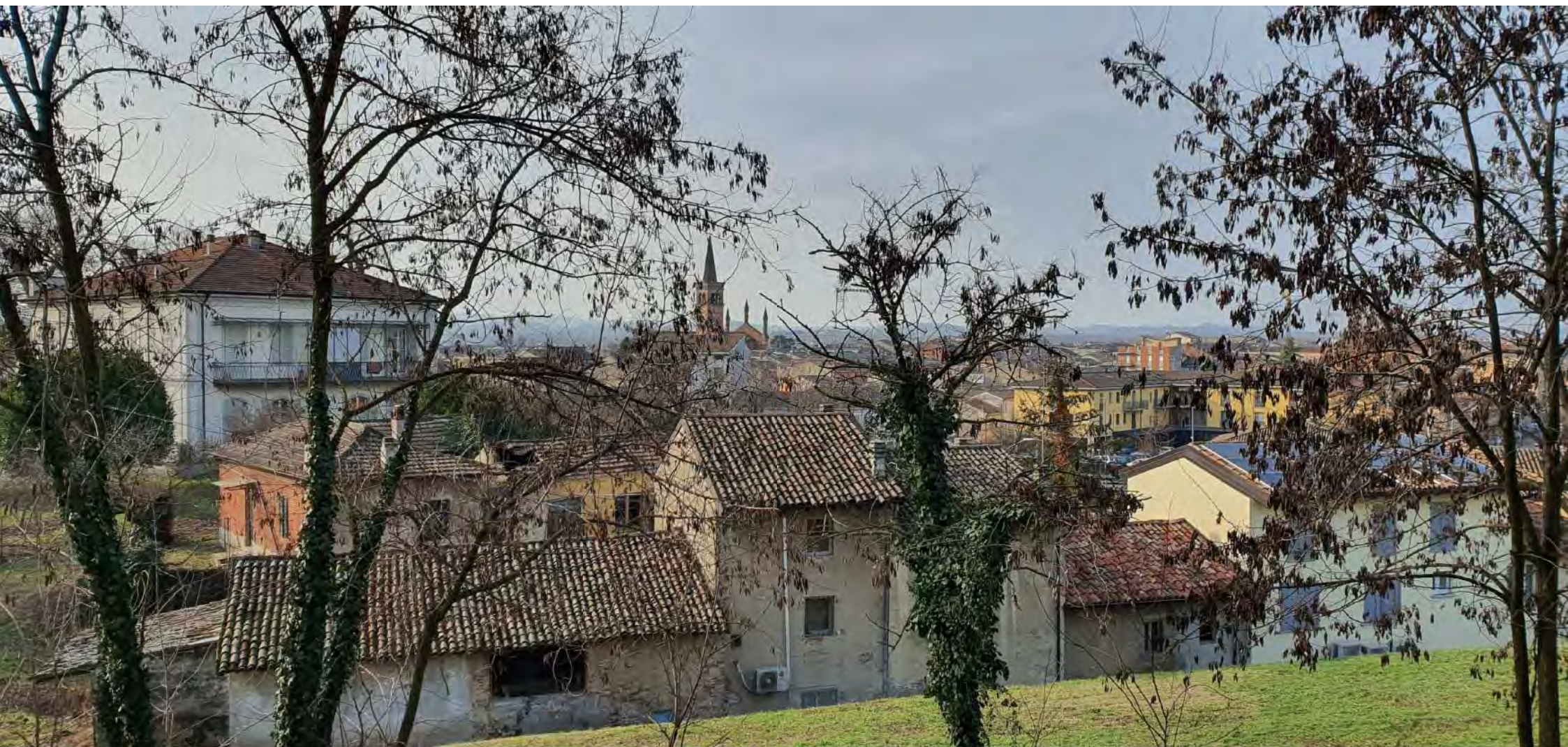
PANORAMA VERSO SUD