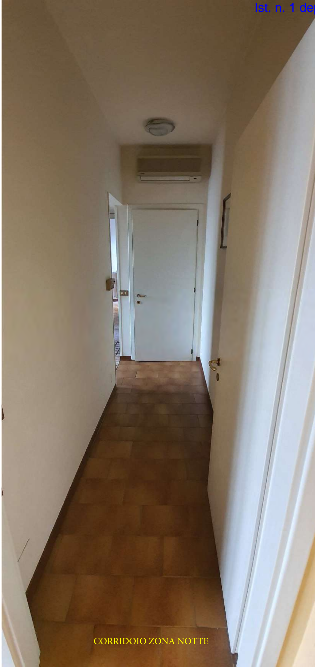
CORRIDOIO ZONA NOTTE