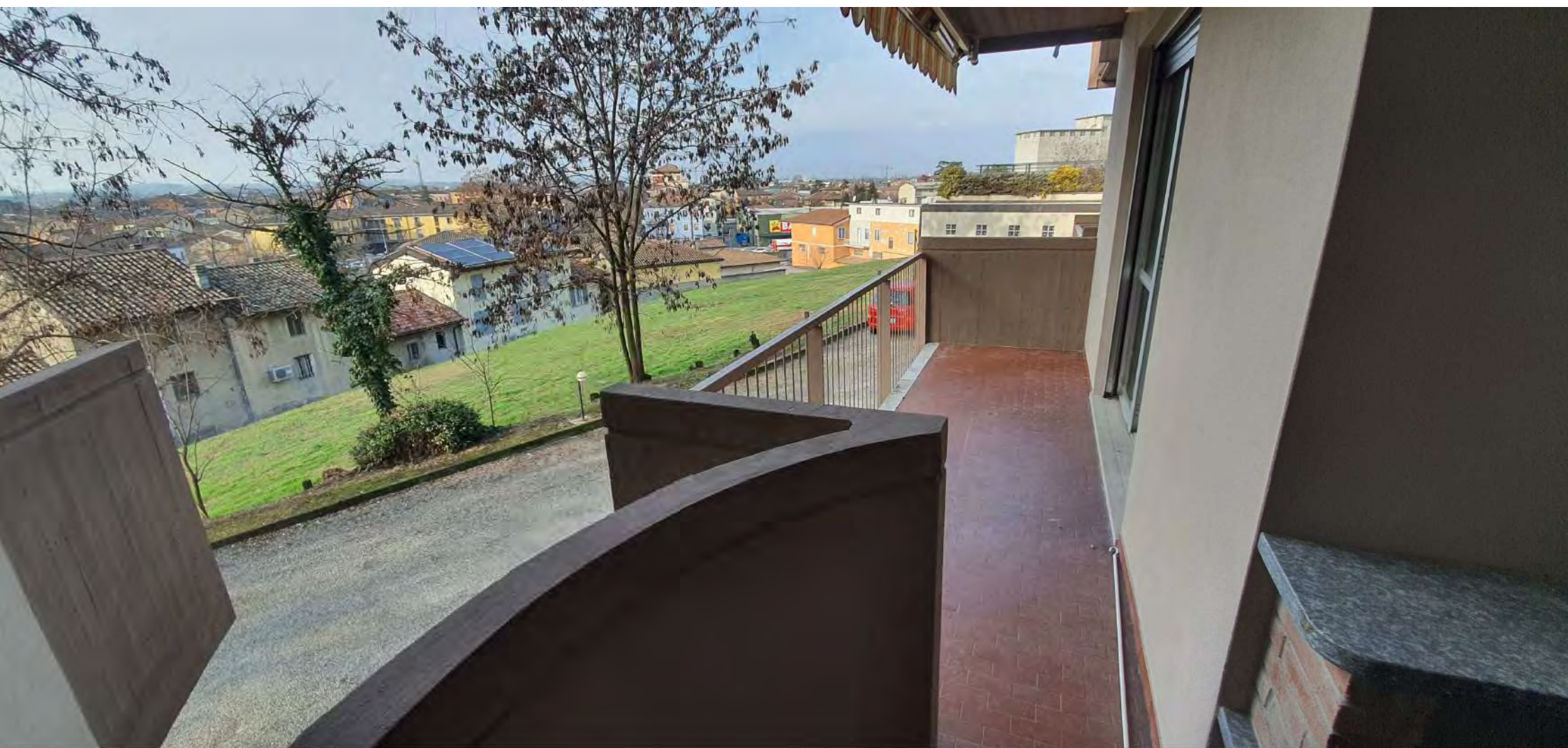
TERRAZZO ZONA GIORNO