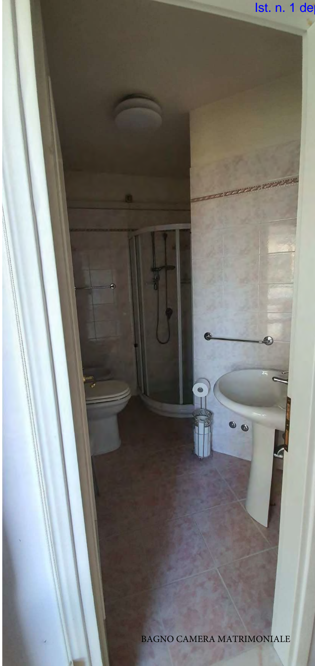
BAGNO CAMERA MATRIMONIALE