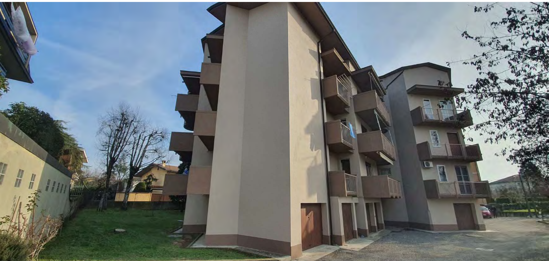
VISTA LATO SUD-OVEST CONDOMINIO