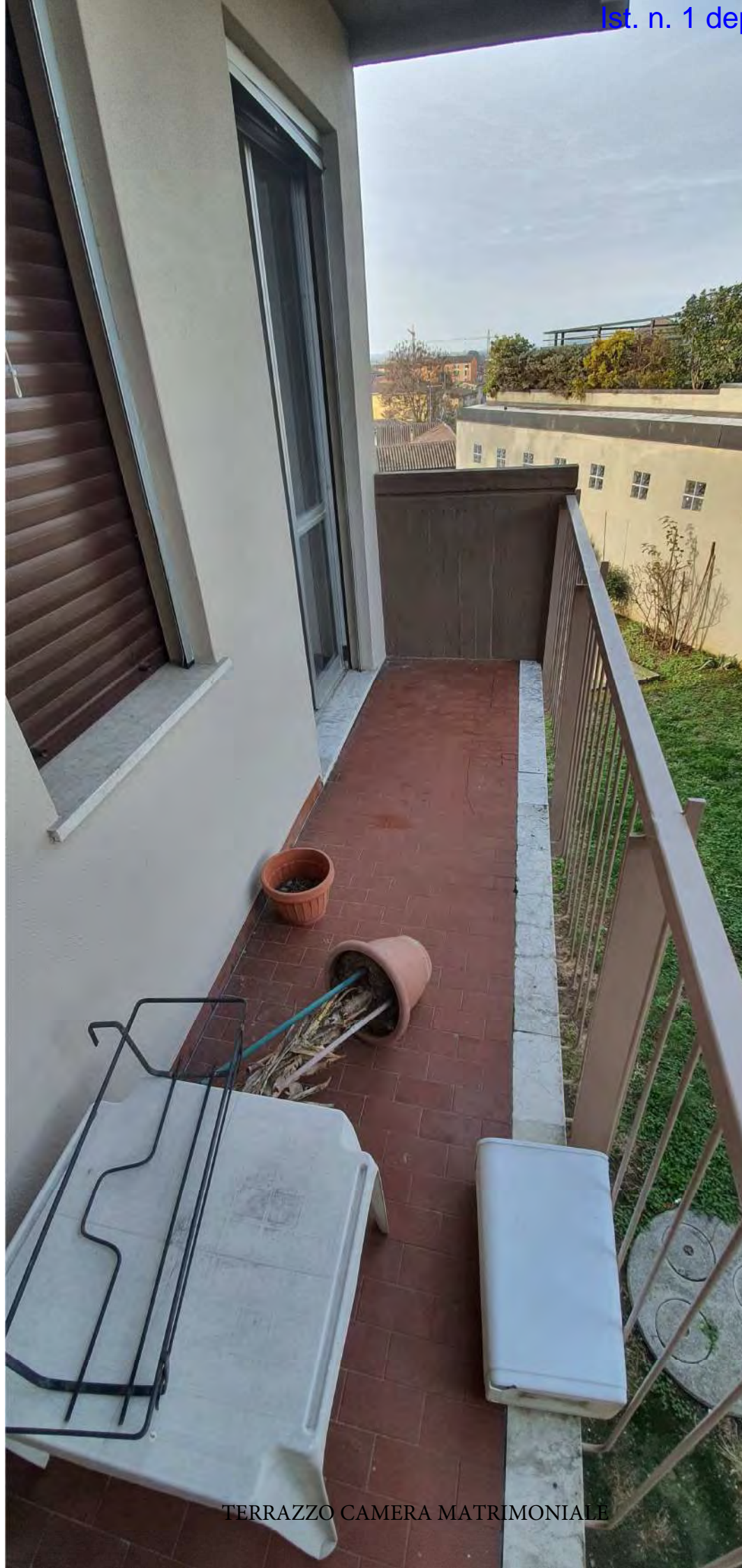
TERRAZZO CAMERA MATRIMONIALE