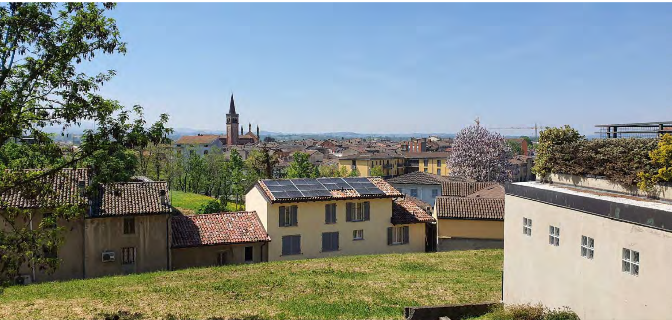
PANORAMA VERSO SUD