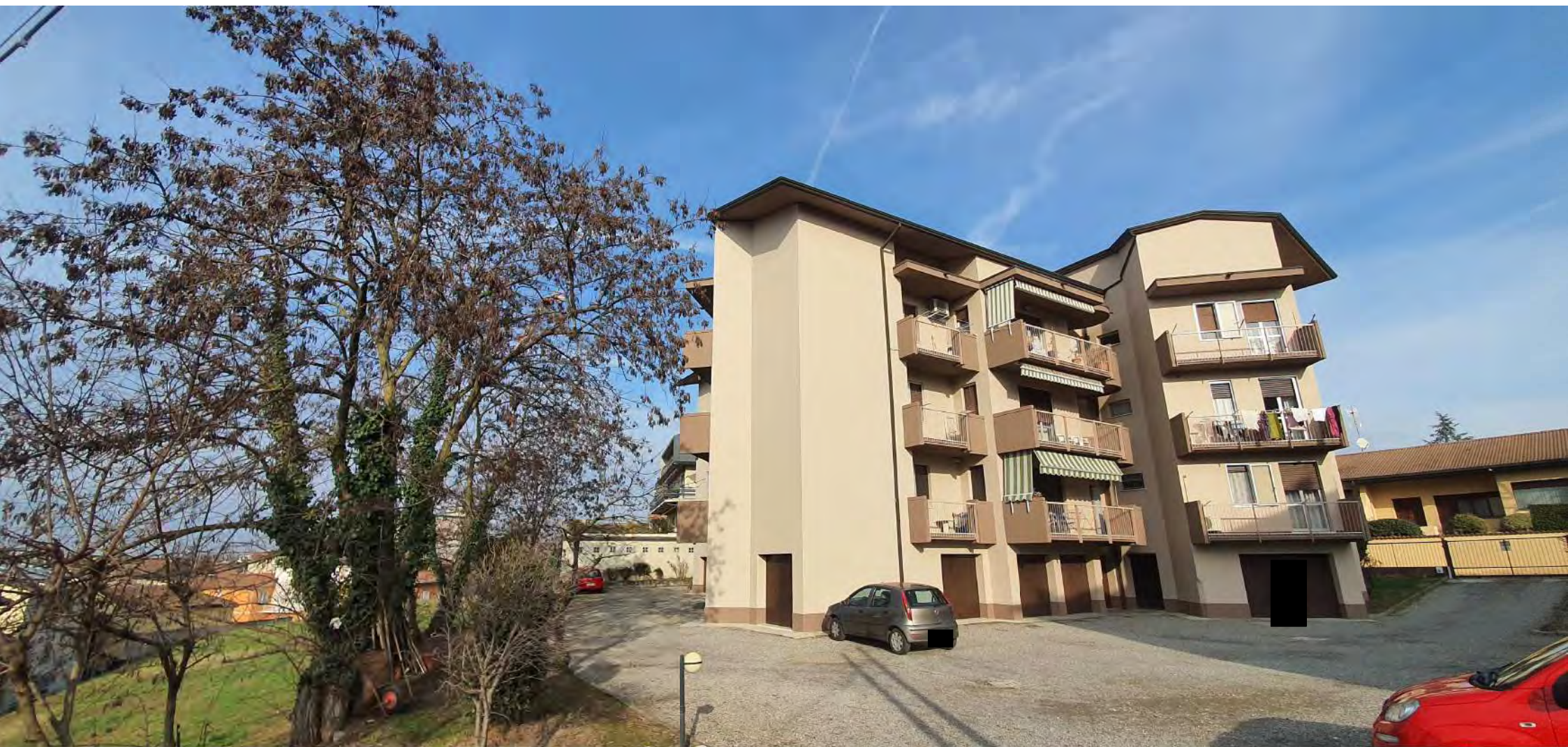
VISTA LATO SUD-EST CONDOMINIO