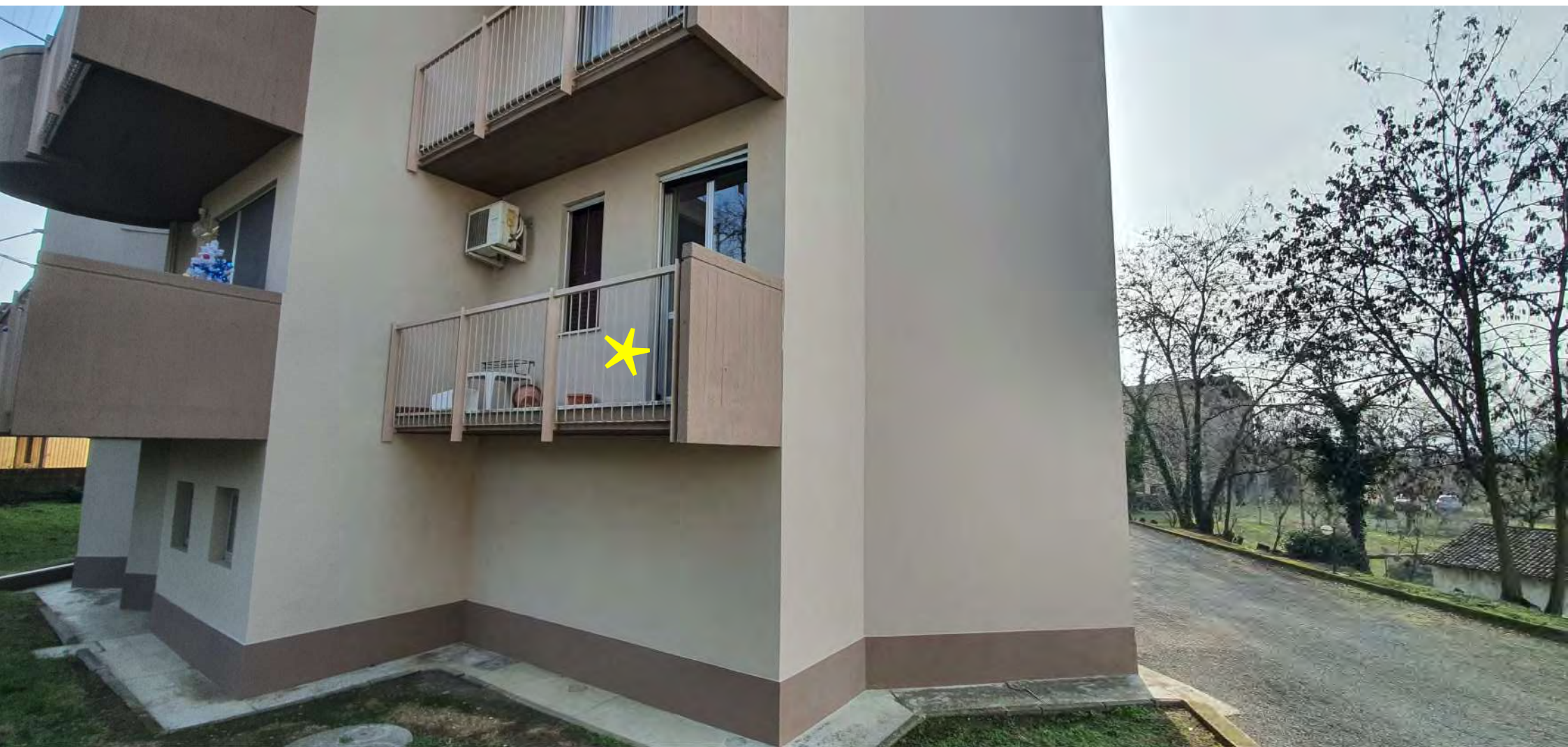
VISTA TERRAZZO CAMERA MATRIMONIALE