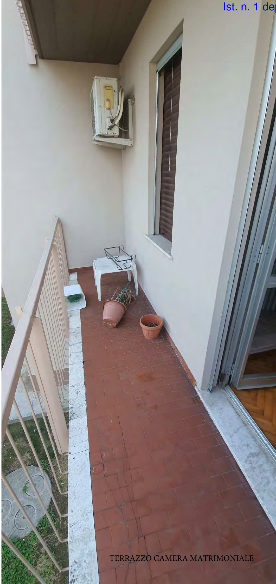
TERRAZZO CAMERA MATRIMONIALE