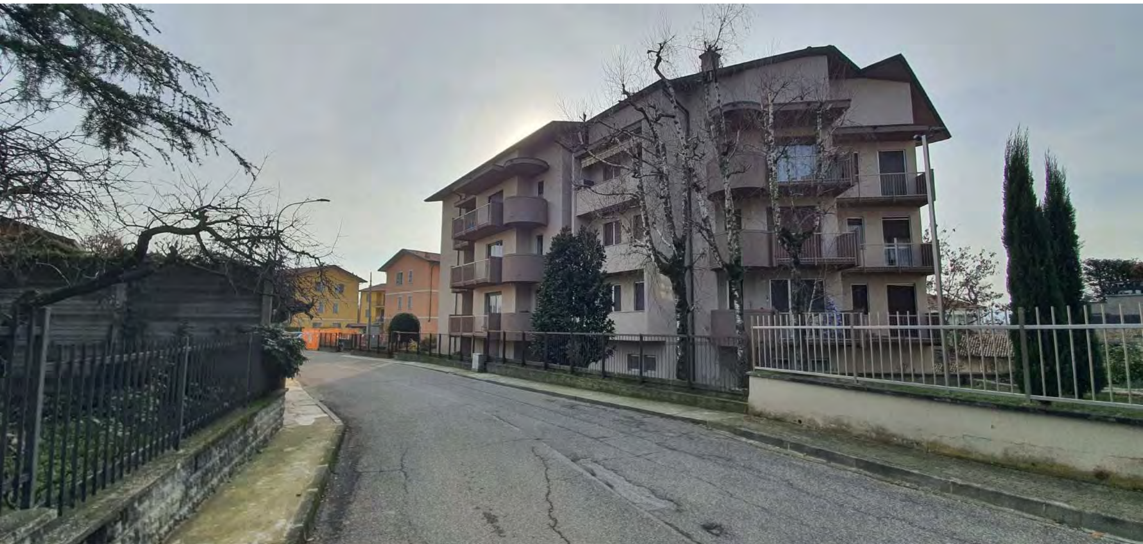
VISTA LATO NORD CONDOMINIO