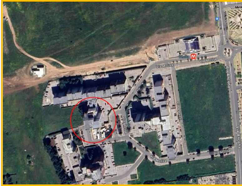
Ortofoto estratta dalla cartografia di Google maps in cui si evidenzia la posizione dell'immobile.

All'unità immobiliare si accede da un cancello prospiciente uno spazio aperto condominiale.