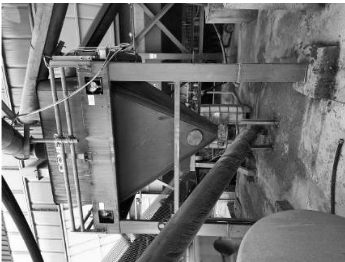
Foto 46 - Impianto di betonaggio, bilancia.