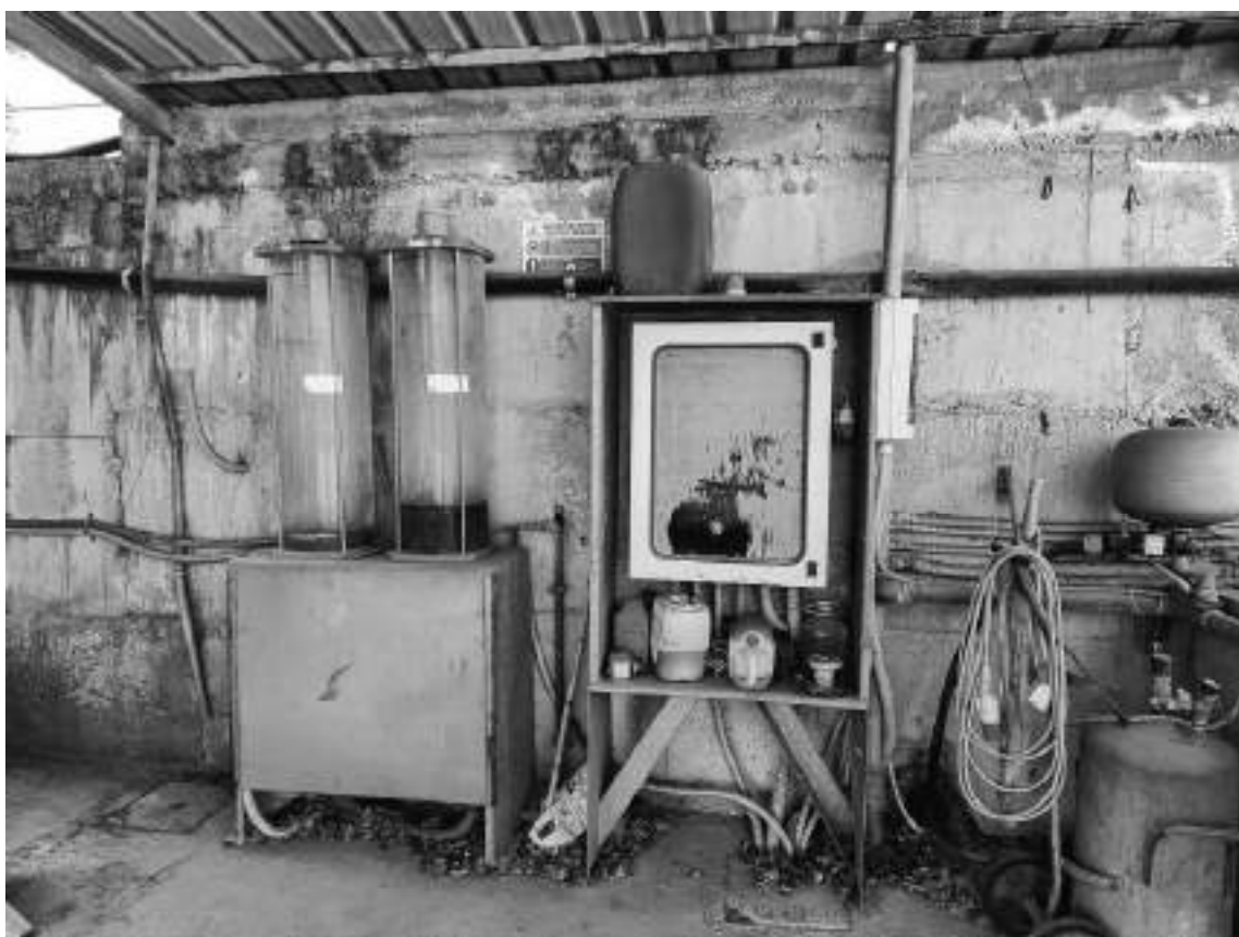
Foto 60 - Impianto di betonaggio, posto esterno miscelazione additivi.