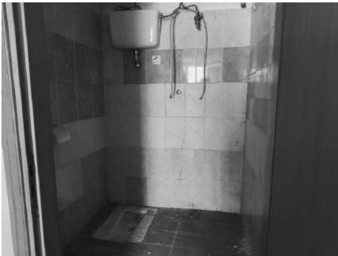
Foto 31 - Fabbricato magazzino e servizi al piano seminterrato.