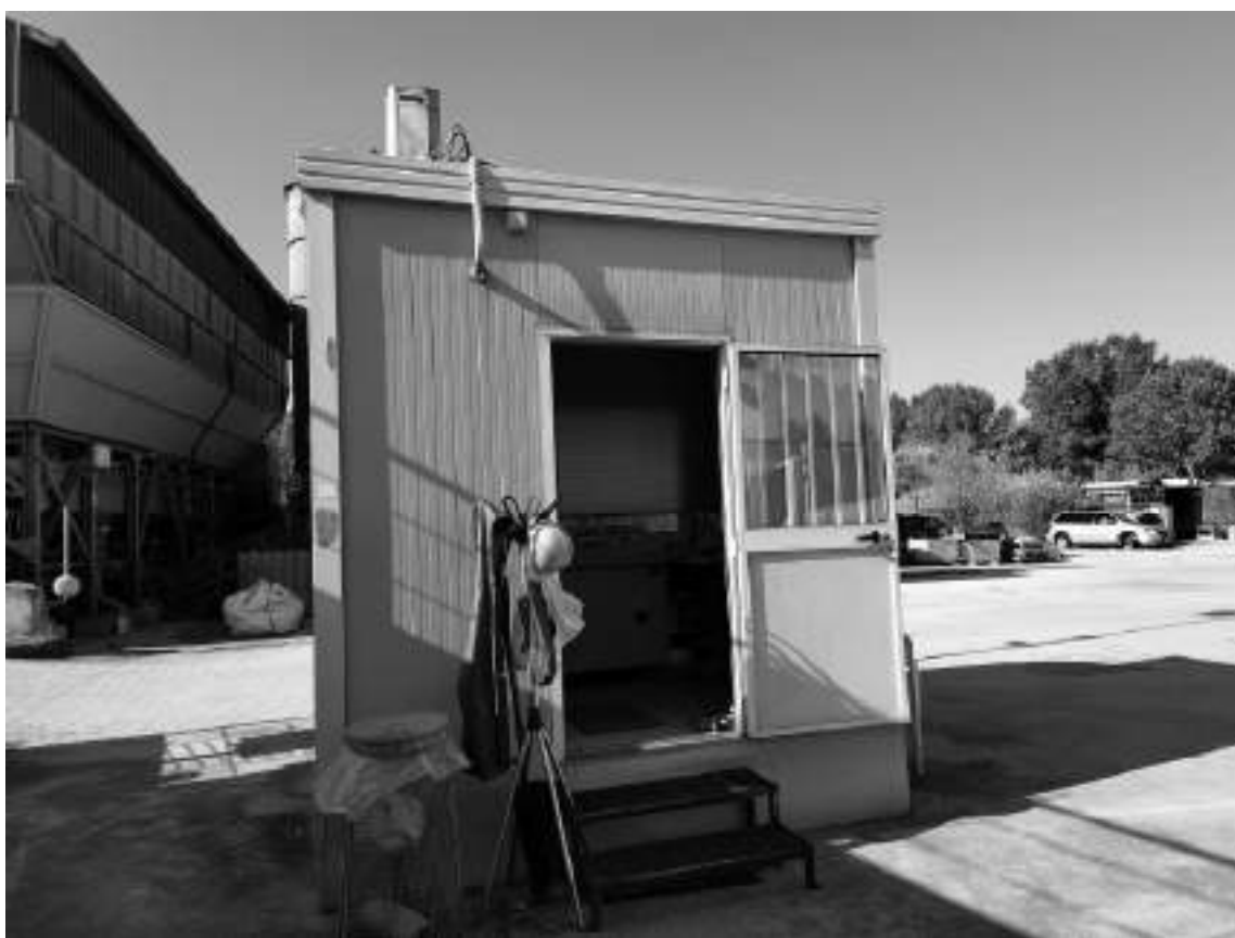
Foto 56 - Impianto di betonaggio, cabina di manovra.