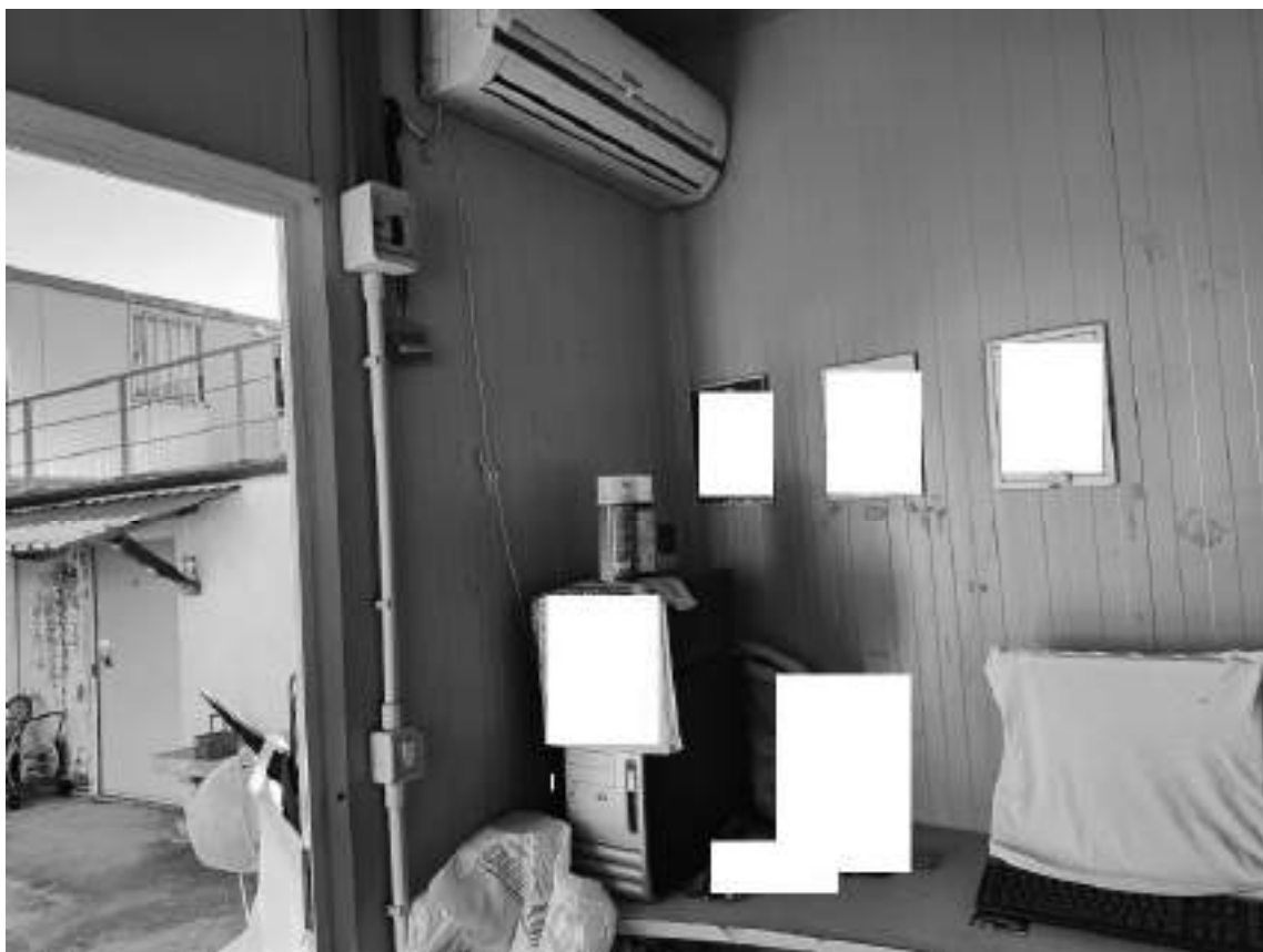
Foto 59 - Impianto di betonaggio, cabina di manovra.