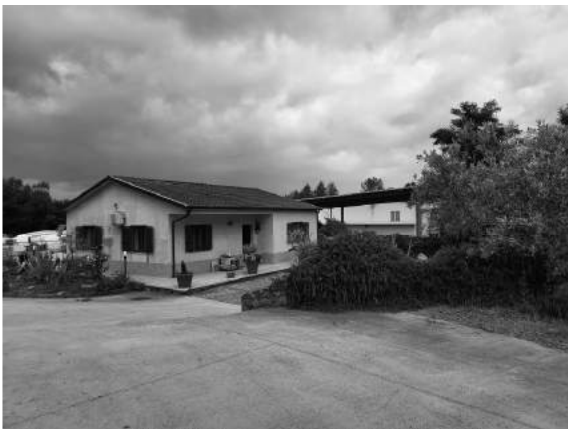
Foto 66 - Terreno, zona pavimentata prossima all'ingresso.