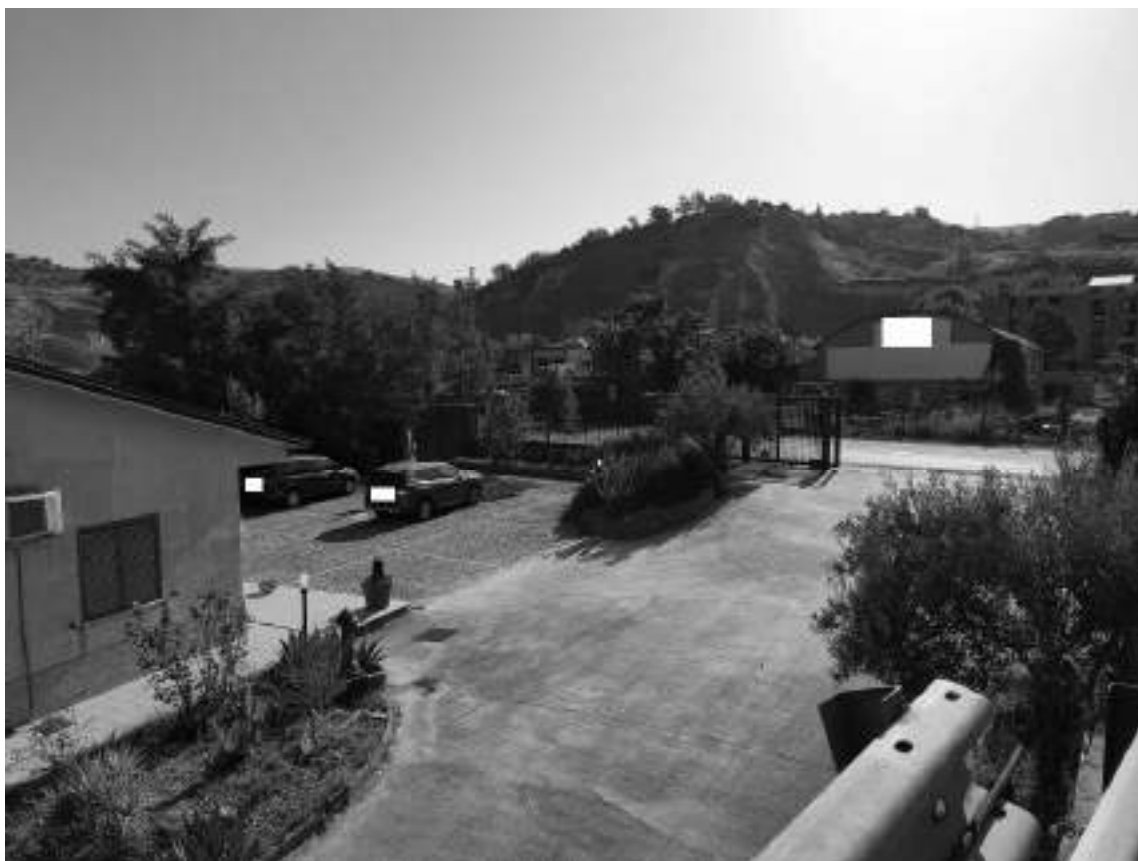
Foto 63 - Terreno, zona pavimentata prossima all'ingresso.