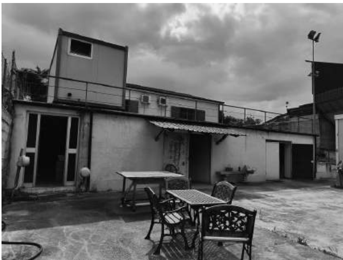
Foto 2 - Magazzino e servizi al piano seminterrato.