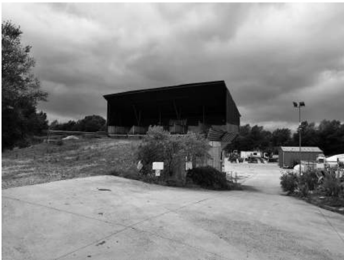
Foto 4 - Terreno Rende, fg.22, p.la 397.