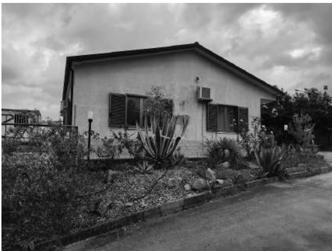
Foto 8 - Fabbricato uffici.