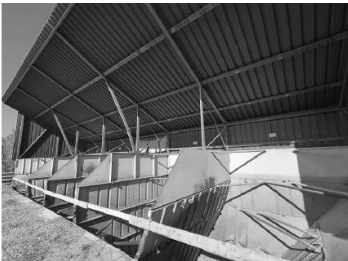
Foto 44 - Impianto di betonaggio, tramogge di carico inerti.