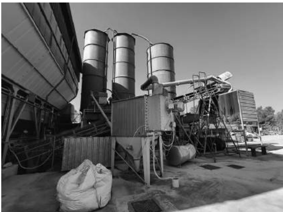
Foto 48 - Impianto di betonaggio, filtro aspirazione polveri e nastro trasportatore.