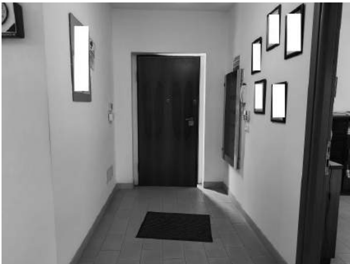
Foto 15 - Fabbricato uffici, ingresso.