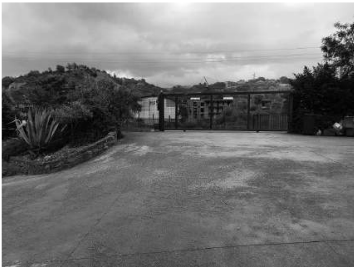
Foto 61 - Terreno, zona pavimentata prossima all'ingresso.