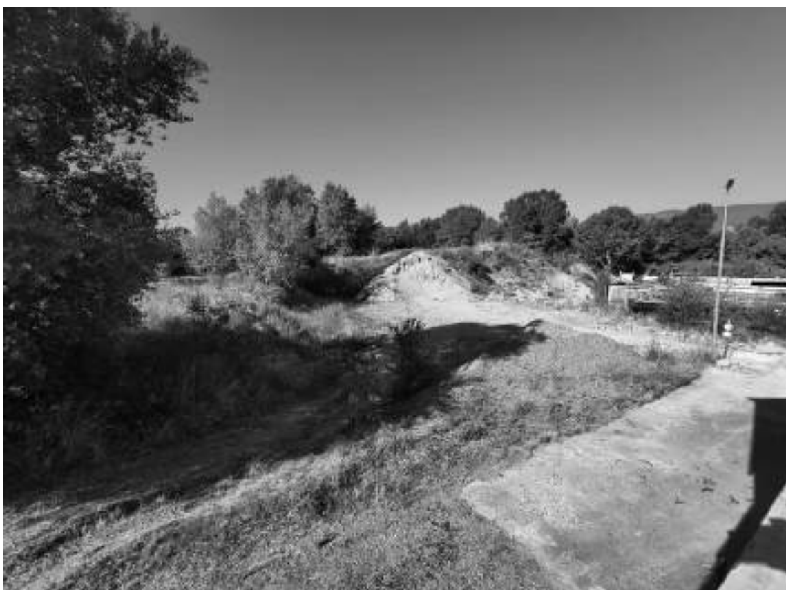
Foto 74 - Terreno, zona non pavimentata.