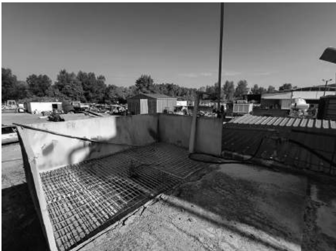
Foto 55 - Depuratore residui autobetoniere.