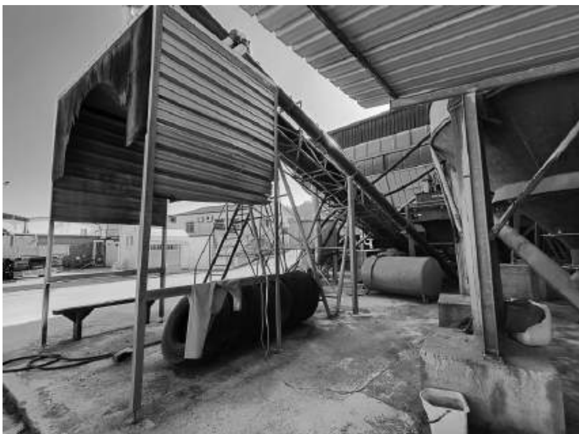
Foto 50 - Impianto di betonaggio, posto di carico autobetoniere.