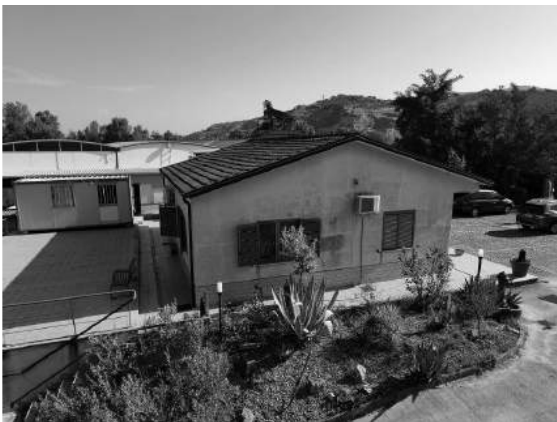
Foto 10 - Fabbricato uffici.