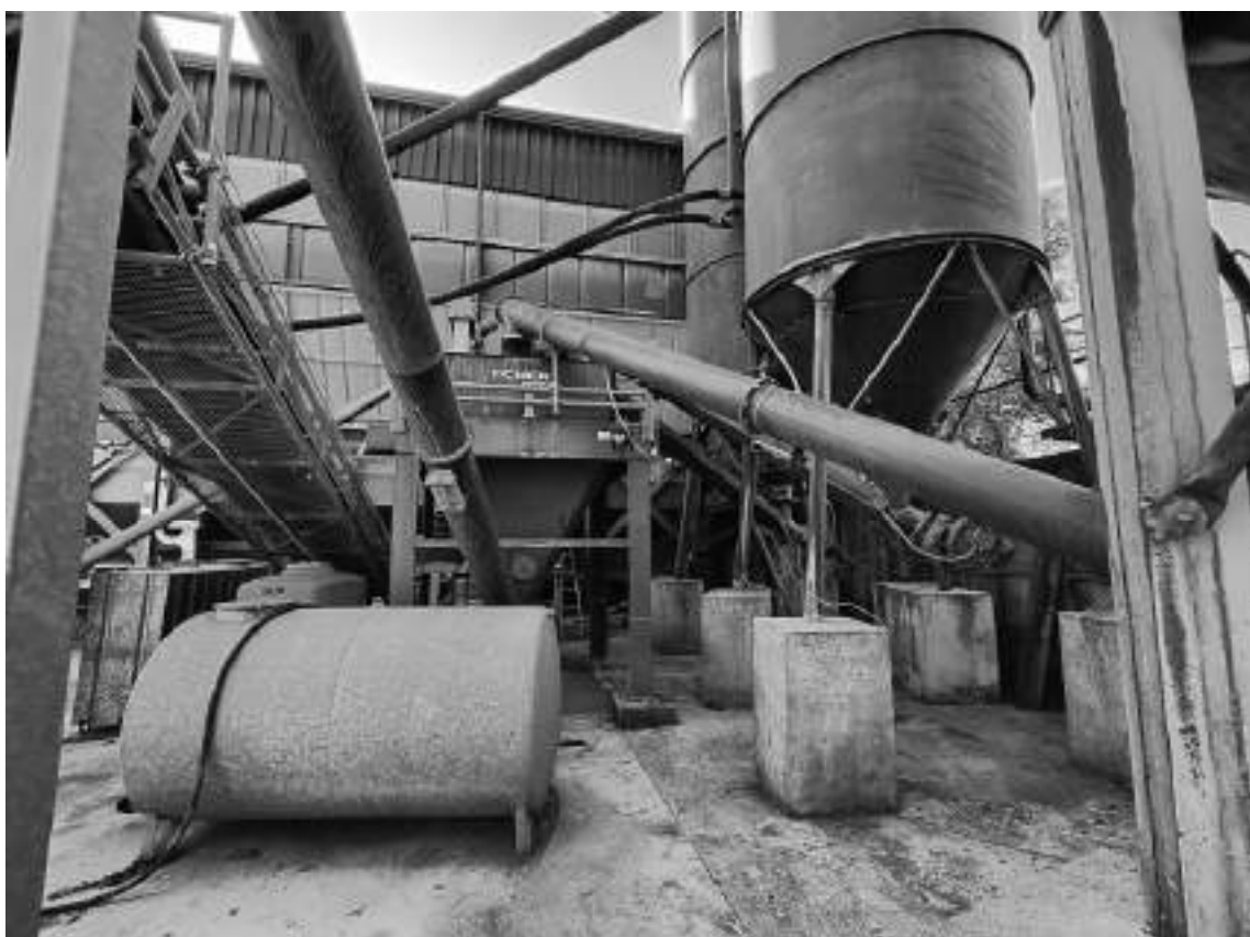
Foto 40 - Impianto di betonaggio.