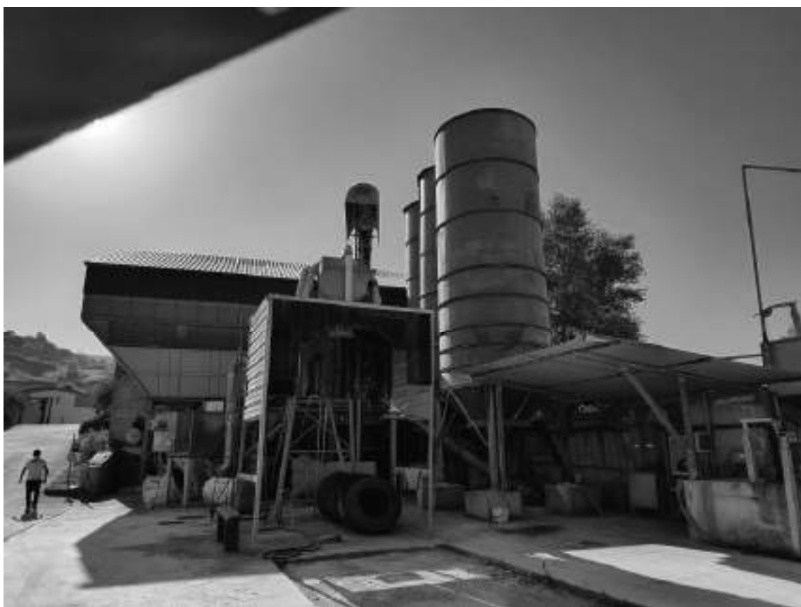
Foto 34 - Impianto di betonaggio.