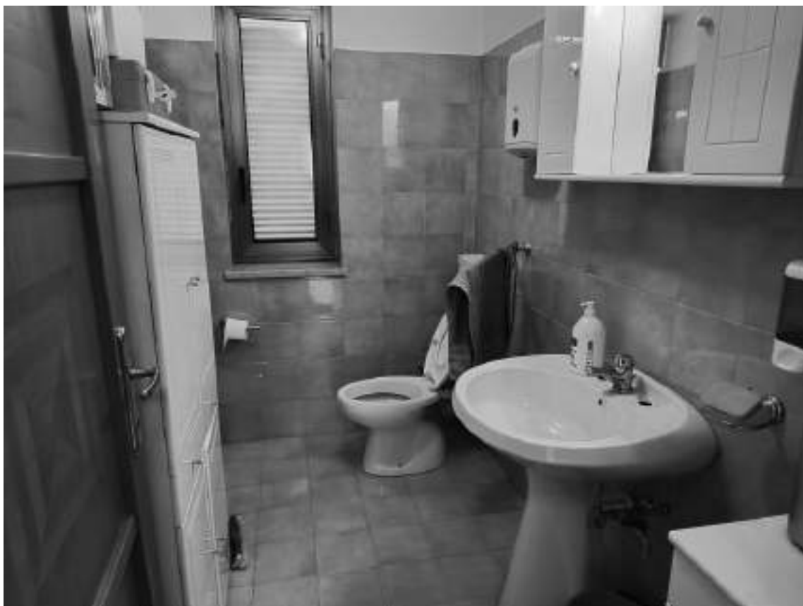
Foto 17 - Fabbricato uffici, bagno.