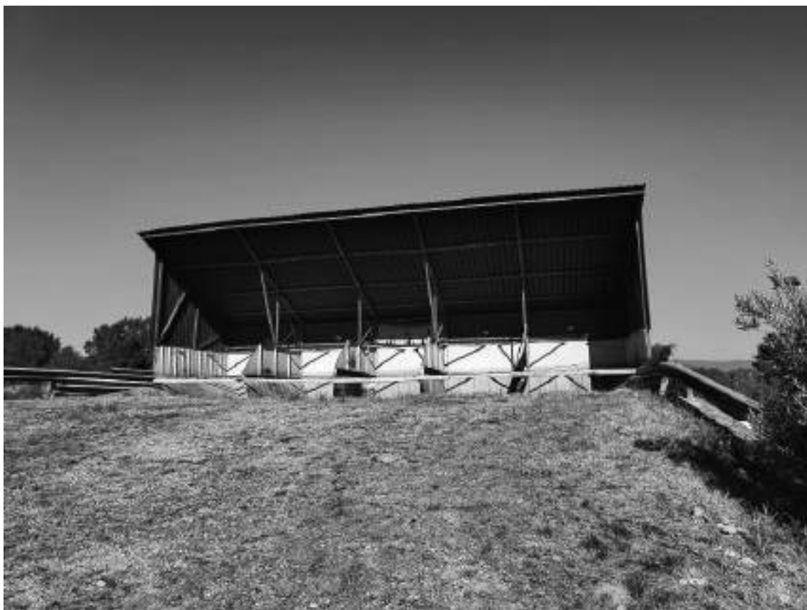
Foto 43 - Impianto di betonaggio, tramogge di carico inerti.