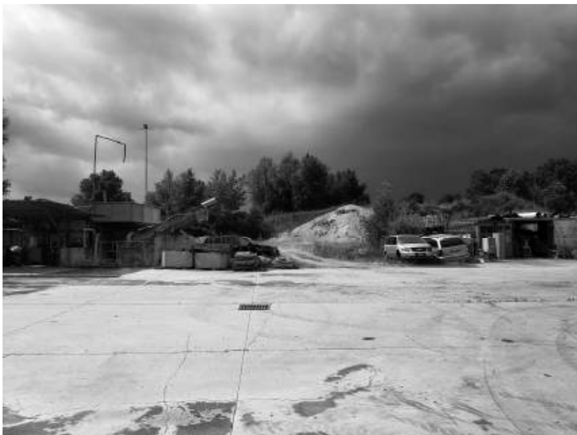
Foto 69 - Terreno, zona pavimentata impianto di betonaggio.