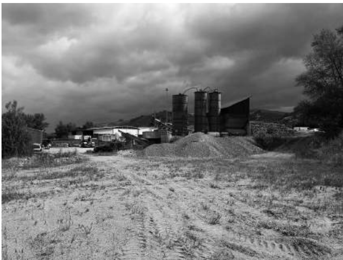
Foto 6 - Terreno Rende, fg.22, p.la 397.