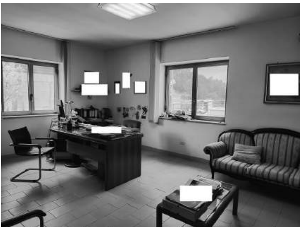
Foto 12 - Fabbricato uffici, camera 2.