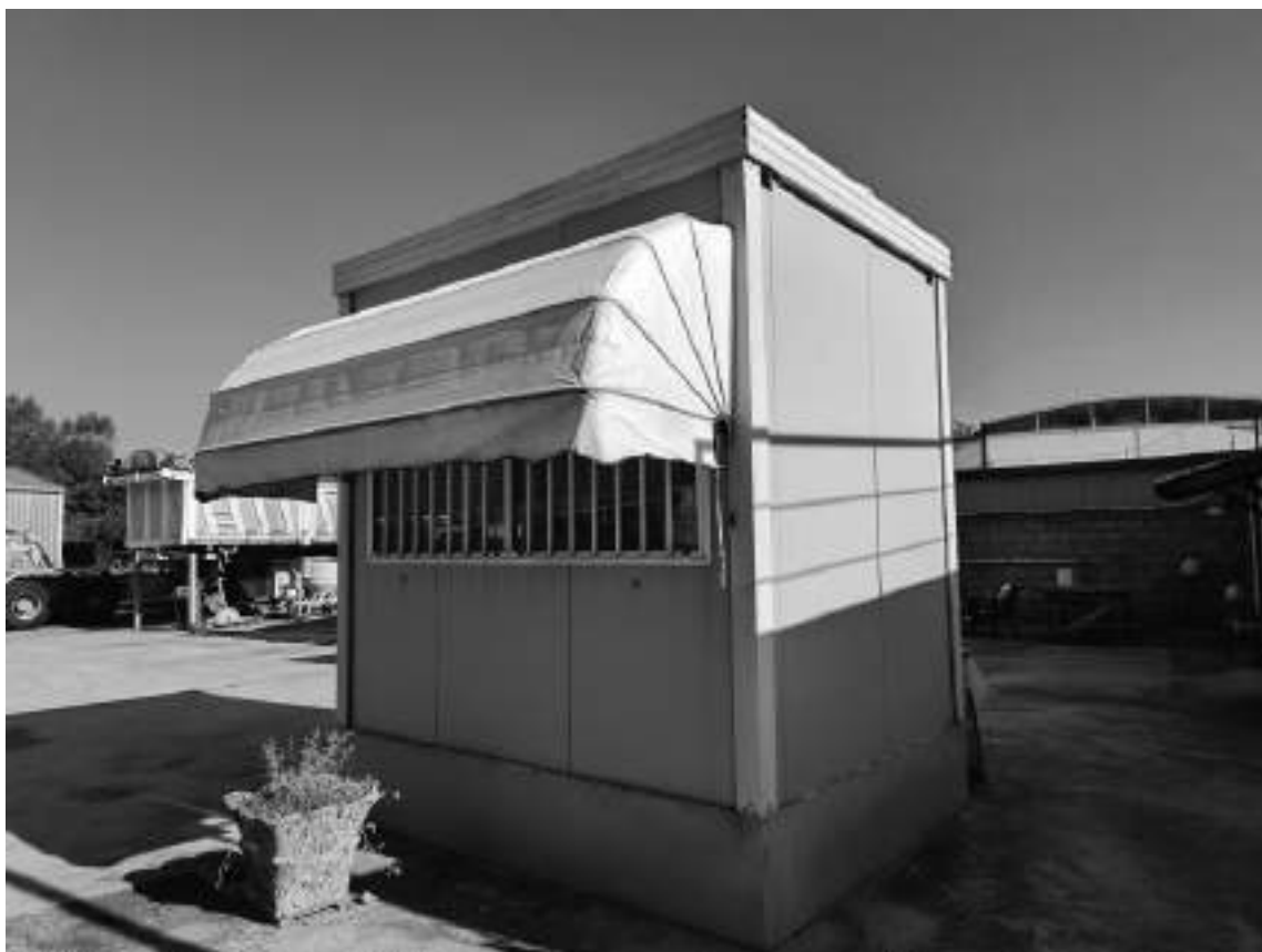
Foto 57 - Impianto di betonaggio, cabina di manovra.