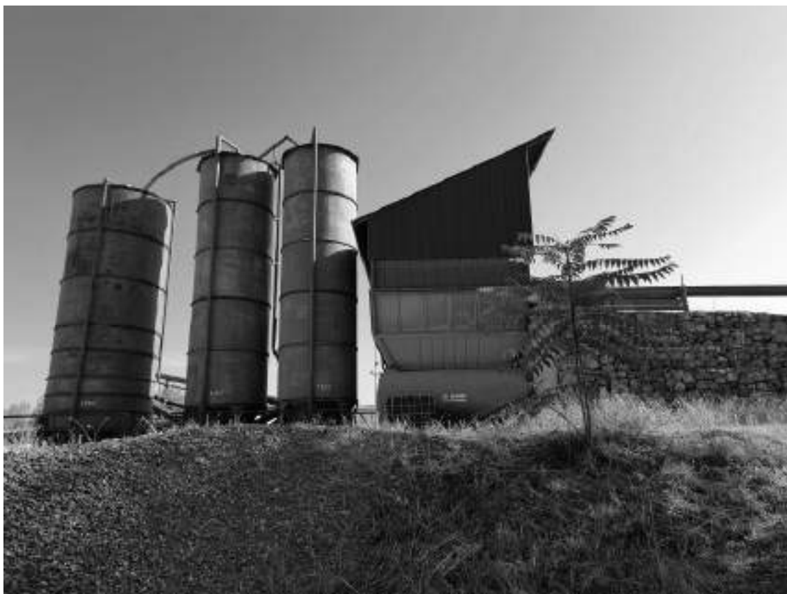
Foto 37 - Impianto di betonaggio.