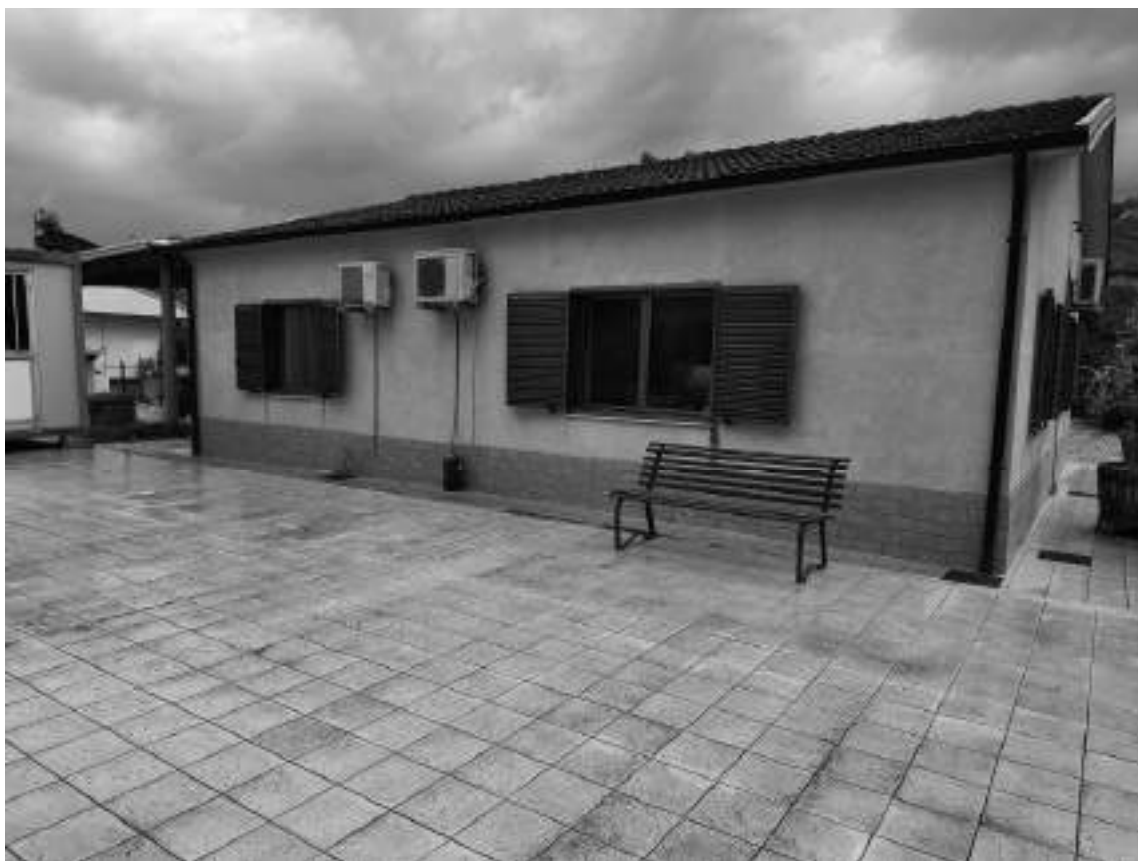
Foto 9 - Fabbricato uffici.