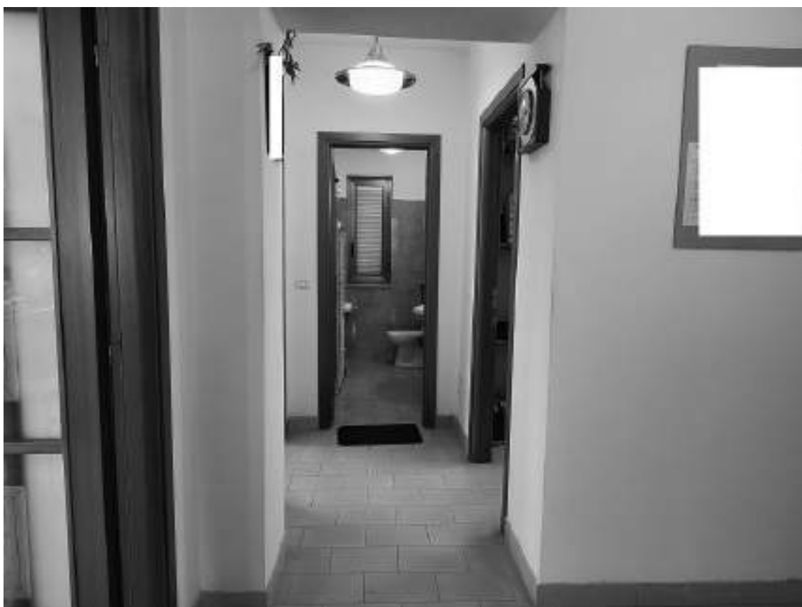
Foto 16 - Fabbricato uffici, disimpegno.