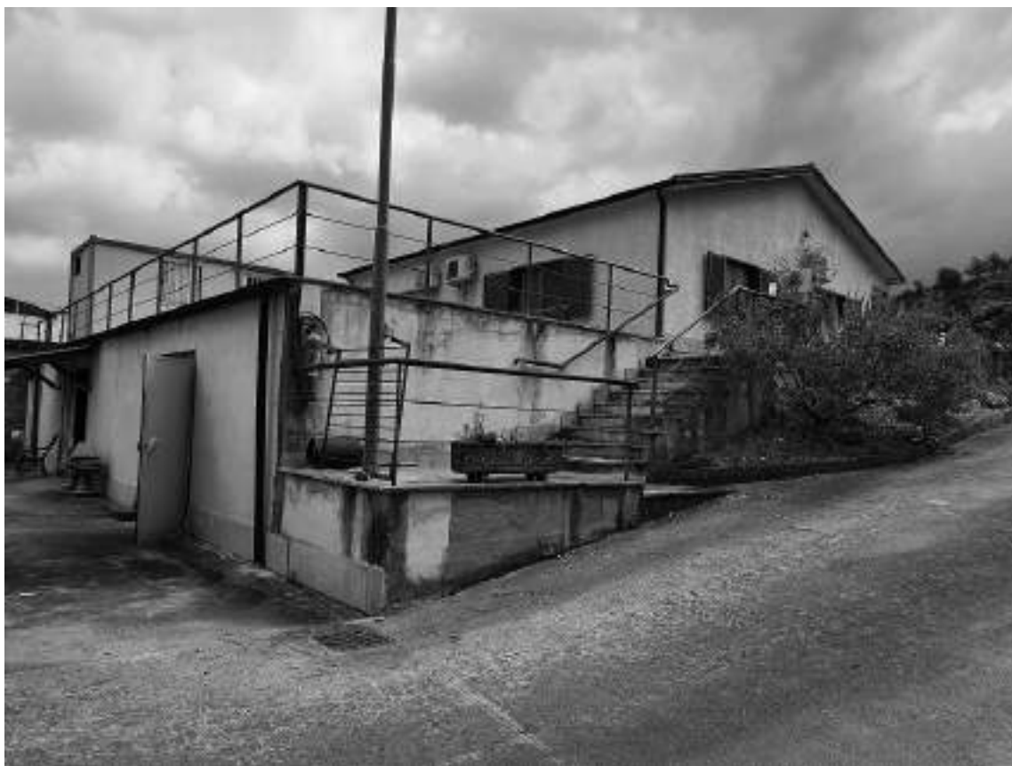
Foto 21 - Fabbricato magazzino e servizi al piano seminterrato.