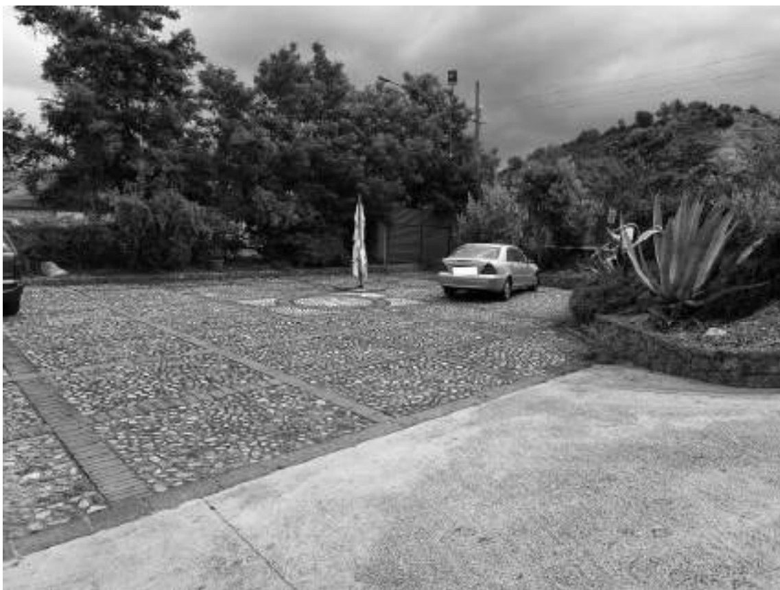
Foto 67 - Terreno, zona pavimentata prossima all'ingresso.