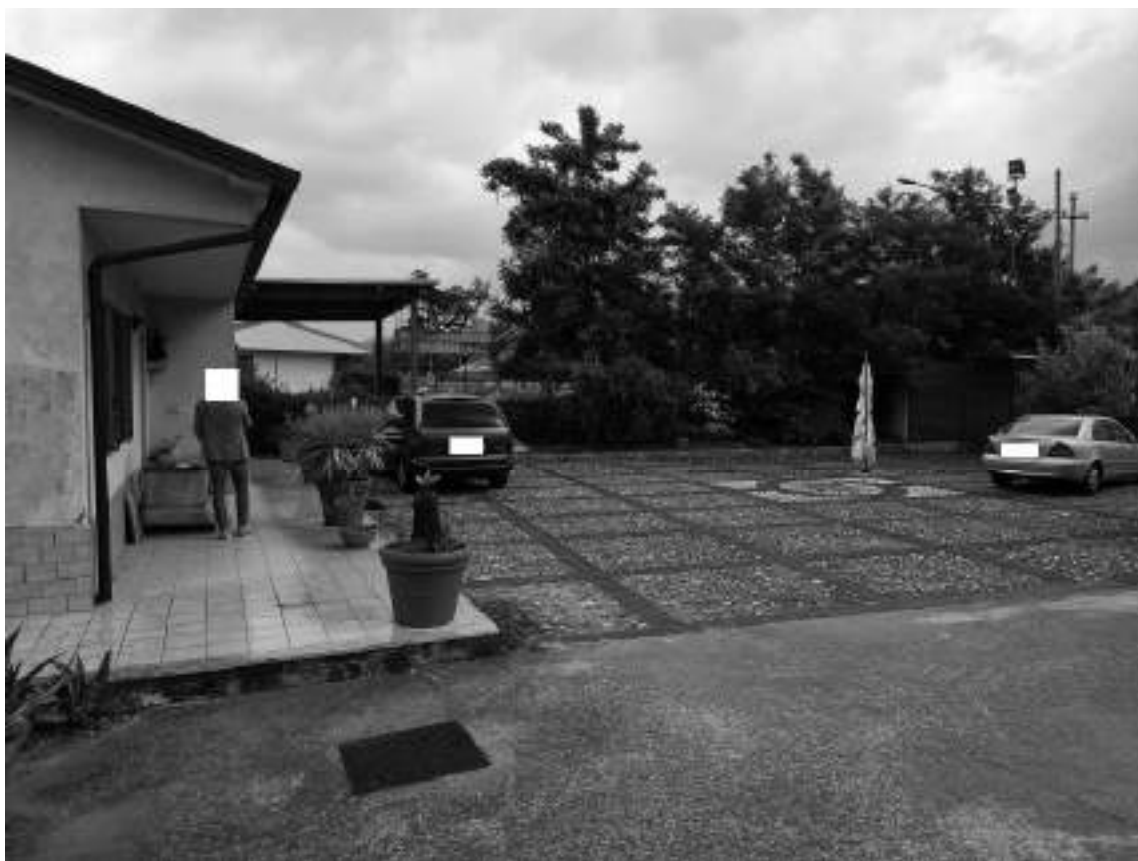
Foto 18 - Fabbricato uffici, corte esterna.