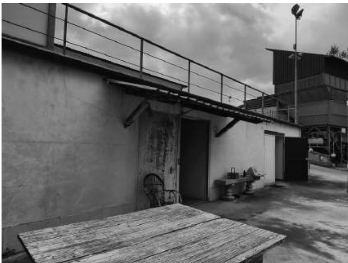
Foto 24 - Fabbricato magazzino e servizi al piano seminterrato.