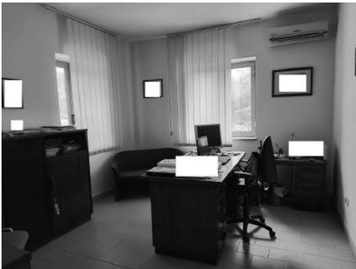
Foto 11 - Fabbricato uffici, camera 1.