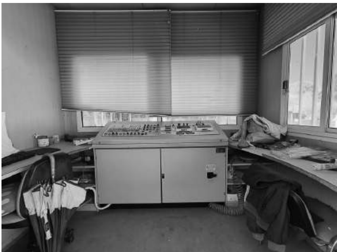
Foto 58 - Impianto di betonaggio, cabina di manovra