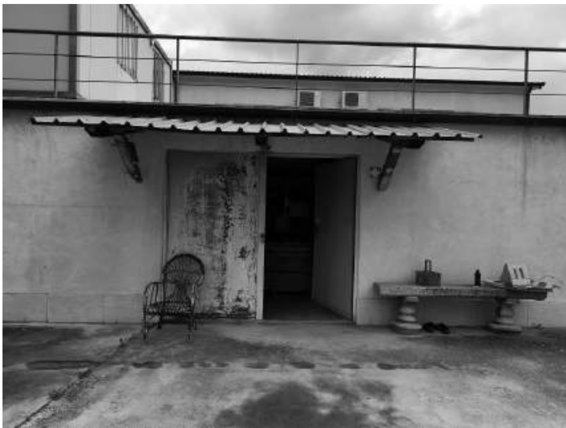
Foto 23 - Fabbricato magazzino e servizi al piano seminterrato.