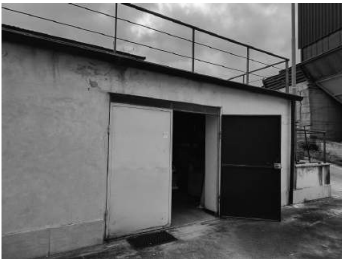
Foto 22 - Fabbricato magazzino e servizi al piano seminterrato.