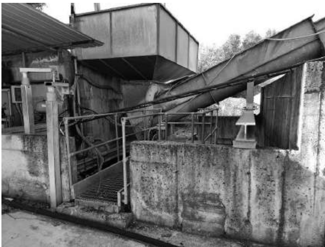
Foto 54 - Depuratore residui autobetoniere.