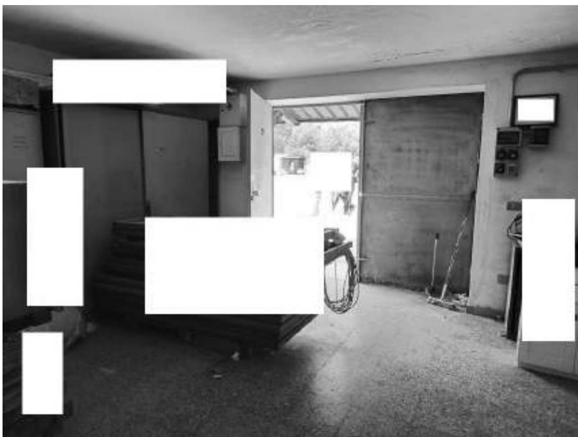
Foto 28 - Fabbricato magazzino e servizi al piano seminterrato.