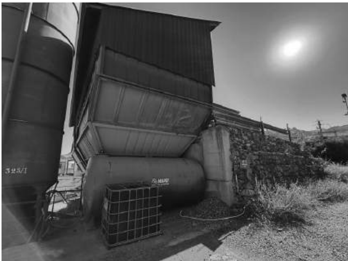
Foto 41 - Impianto di betonaggio, tramogge di carico inerti e terrapieno con muro in gabbioni.