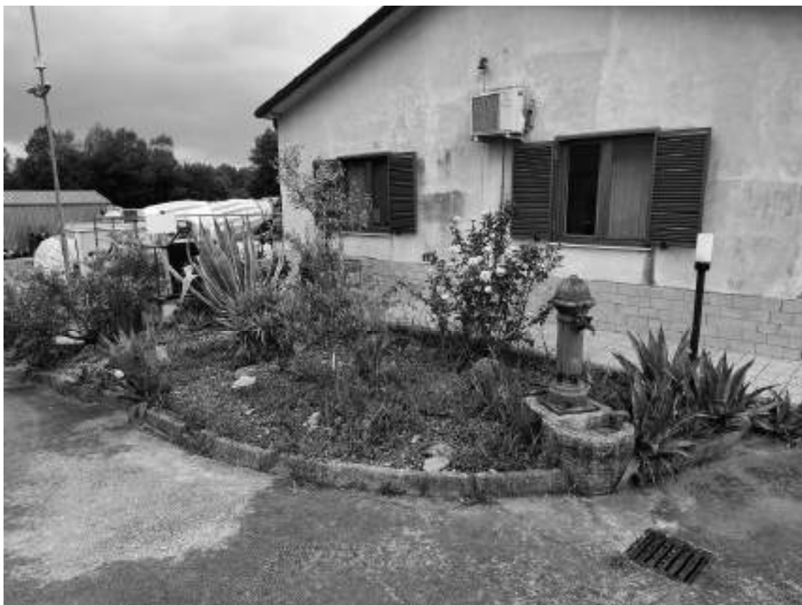
Foto 19 - Fabbricato uffici, corte esterna.