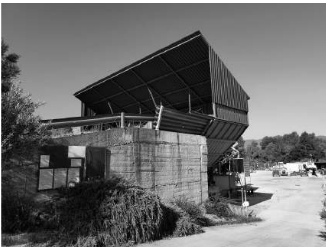
Foto 38 - Impianto di betonaggio.