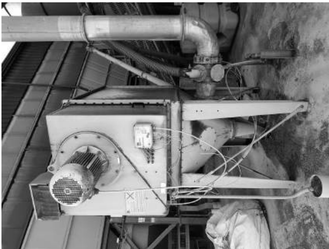
Foto 51 - Impianto di betonaggio, filtro aspirazione polveri.