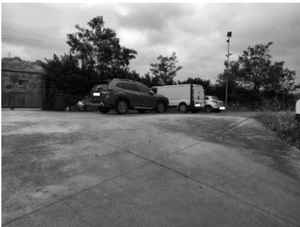
Foto 62 - Terreno, zona pavimentata prossima all'ingresso.