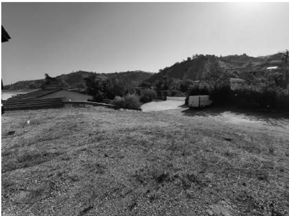
Foto 72 - Terreno, zona non pavimentata.