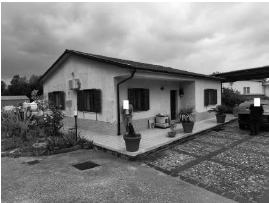
Foto 1 - Fabbricato uffici.