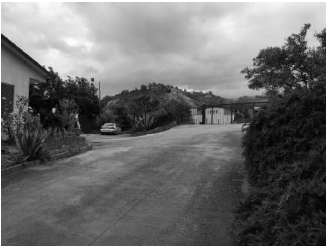
Foto 68 - Terreno, zona pavimentata prossima all'ingresso.