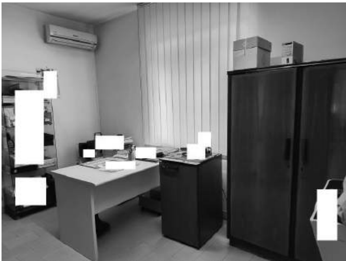
Foto 13 - Fabbricato uffici, camera 3.