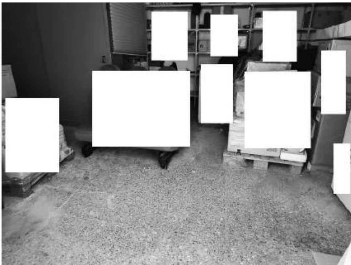
Foto 27 - Fabbricato magazzino e servizi al piano seminterrato.