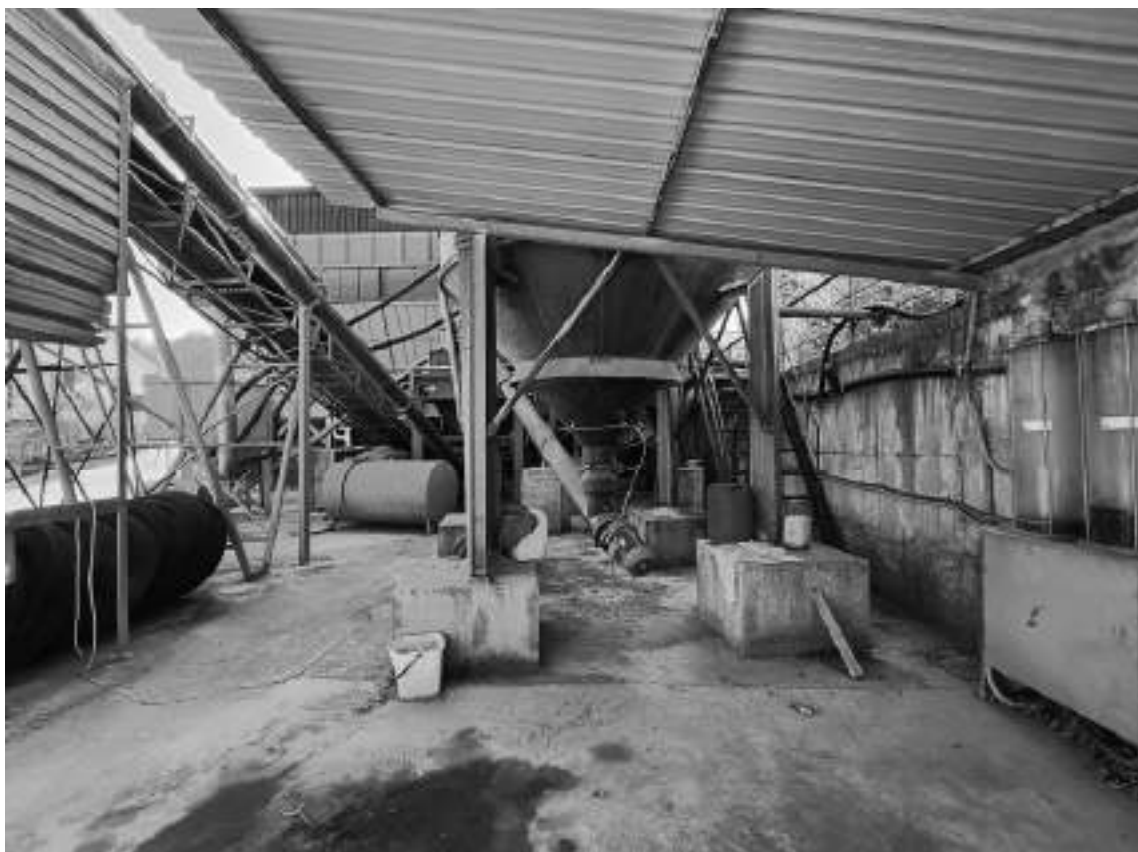
Foto 39 - Impianto di betonaggio.