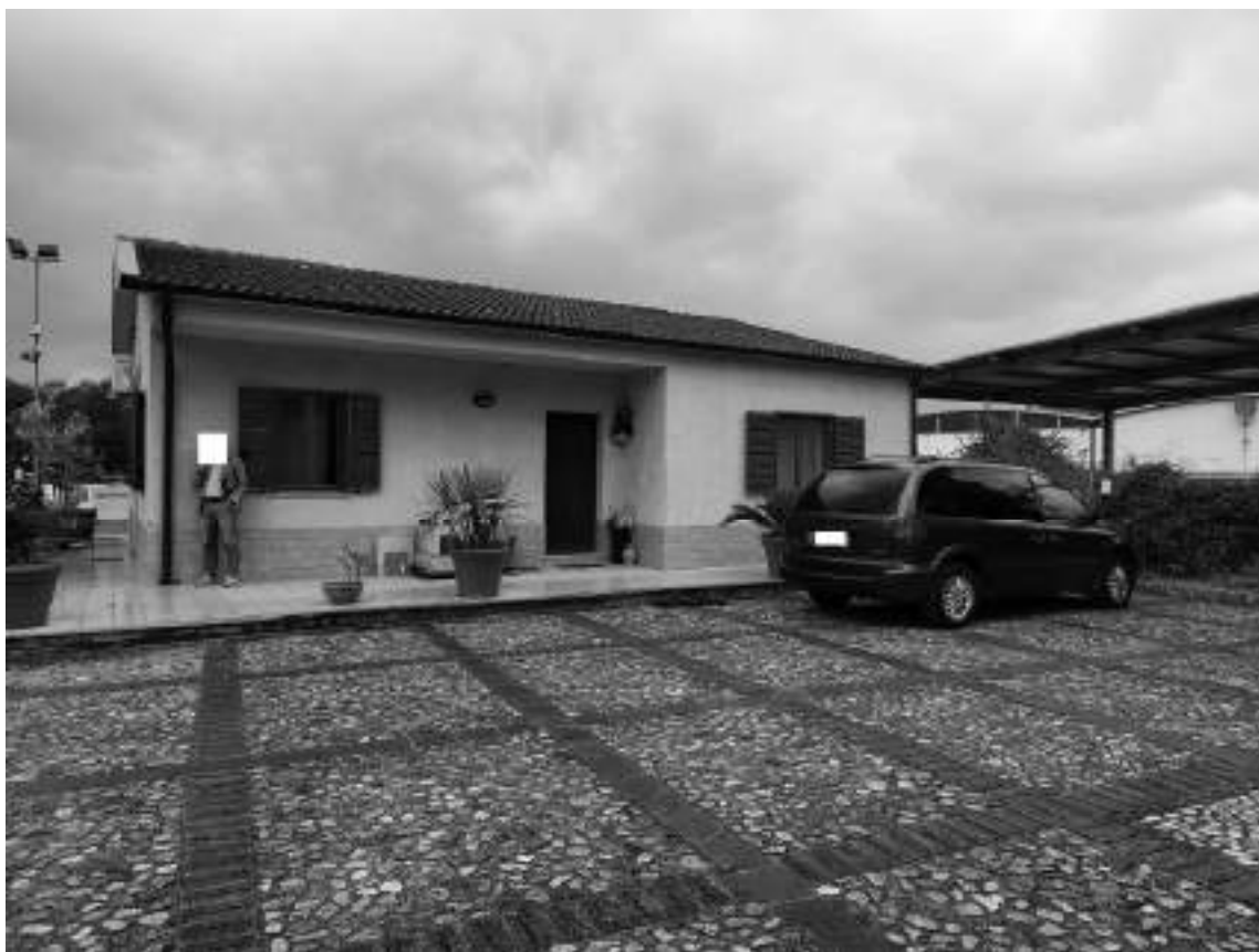
Foto 7 - Fabbricato uffici.