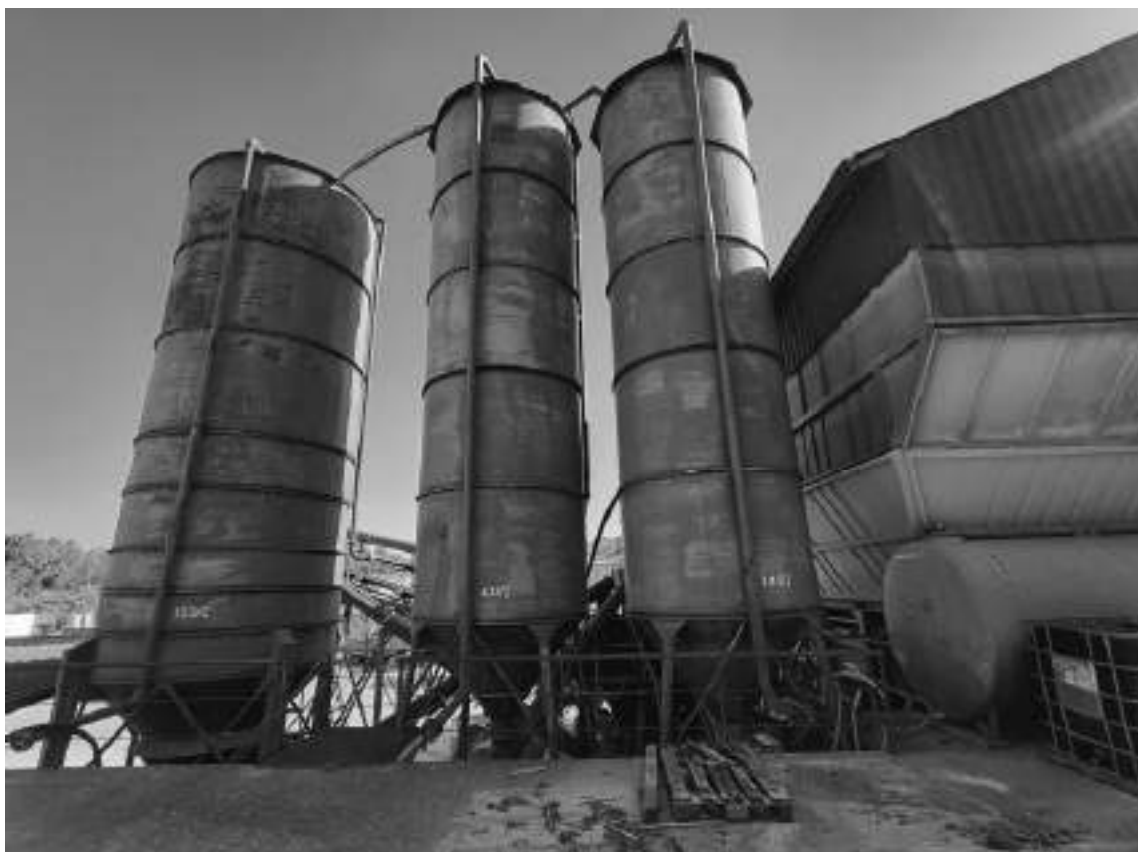
Foto 45 - Impianto di betonaggio, sili per il cemento.