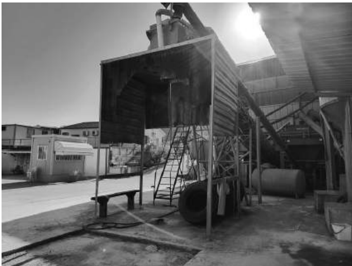
Foto 49 - Impianto di betonaggio, posto di carico autobetoniere.