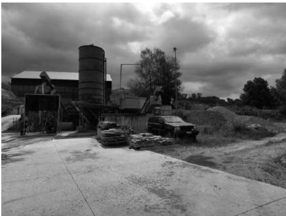
Foto 70 - Terreno, zona pavimentata impianto di betonaggio.