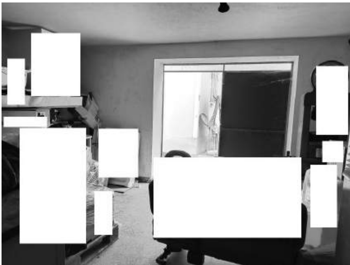
Foto 29 - Fabbricato magazzino e servizi al piano seminterrato.