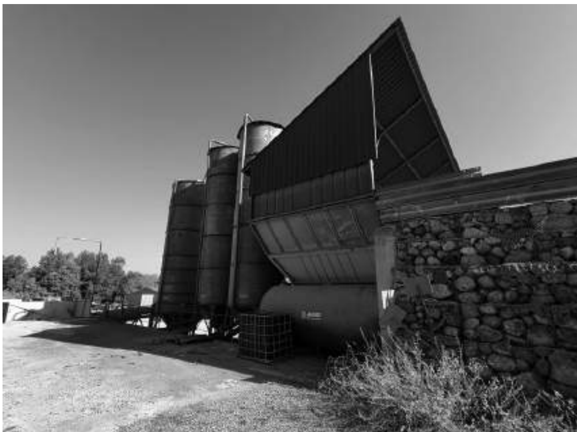
Foto 35 - Impianto di betonaggio.