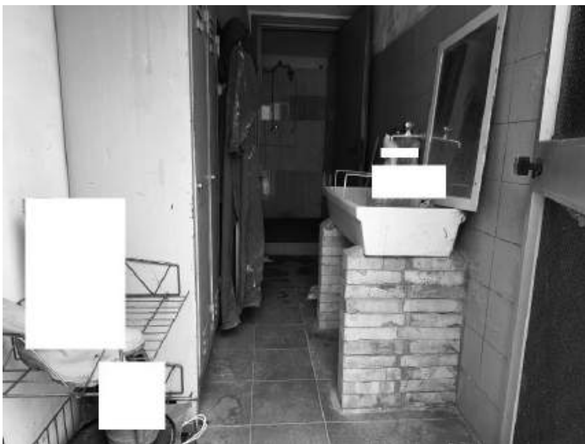
Foto 30 - Fabbricato magazzino e servizi al piano seminterrato.