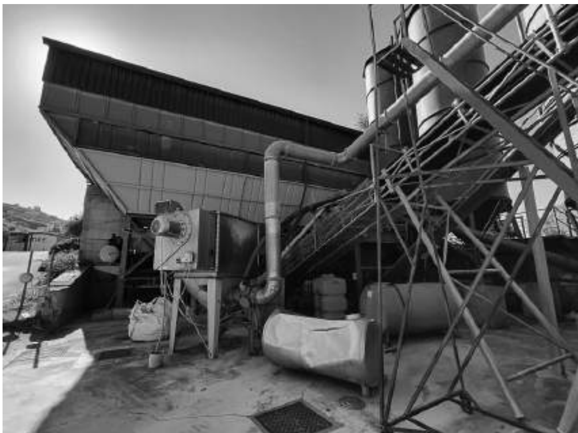
Foto 47 - Impianto di betonaggio, nastro trasportatore.