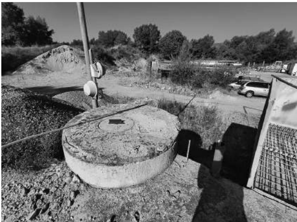
Foto 53 - Pozzo.