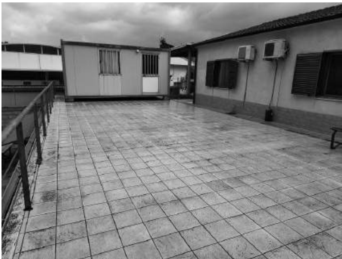
Foto 33 - Fabbricato magazzino e servizi al piano seminterrato, terrazzo piano di copertura e parapetto.