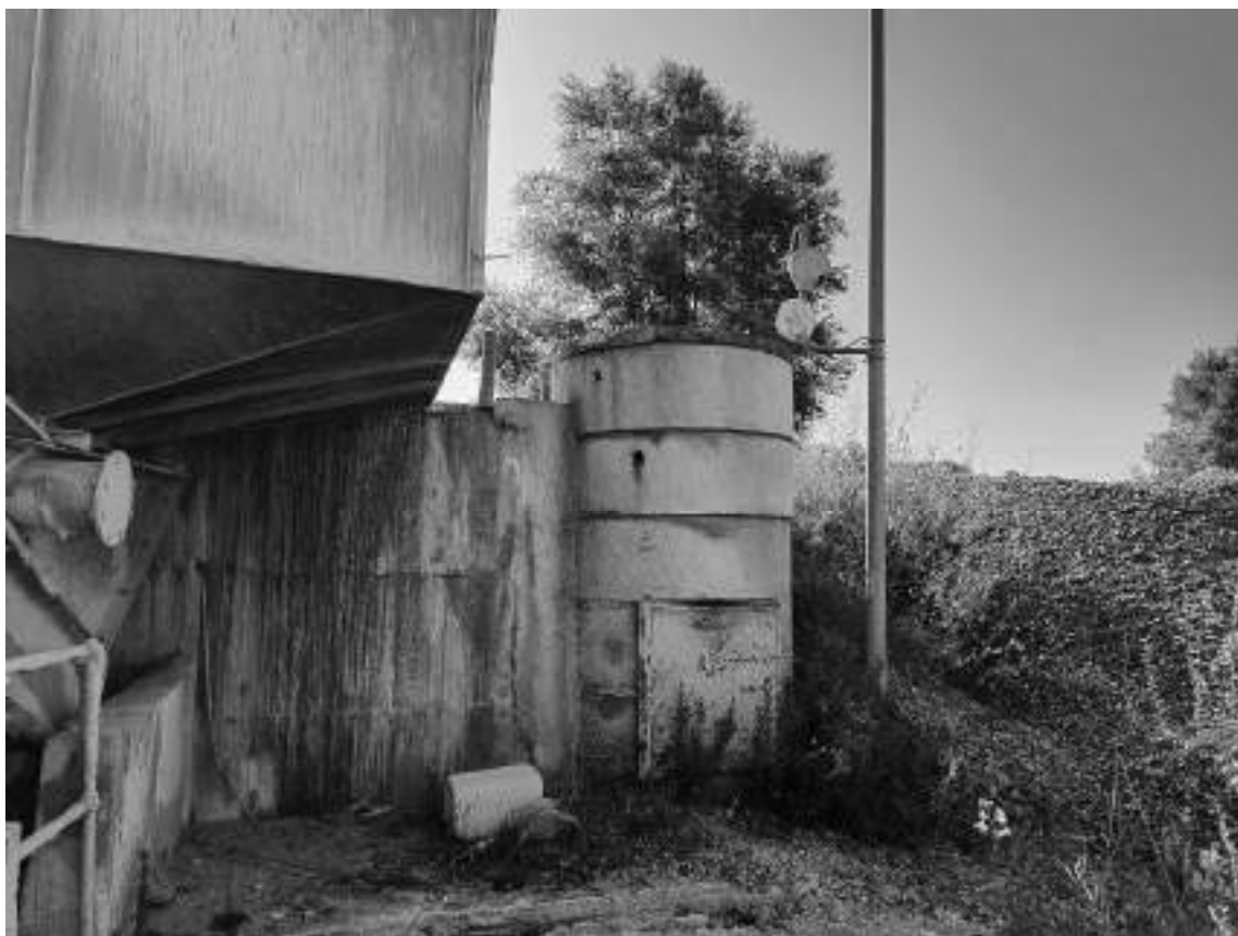
Foto 52 - Pozzo.