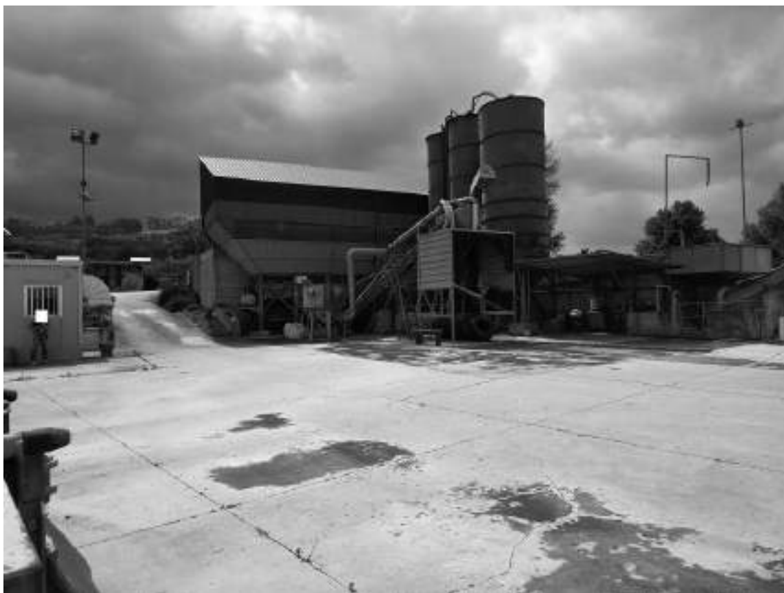
Foto 3 - Impianto di betonaggio.