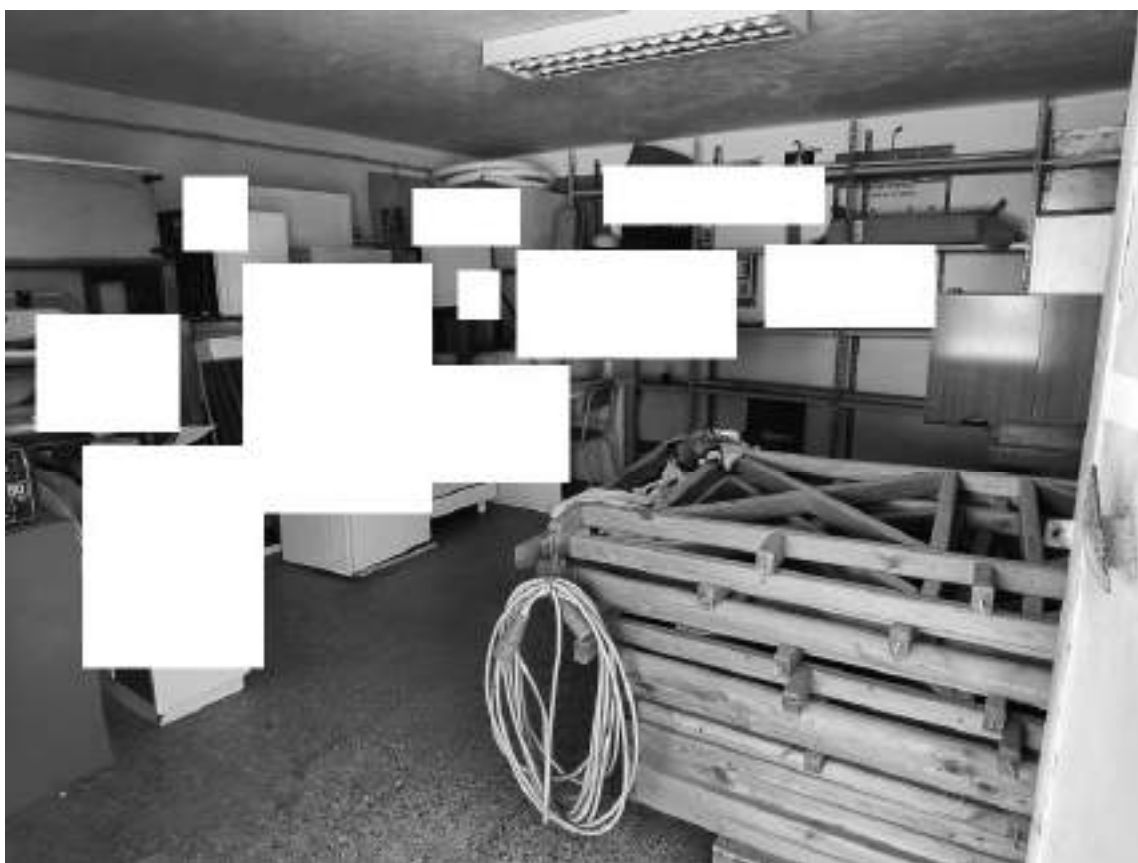
Foto 26 - Fabbricato magazzino e servizi al piano seminterrato.