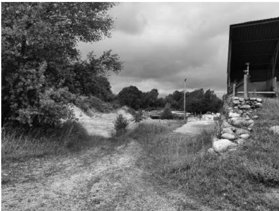
Foto 73 - Terreno, zona non pavimentata.