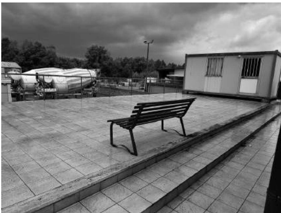
Foto 32 - Fabbricato magazzino e servizi al piano seminterrato, terrazzo piano di copertura e parapetto.