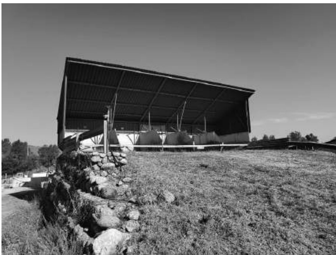
Foto 42 - Impianto di betonaggio, tramogge di carico inerti e terrapieno con muro in gabbioni.