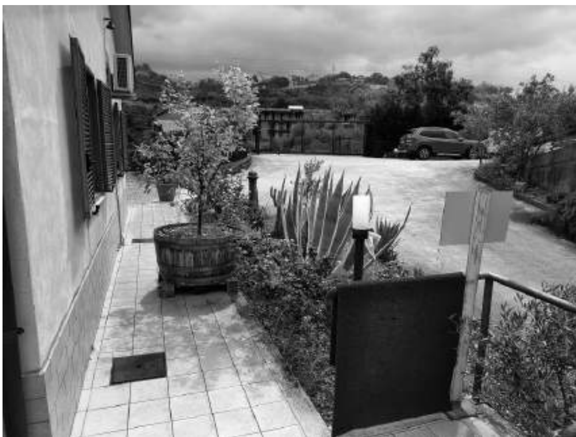
Foto 20 - Fabbricato uffici, corte esterna.