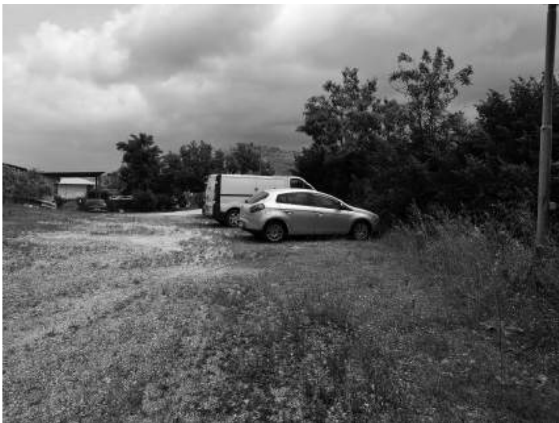
Foto 71 - Terreno, zona non pavimentata.