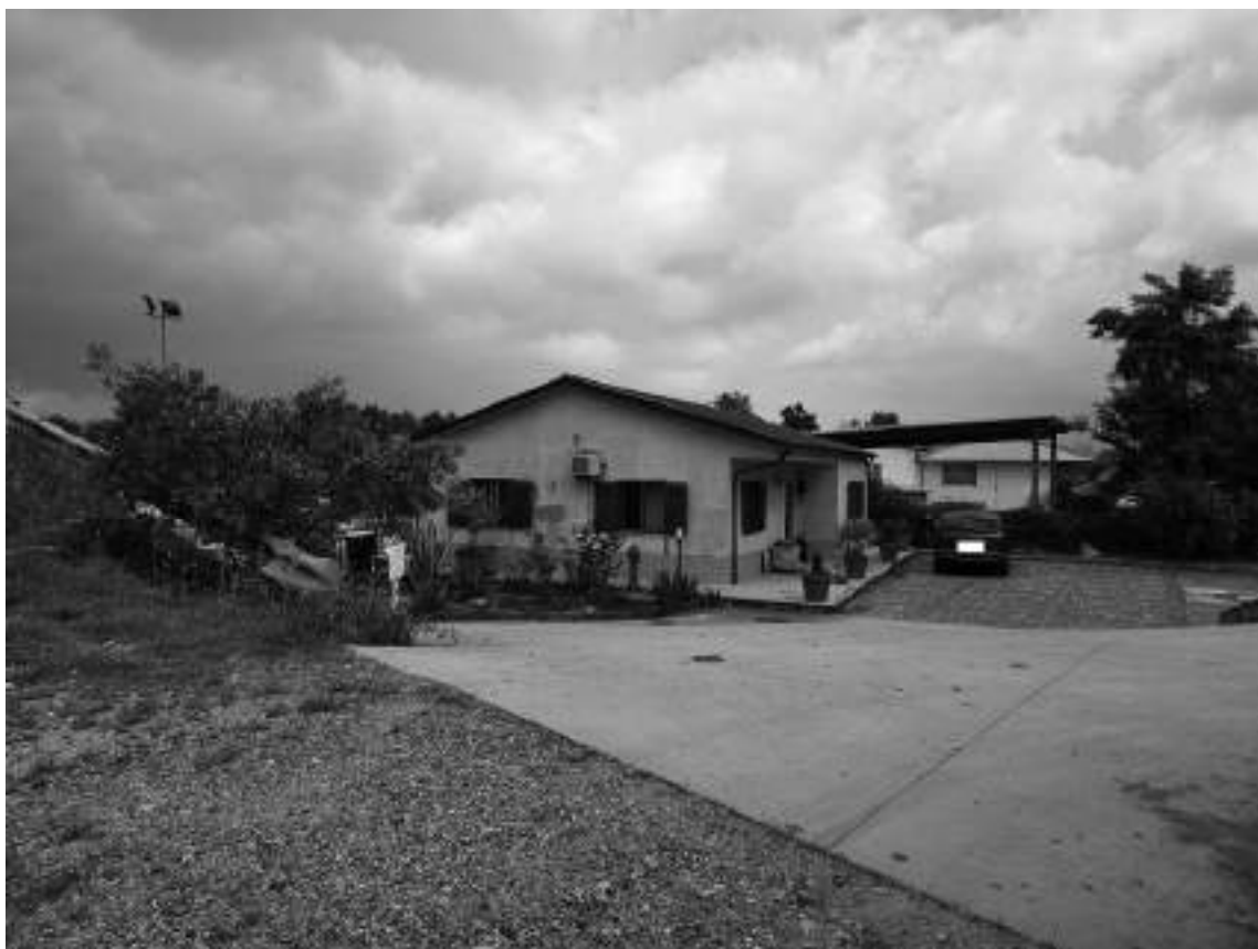
Foto 65 - Terreno, zona pavimentata prossima all'ingresso.