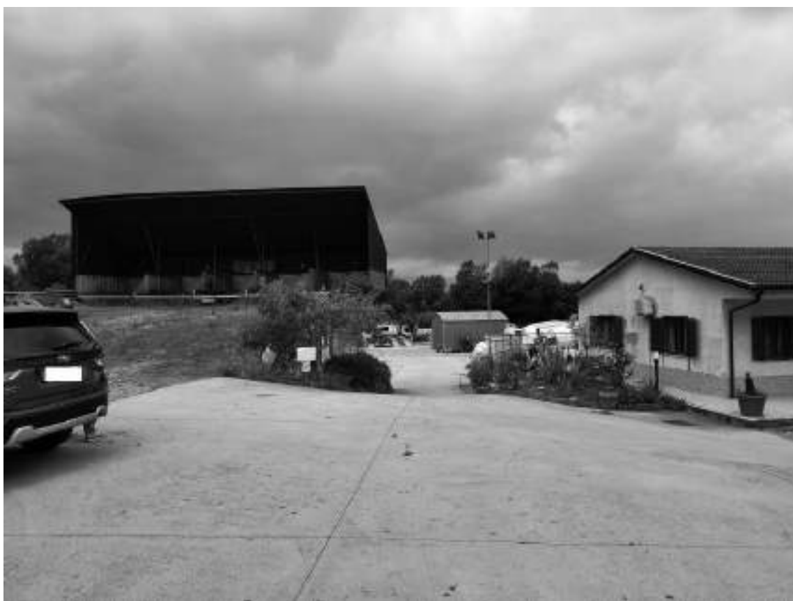
Foto 64 - Terreno, zona pavimentata prossima all'ingresso.