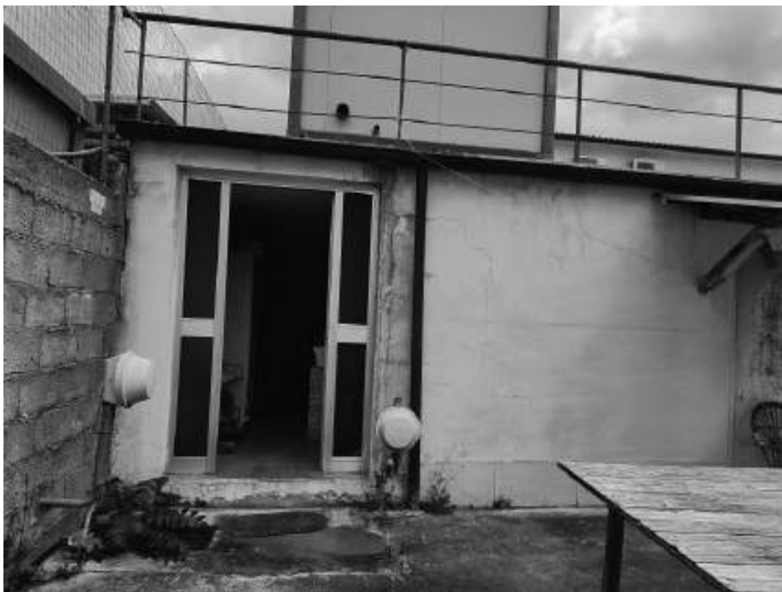
Foto 25 - Fabbricato magazzino e servizi al piano seminterrato.