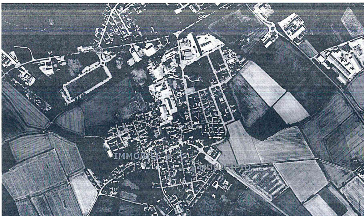
Localizzazione del bene nel contesto del Comune di Gerenzago (PV).