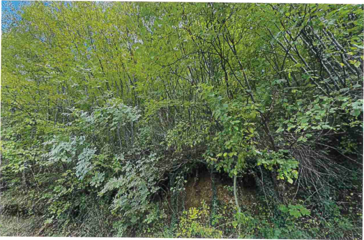
FOTO 7 - Terreni agricoli