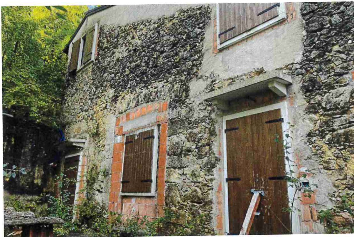
FOTO 9 - Fronte nord