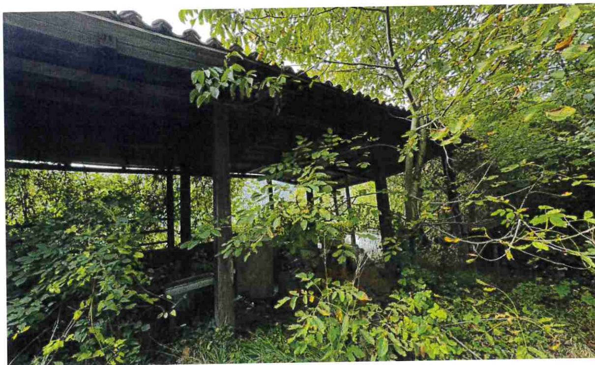
FOTO 6 - Zona posti auto sub. 10-11-12-13