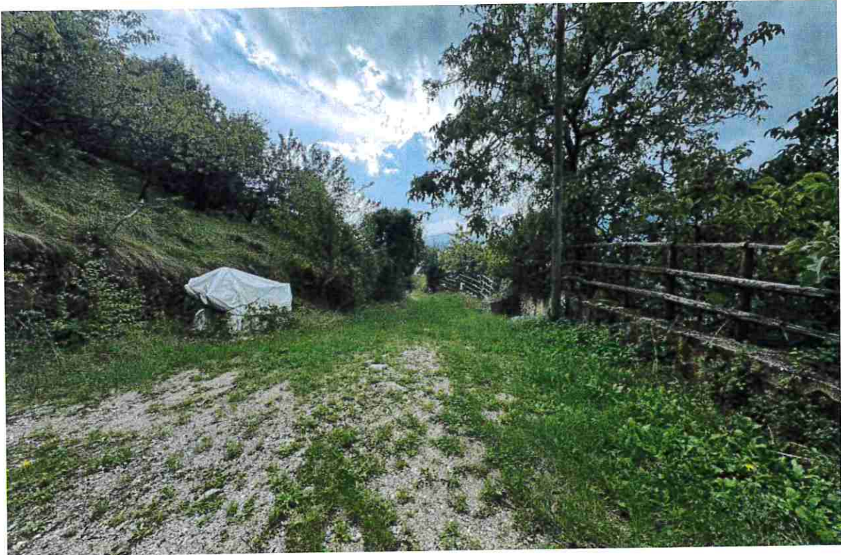
FOTO 1 - Strada accesso fronte sud