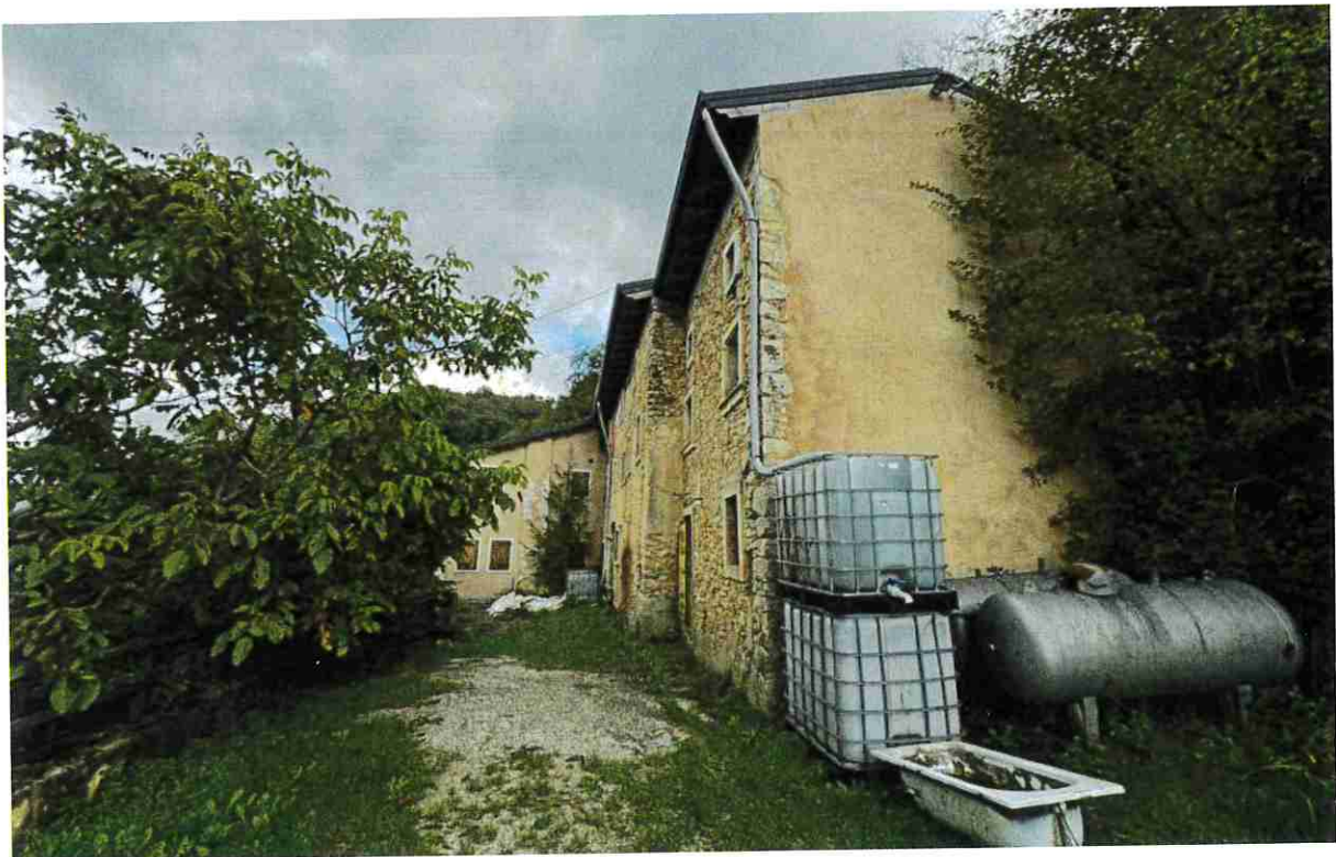
FOTO 2 - Fronte sud