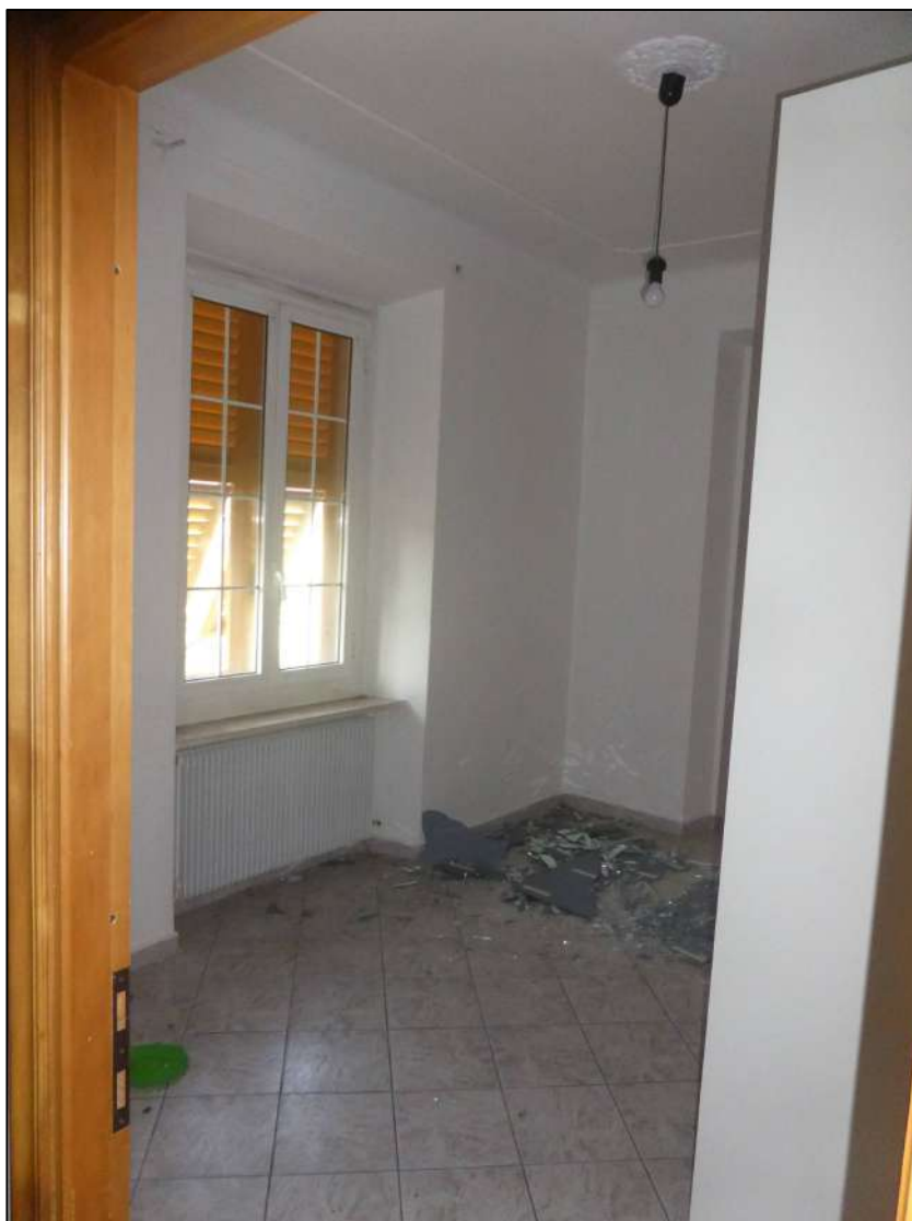
FOTOGRAFIA 17 Interno predetta camera 2