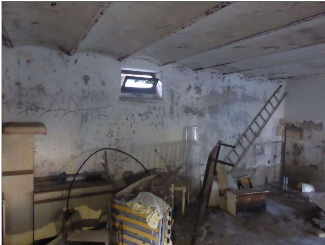
FOTOGRAFIA 26 Cantina lato contro Corso Italia (ovest)