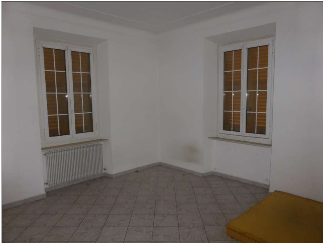
FOTOGRAFIA 15 Camera 1 angolo nord-ovest