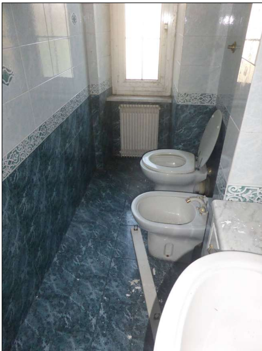
FOTOGRAFIA 21 Bagno