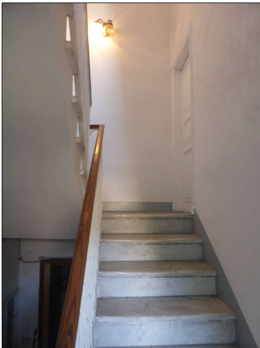
FOTOGRAFIA 7 La rampa di accesso dopo l'ingresso