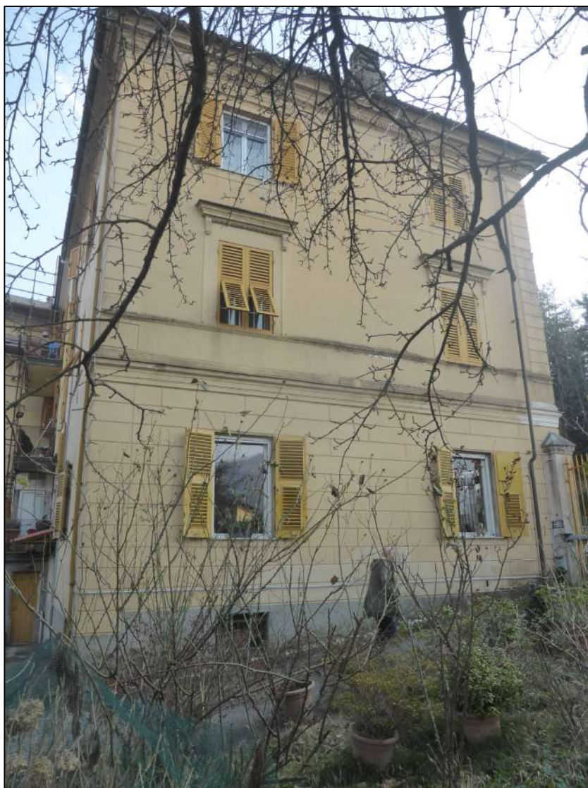
FOTOGRAFIA 5 Facciata nord