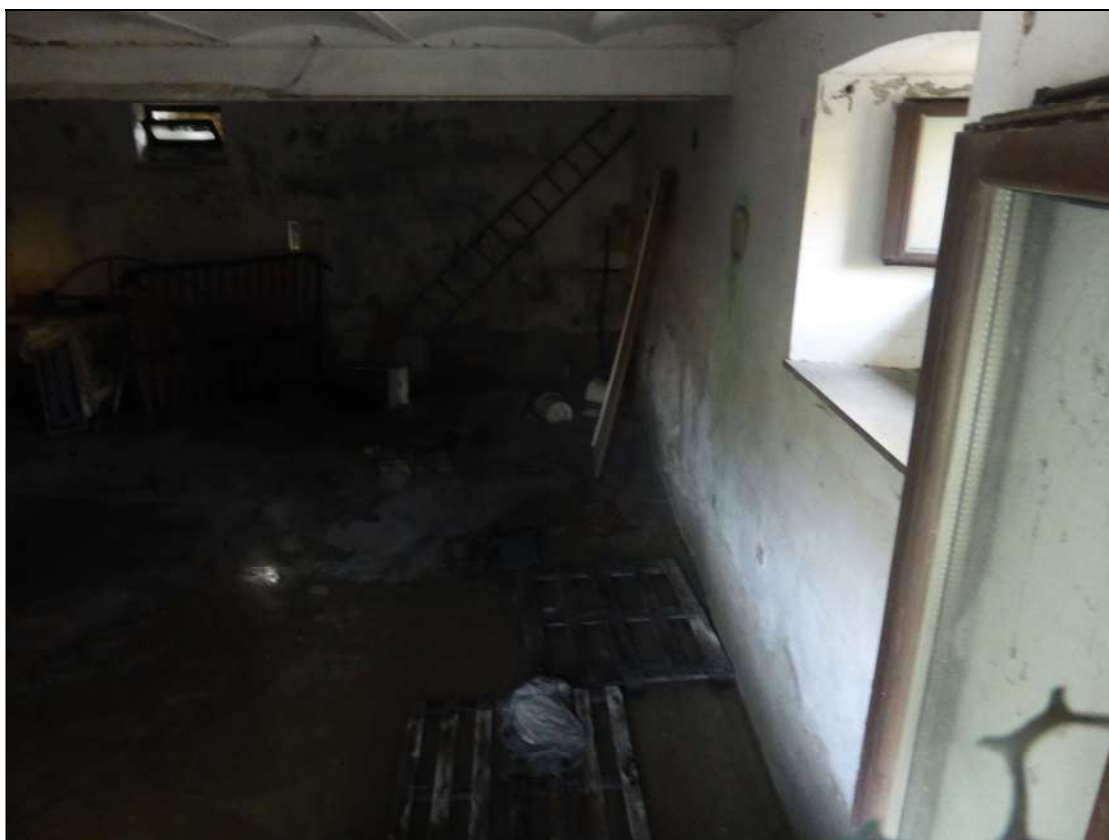
Foto dell'interno della cantina scattata dall'esterno dalla finestra della precedente Foto 30

Facciata est con la finestra visibile dalla precedente foto