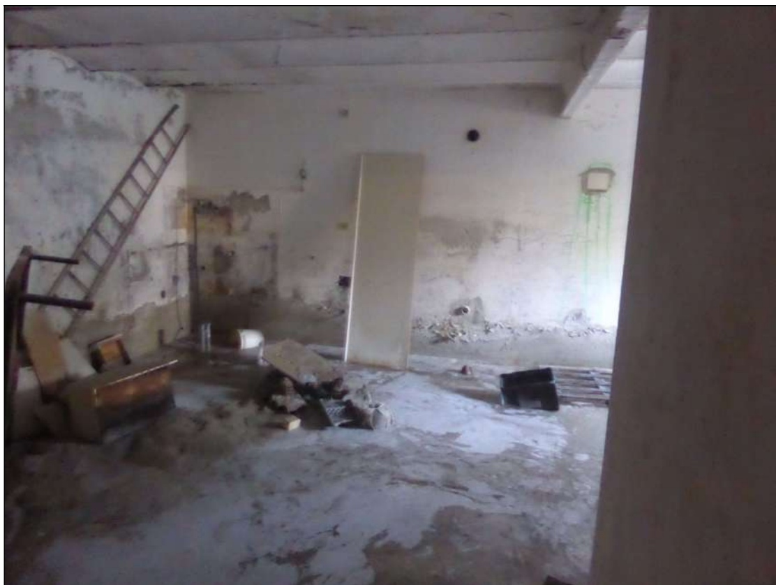
FOTOGRAFIA 27 Cantina lato nord - angolo nord-ovest