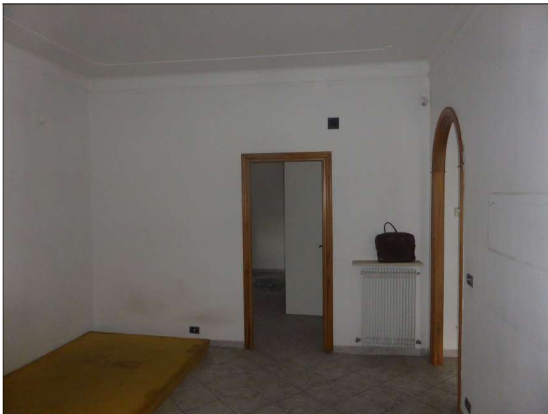
FOTOGRAFIA 16 Vista ingresso camera 2 angolo nord-est