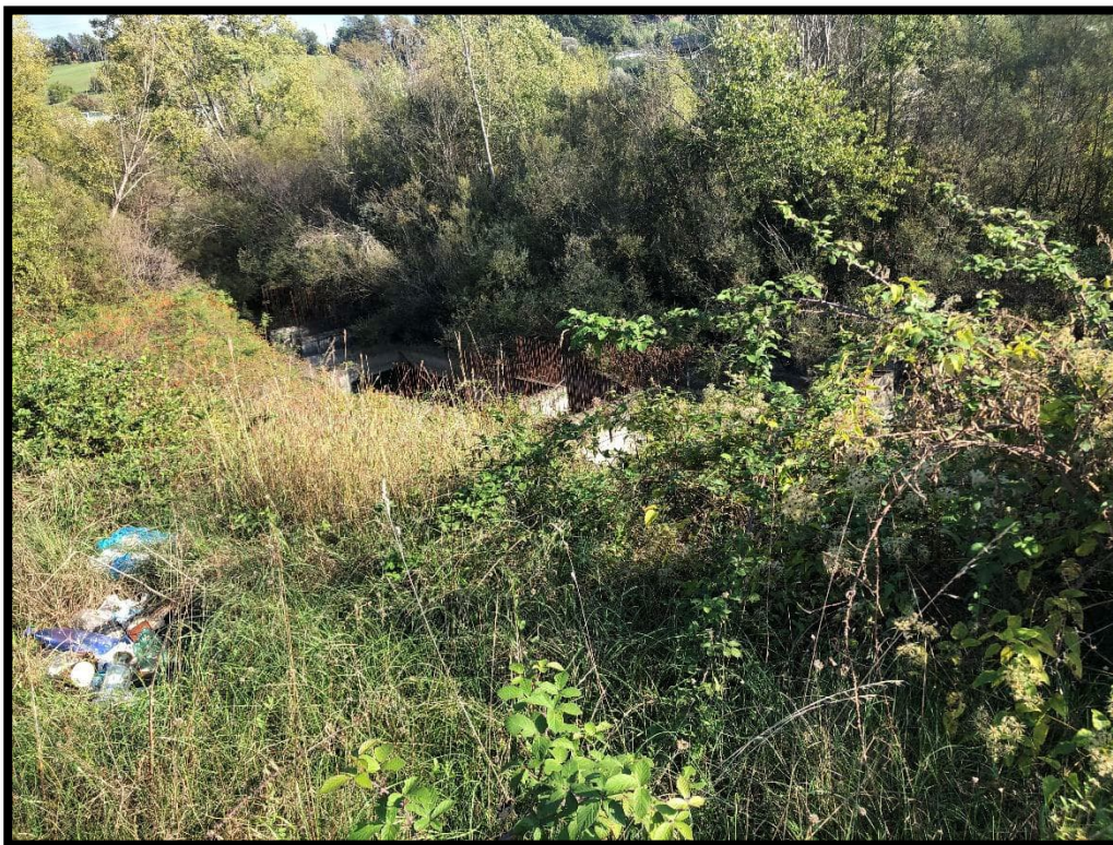
Foto 11 – Resti di precedente intervento edilizio poi abbandonato