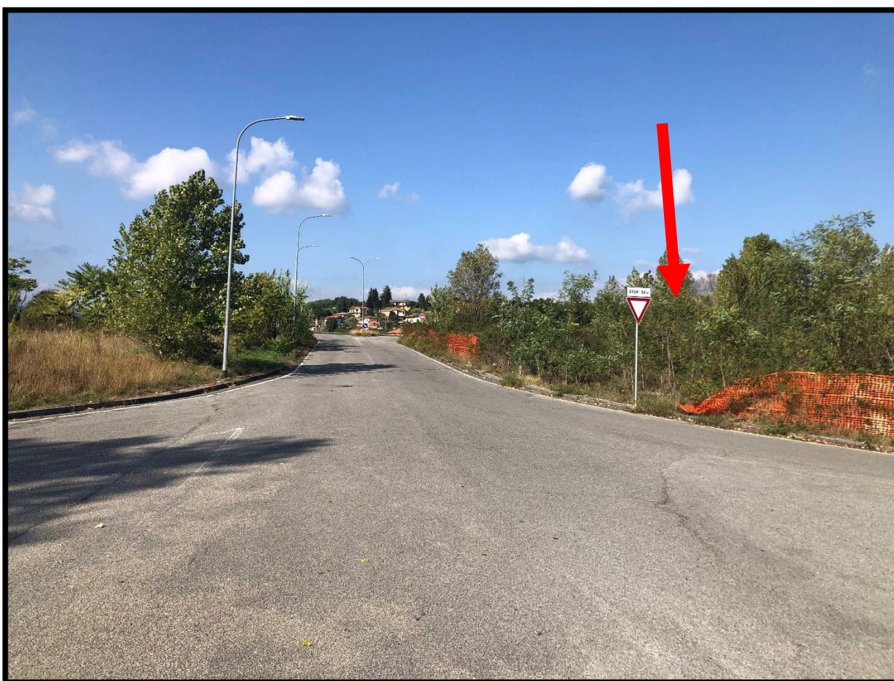
Foto 10 – Rampa raccordo Via I. Cocchi e strada statale per il Lagastrello