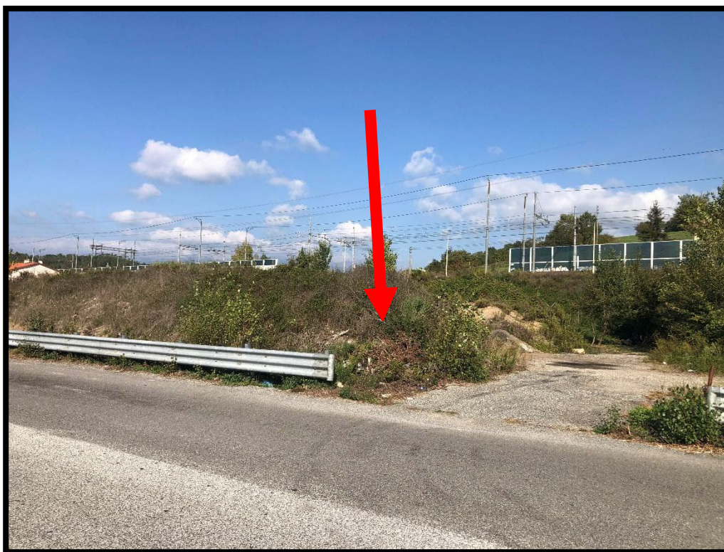
Foto 17 – Vista da Via Giovanni Paolo- porzione di lotto a monte della strada