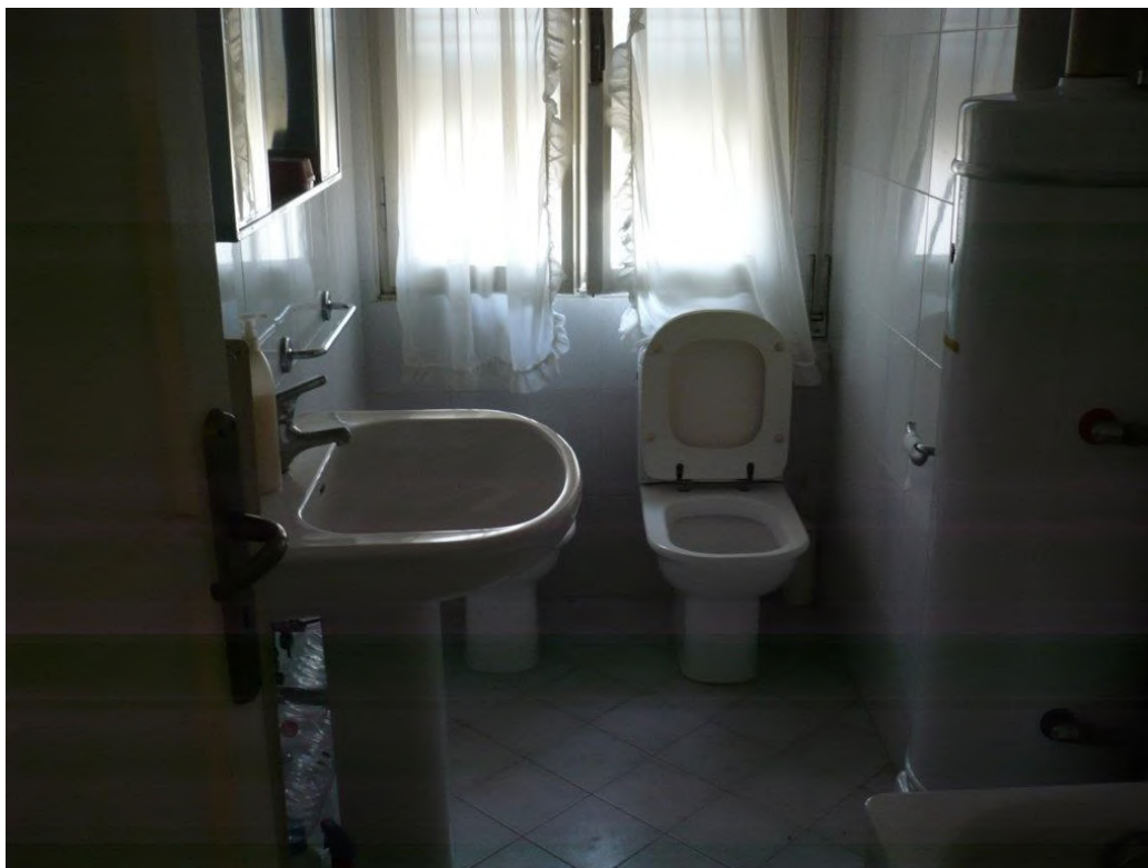
Bagno – piano secondo

Abitazione di Tipo Economico P. S1 - 2 – foglio LE 13 - particella 491 sub. 12