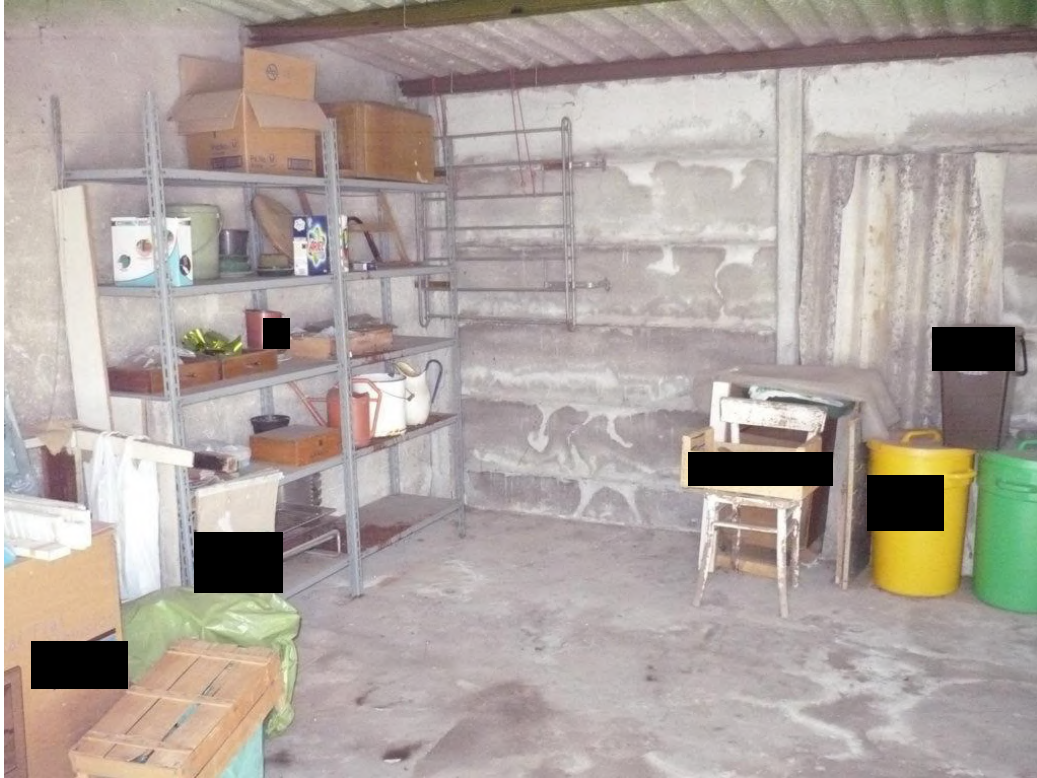
Garage singolo – piano terra