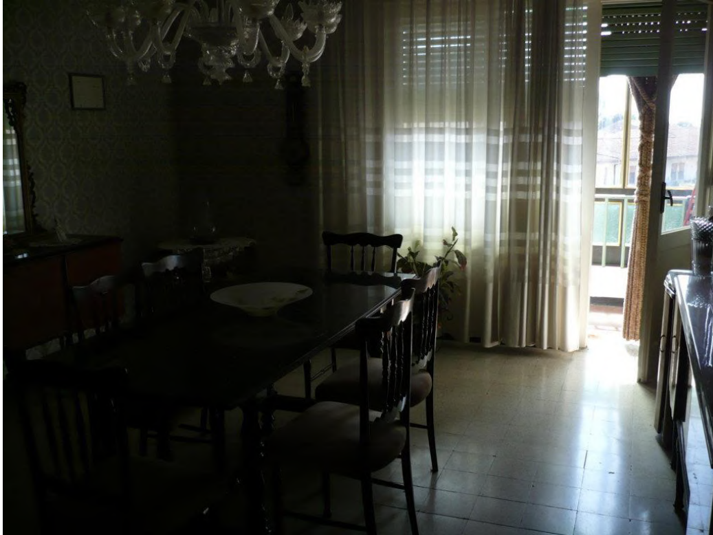
Soggiorno – piano secondo

Abitazione di Tipo Economico P. S1 - 2 – foglio LE 13 - particella 491 sub. 12