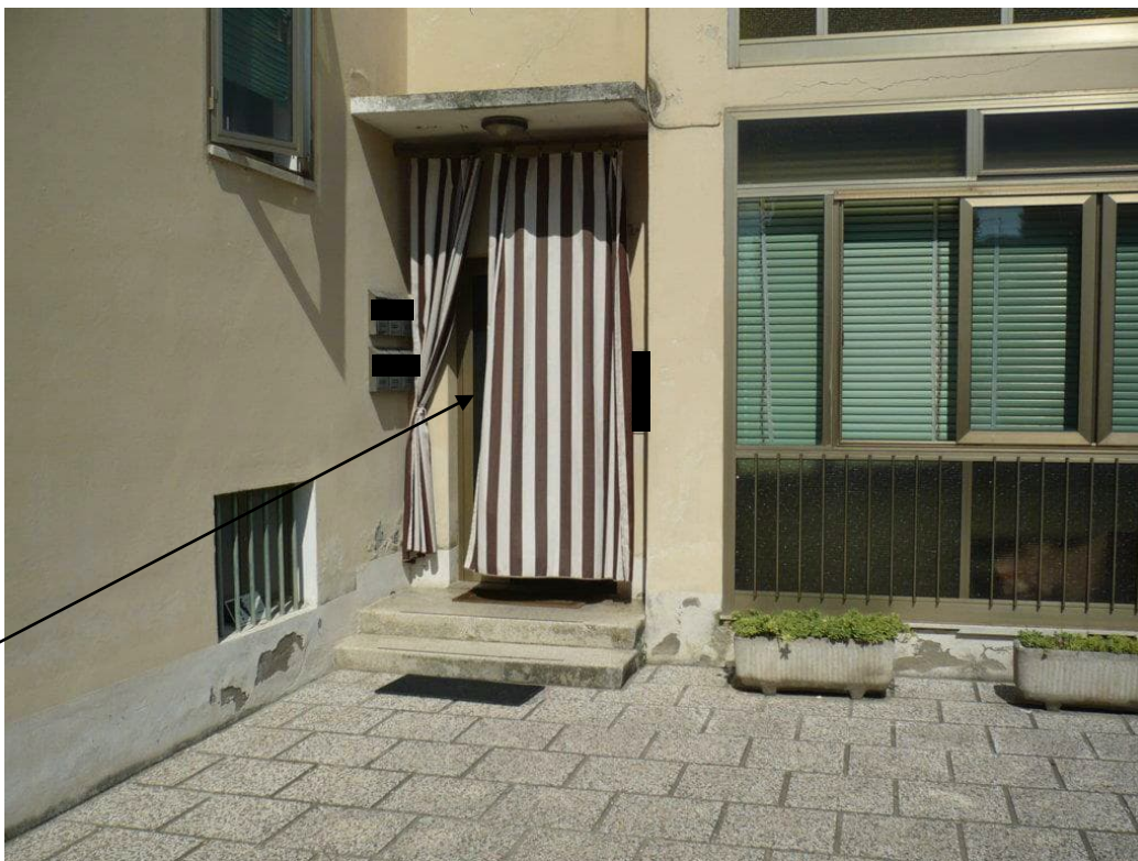
PORTONE DI INGRESSO COMUNE