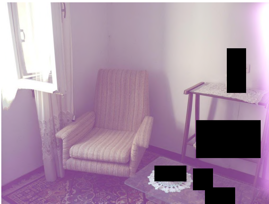
Disbrigo – piano secondo