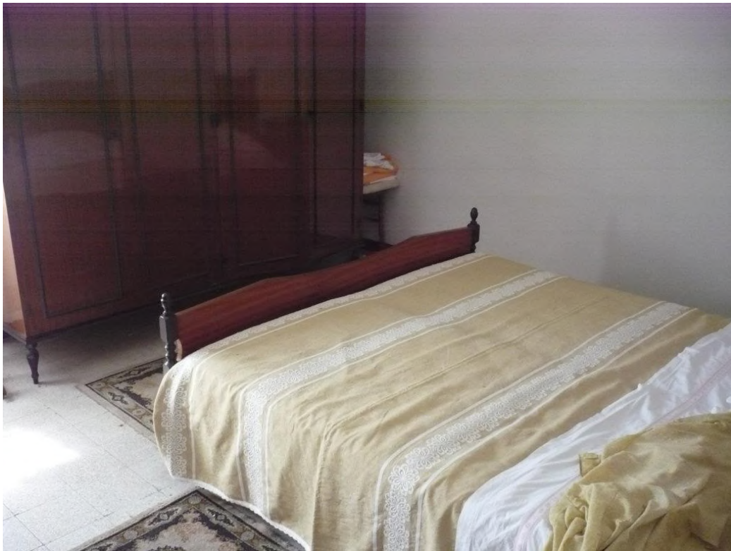
Letto – piano secondo