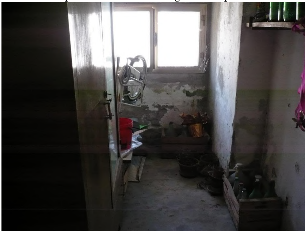
Locale Cantina – piano S1

Abitazione di Tipo Economico P. S1 - 2 – foglio LE 13 - particella 491 sub. 12