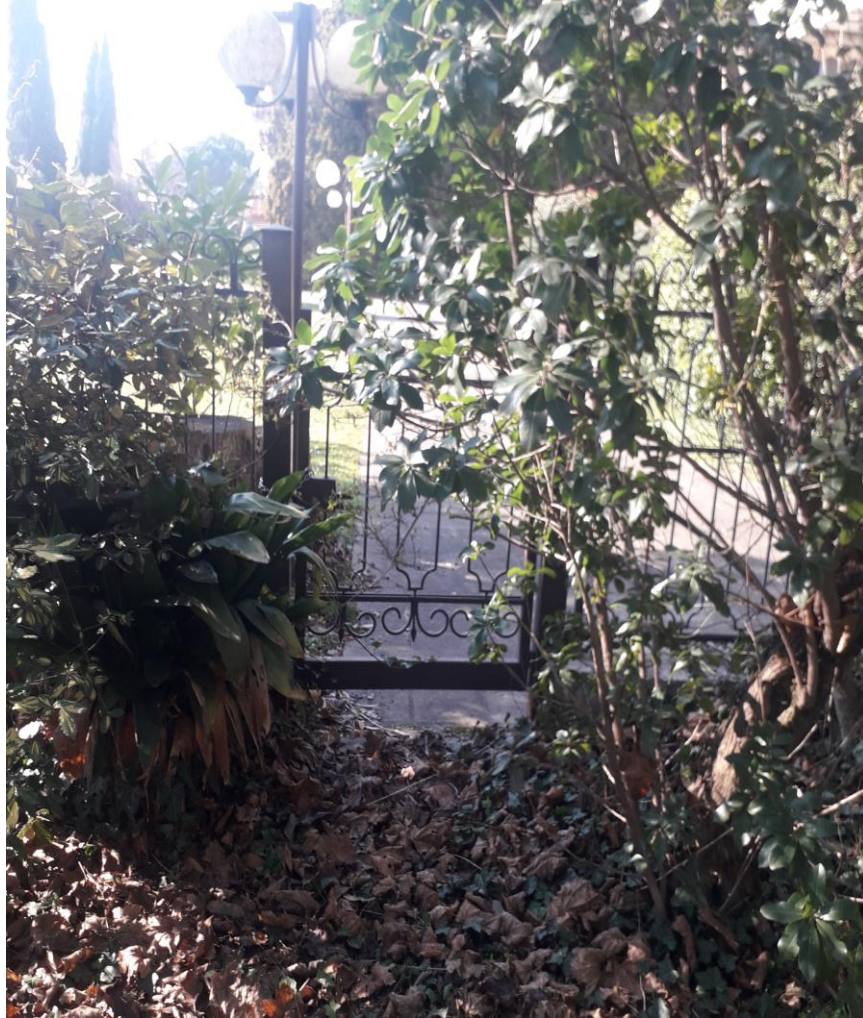
Ingresso lato est