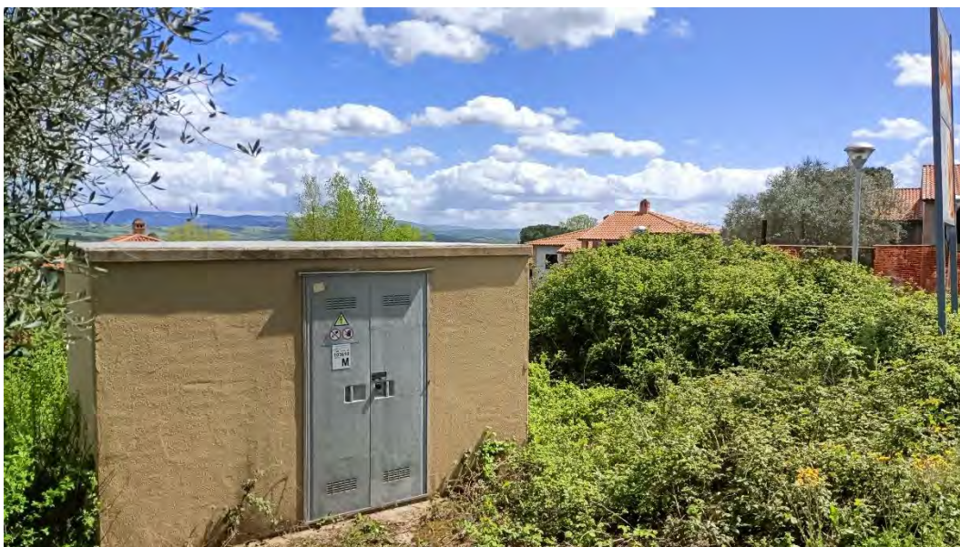
Foto n.2: Particolare della cabina Enel (particella 1184) adiacente la lottizzazione.