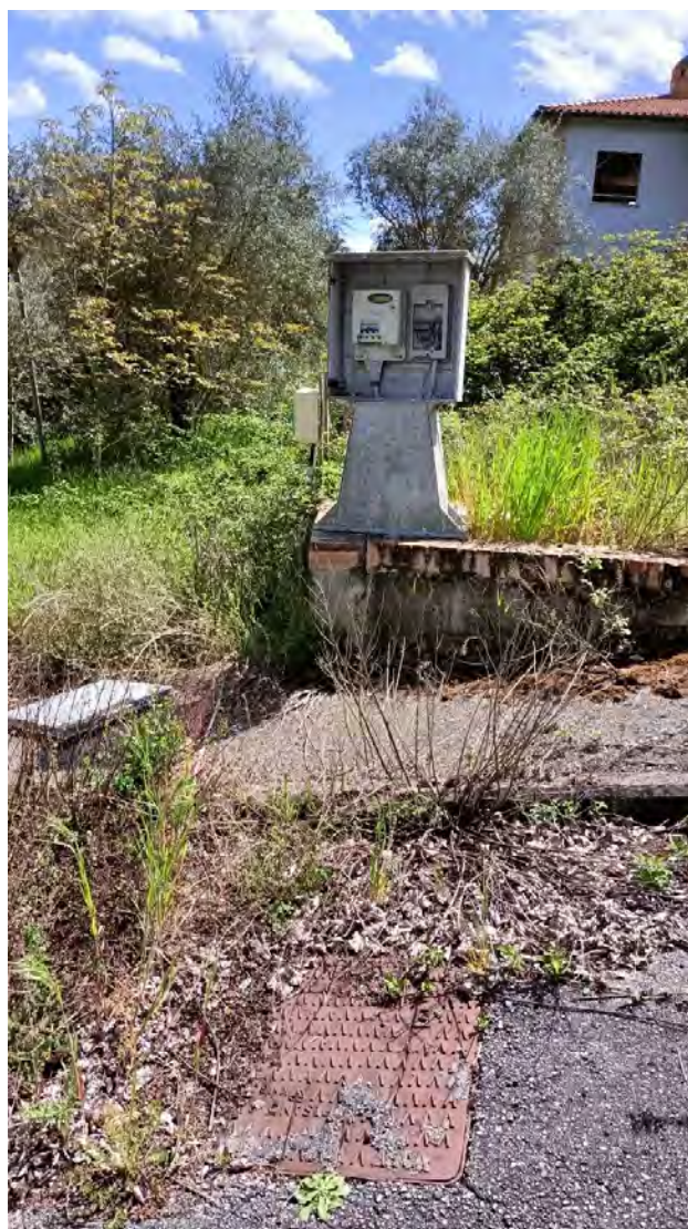
Foto n.28: altro particolare dello stato dei marciapiedi, blinder, pozzetti e impiantistica sottostrada.