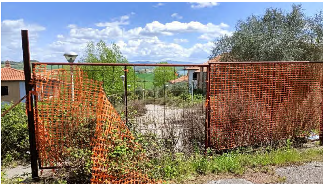
Foto n.1: Veduta, ripresa dalla strada provinciale SP300 con il particolare dell'accesso al compendio immobiliare.