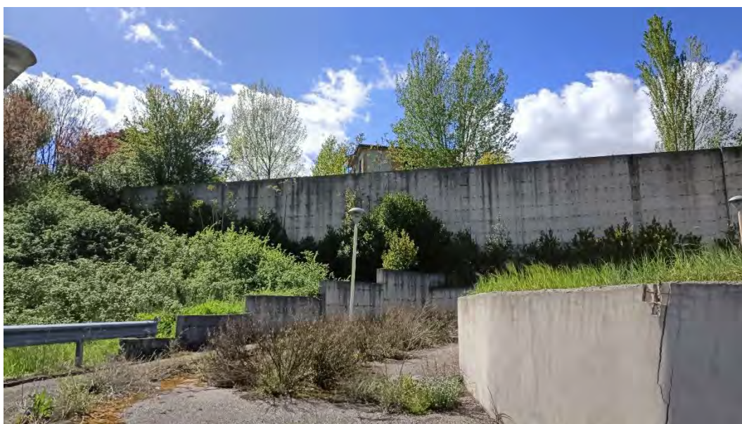
Foto n.8: Altro particolare della strada della lottizzazione con visibile uno dei muri di contenimento in c.c.a..