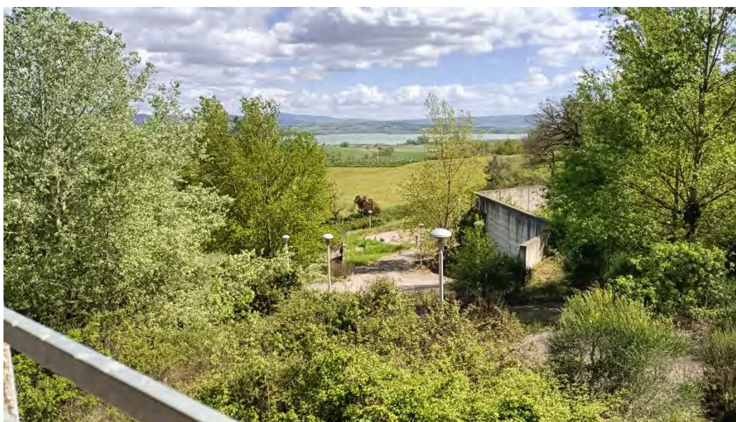
Foto n.6: Altro particolare della lottizzazione e sullo sfondo il lago di Chiusi.