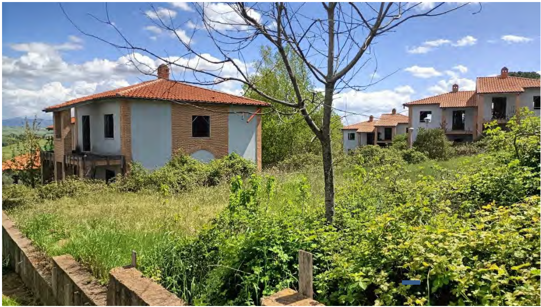
Foto n.3: Particolare del limite della lottizzazione ripresa dalla strada provinciale verso sud-est.