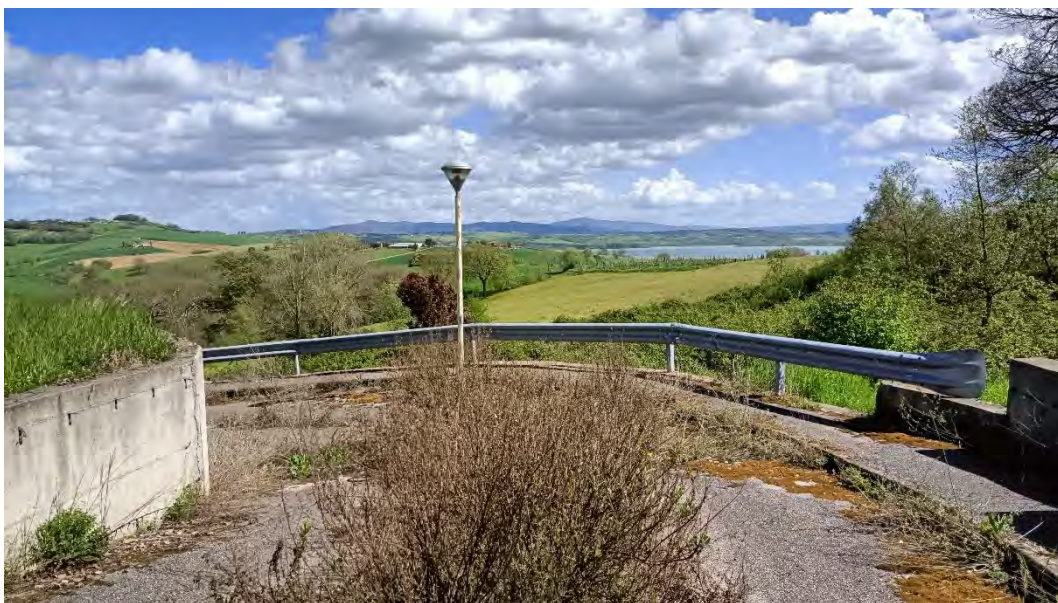
Foto n.7: veduta della strada della lottizzazione con la racchetta di manovra.