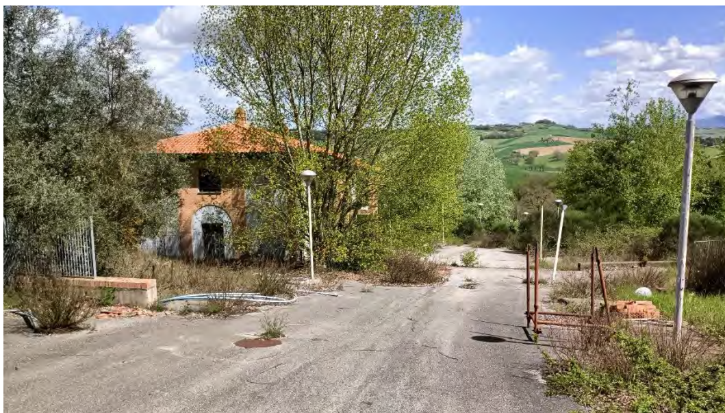
Foto n.27: particolare della strada e dello stato dell'illuminazione di lottizzazione.