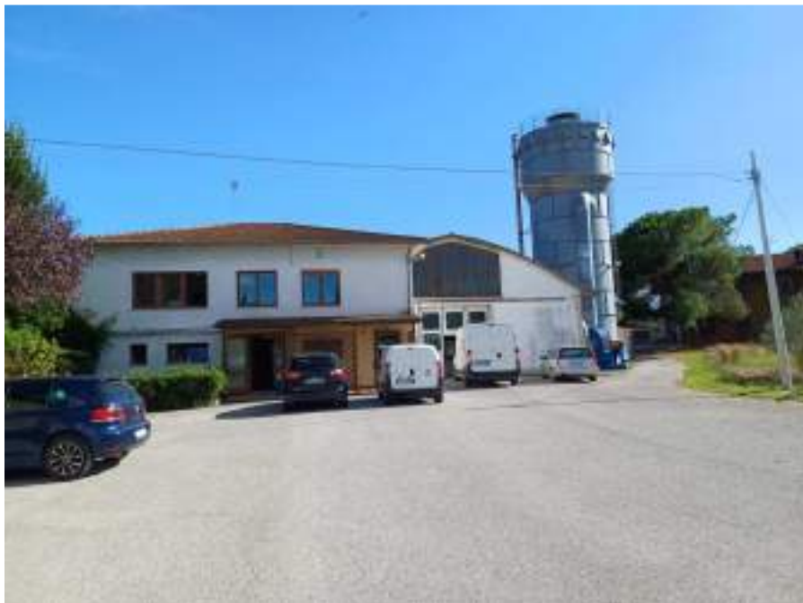
Foto n. 6. Vista interno compendio immobiliare esecutato (Lotto n. 1);

Rif. Immobile indicato con la Lettera: A (Falegnameria), Castiglione del Lago (PG), Fraz. Ferretto, Catasto Fabbricati, Foglio n. 1, Part. n. 198, prospetto nord-ovest, vista ingresso alla porzione di fabbricato uso locale tecnico, spogliatoio, bagni e antibagno al PT, uffici al P1 e vista ingresso al capannone principale con destinazione d'uso: lavorazione del legname al PT