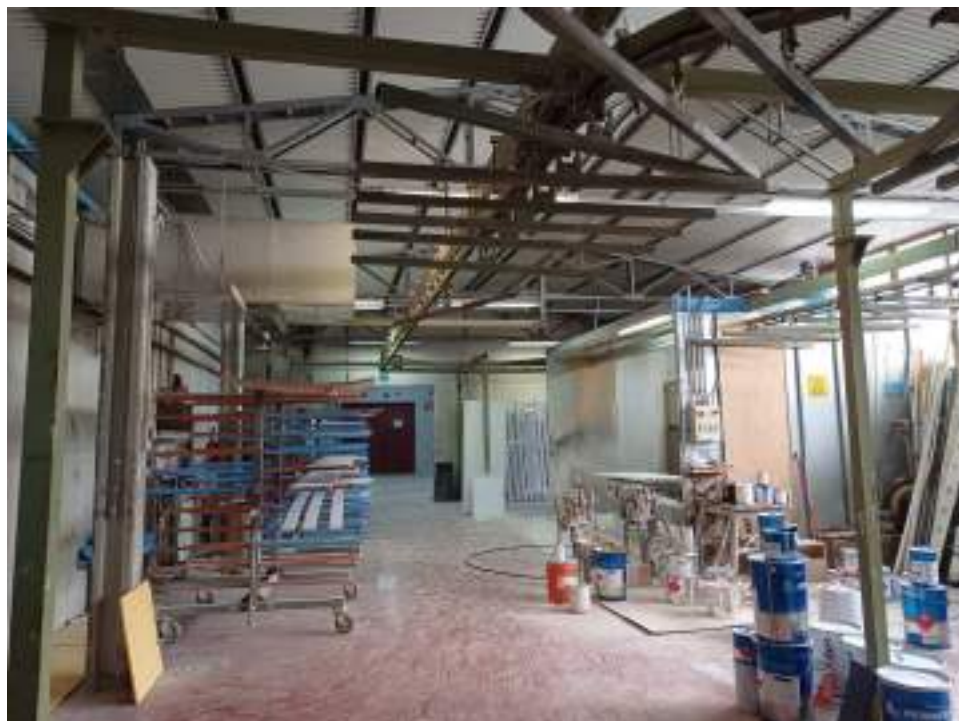
Foto n. 10. Vista interno compendio immobiliare esecutato (Lotto n. 1);

Rif. Immobile indicato con la Lettera: A (Falegnameria), Castiglione del Lago (PG), Fraz. Ferretto, Catasto Fabbricati, Foglio n. 1, Part. n. 198, capannone edificato successivamente al manufatto principale (uso falegnameria) con destinazione d'uso: verniciatura dei prodotti lavorati