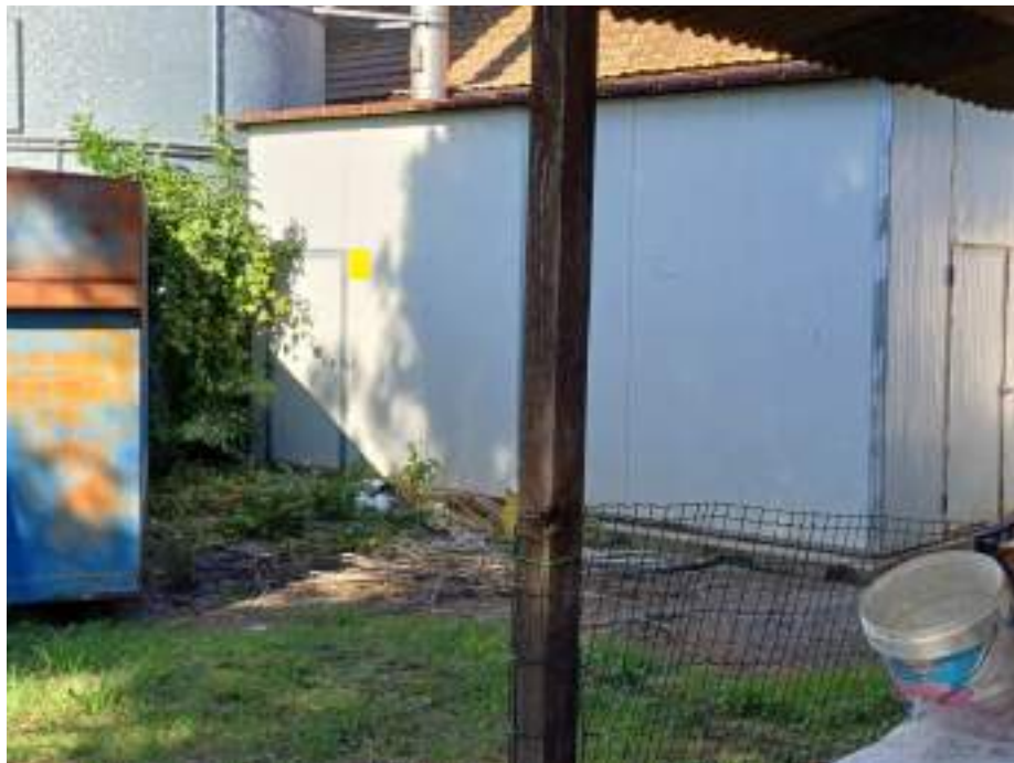
Foto n. 20. Vista esterno compendio immobiliare esecutato (Lotto n. 1);

Rif. Immobile indicato con la Lettera: B (Silos e Locale tecnico), Castiglione del Lago (PG), Fraz. Ferretto, Catasto Fabbricati, Foglio n. 1, Part. n. 511. Esterno del Locale tecnico realizzato con struttura verticale ed orizzontale leggera, mediante pannelli del tipo sandwich