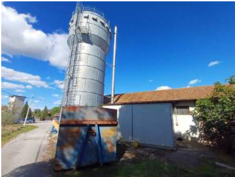
Foto n. 18. Vista interno compendio immobiliare esecutato (Lotto n. 1);

Particolare Silos per lo stoccaggio dei trucioli del legname lavorato e annesso Locale tecnico realizzati, il primo in lamiera di acciaio zincato, il secondo in pannelli del tipo sandwich