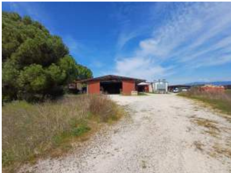
Foto n. 4. Vista esterno compendio immobiliare esecutato (Lotto n. 1);

Rif. Immobile indicato con la Lettera: A (Falegnameria), Castiglione del Lago (PG), Fraz. Ferretto, Catasto Fabbricati, Foglio n. 1, Part. n. 198, prospetto retro del complesso immobiliare esecutato, lato sud-ovest (vista accesso alla zona carico dei prodotti in legno lavorati: capannoni in lamiera costruiti successivamente in aggiunta al corpo di fabbrica principale edificato all'inizio degli anni '80)