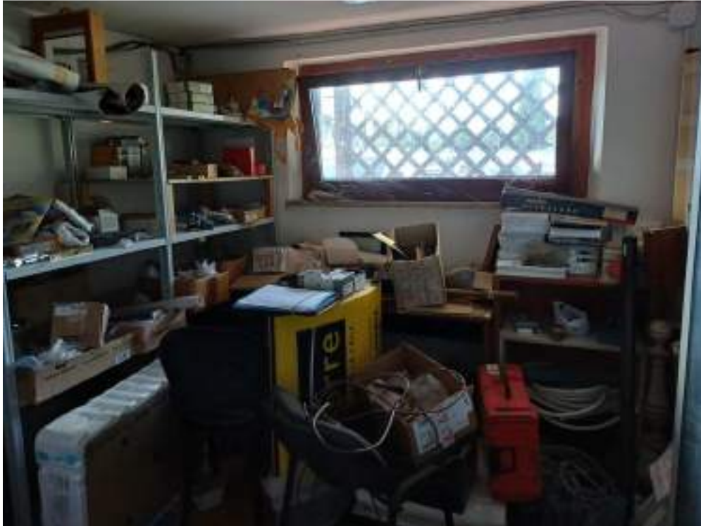
Foto n. 14. Vista interno compendio immobiliare eseguito (Lotto n. 1);

Rif. Immobile indicato con la Lettera: A (Falegnameria), Castiglione del Lago (PG), Fraz. Ferretto, Catasto Fabbricati, Foglio n. 1, Part. n. 198, corpo di fabbrica posto su due piani, antistante e adiacente al locale falegnameria; piano terra: uso ingresso, locale tecnico, spogliatoio, servizi igienici e vano accesso al piano primo Locale tecnico e magazzino al PT