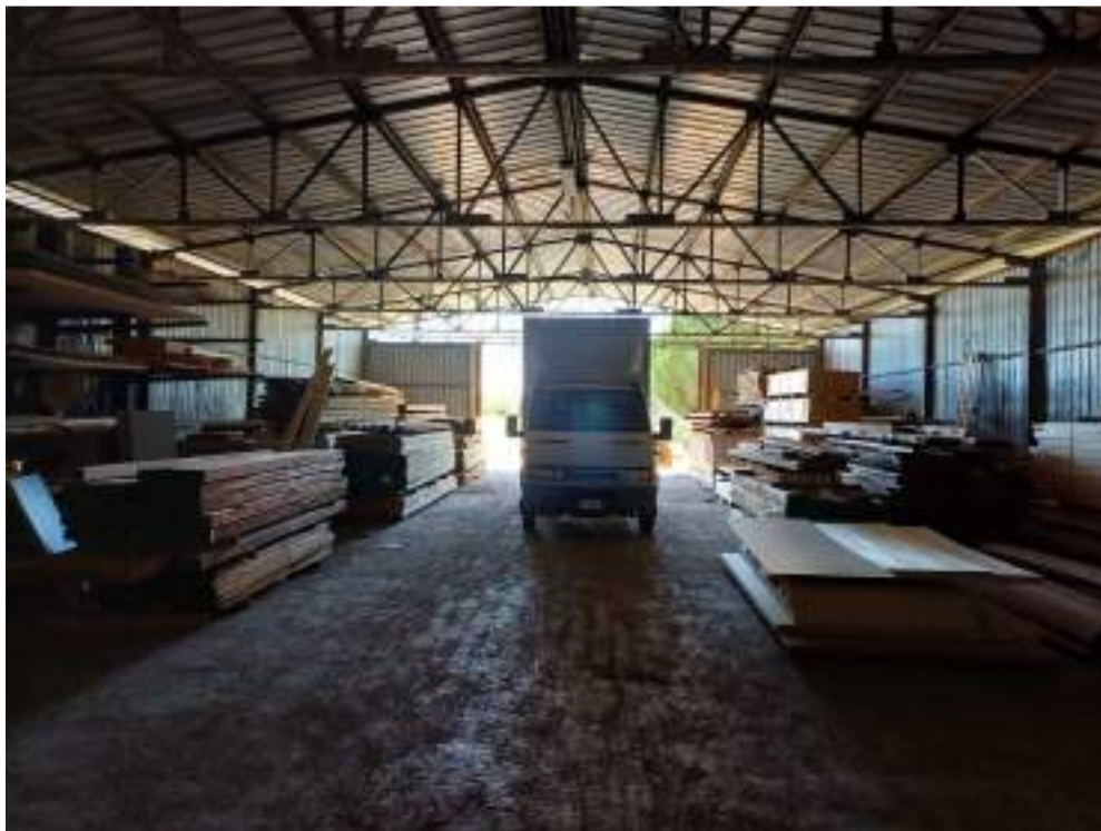
Foto n. 12. Vista interno compendio immobiliare eseguito (Lotto n. 1);

Rif. Immobile indicato con la Lettera: A (Falegnameria), Castiglione del Lago (PG), Fraz. Ferretto, Catasto Fabbricati, Foglio n. 1, Part. n. 198, capannone edificato successivamente al manufatto principale originario uso lavorazione del legname, con destinazione d'uso: deposito e stoccaggio dei prodotti finiti in attesa di consegna