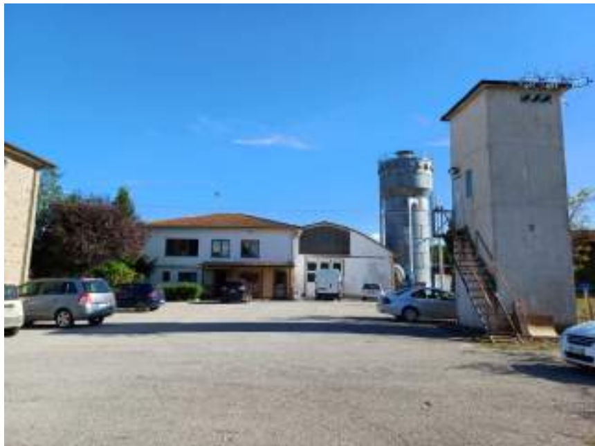
Foto n. 2. Vista esterno compendio immobiliare esecutato (Lotto n. 1);

Riff. Immobili indicati con le Lettere: A (Falegnameria), B (Silos e Locale tecnico), Castiglione del Lago (PG), Fraz. Ferretto, Catasto Fabbricati, Foglio n. 1, Part. n. 198, Part. n. 511, prospetto fronte, lato nord-ovest (Ingresso da Via Pieracci n. 18)