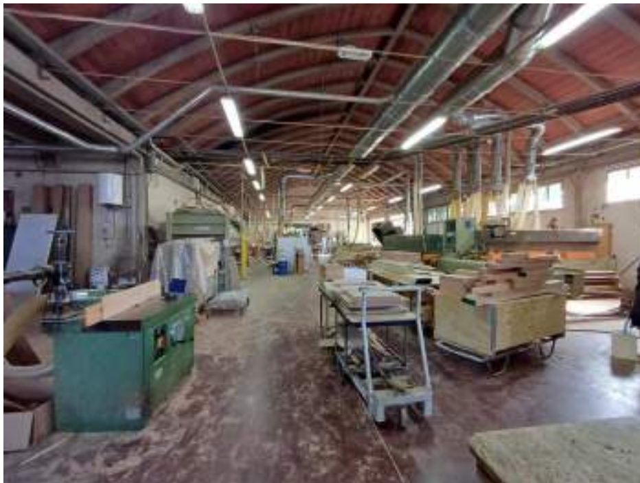
Foto n. 8. Vista interno compendio immobiliare esecutato (Lotto n. 1);

Rif. Immobile indicato con la Lettera: A (Falegnameria), Castiglione del Lago (PG), Fraz. Ferretto, Catasto Fabbricati, Foglio n. 1, Part. n. 198, capannone principale con destinazione d'uso lavorazione del legname al PT (locale lavorazione del legno)