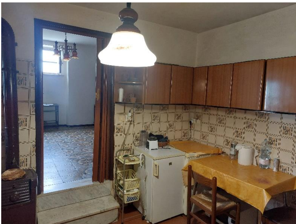
Locale cucina – piano T