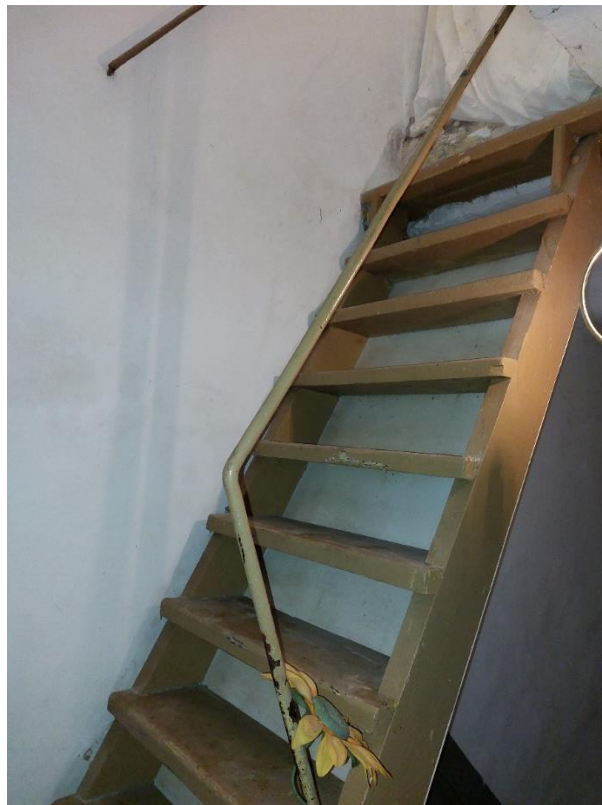
Scala di accesso alla terrazza – piano 2