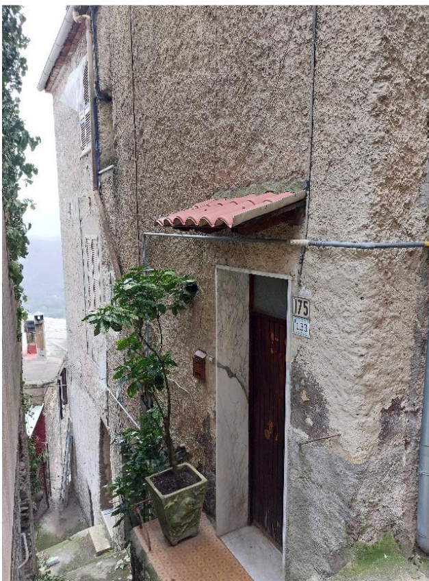
Vista esterna sul Vicolo Comunale