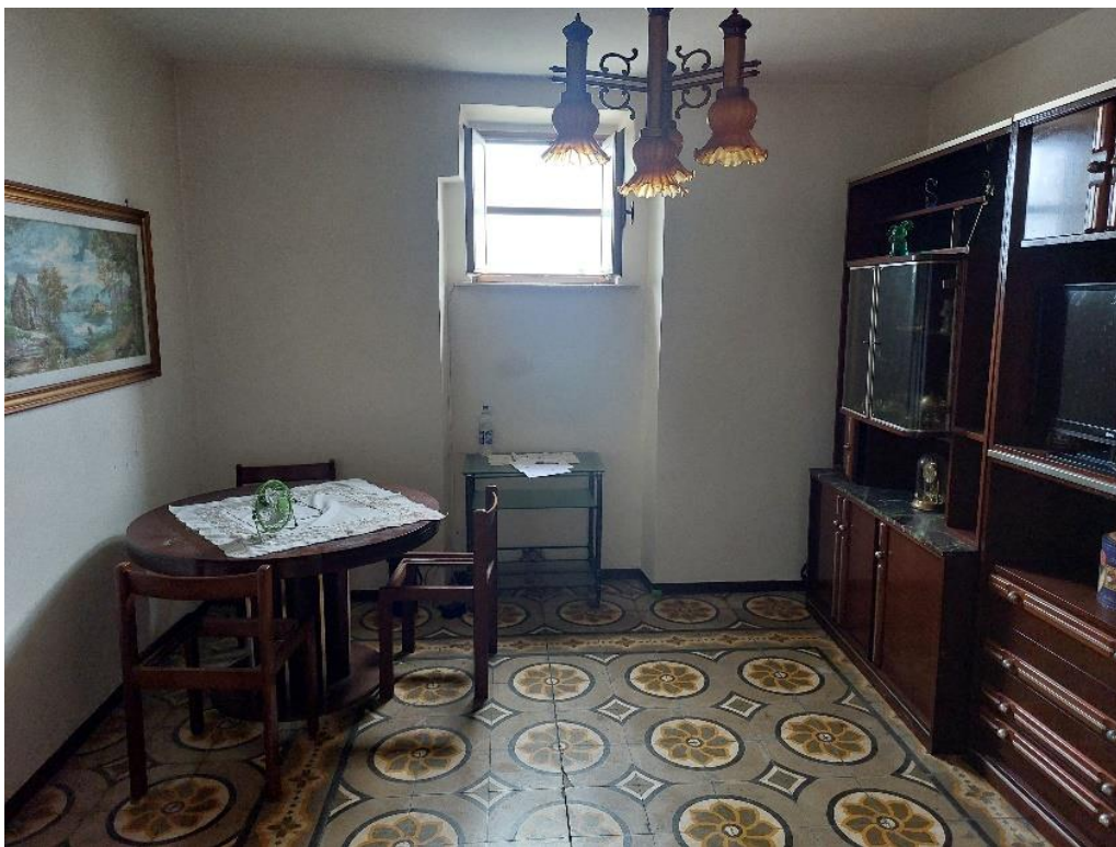
Locale ad uso soggiorno - vista 1 - piano T