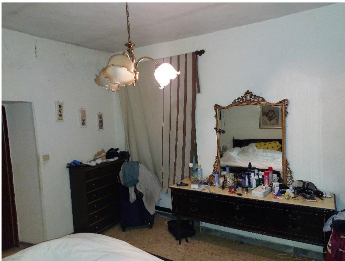
Camera da letto n° 02 – piano 1