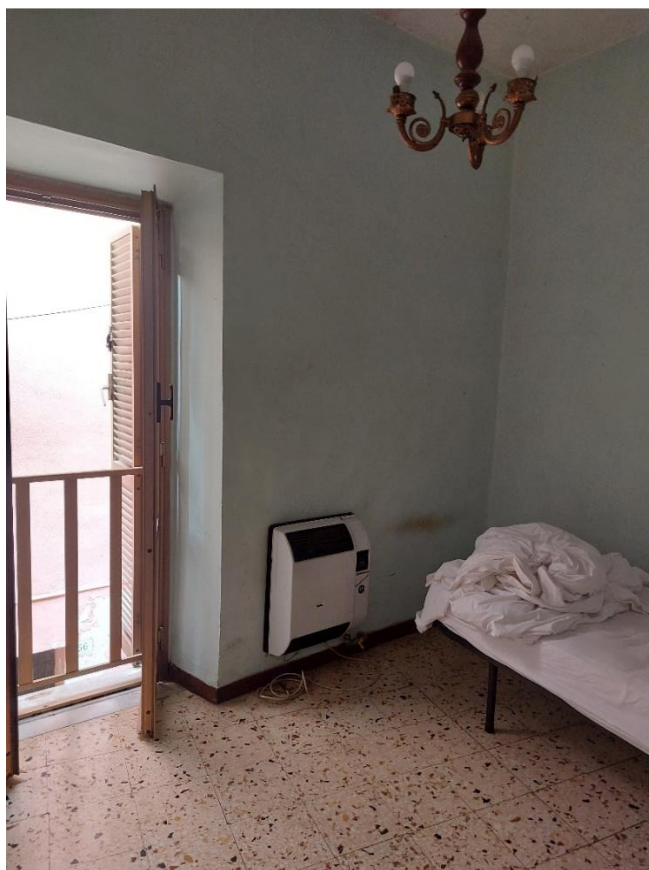
Camera da letto n° 01 – piano 1