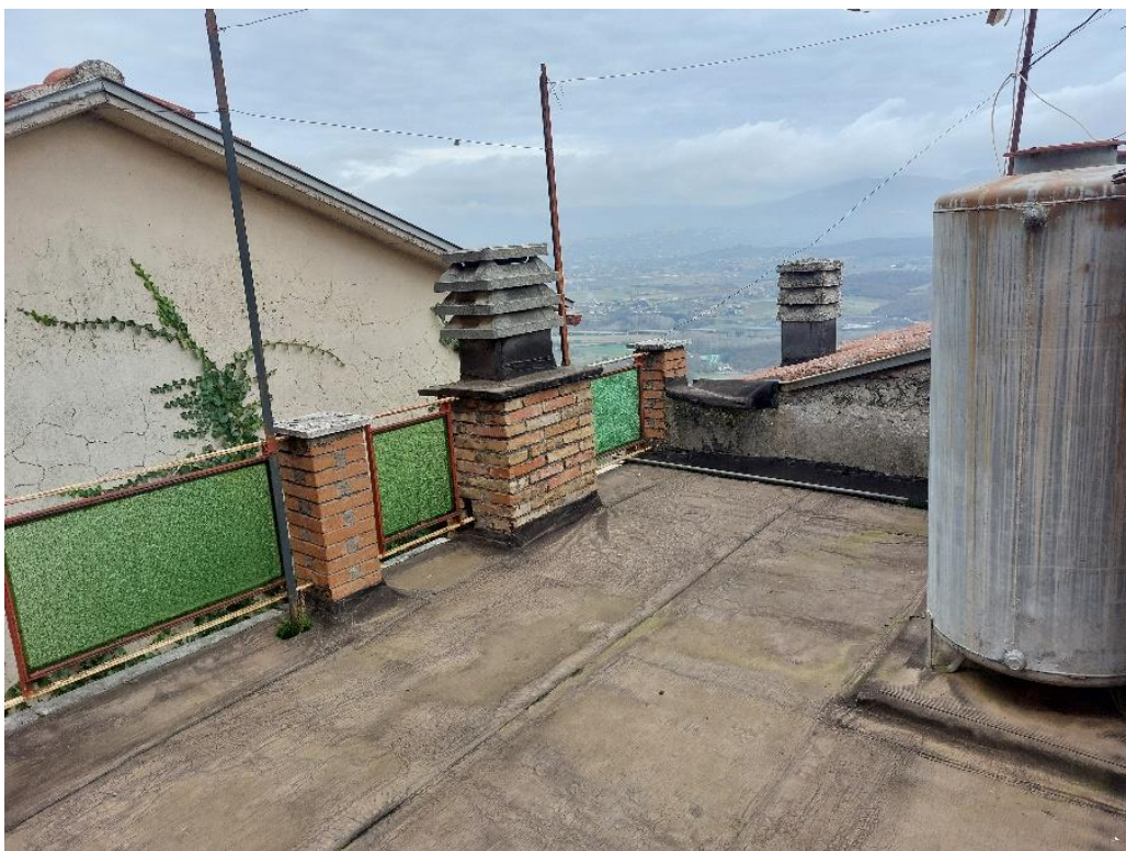
Terrazza – piano 2