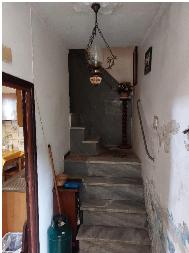
Scale di accesso al piano 1