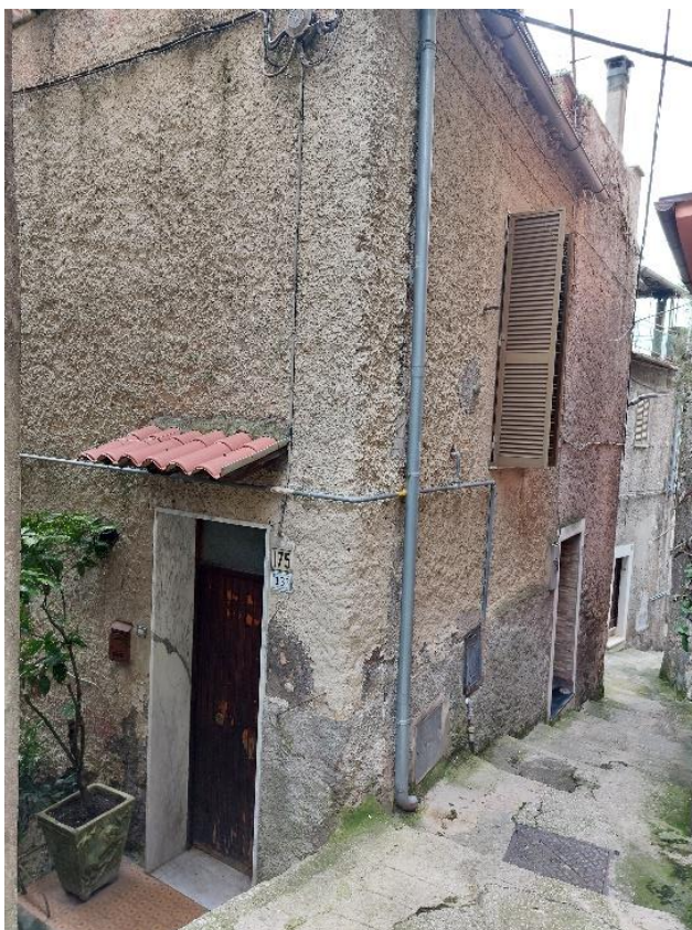
Vista esterna su Via Garibaldi