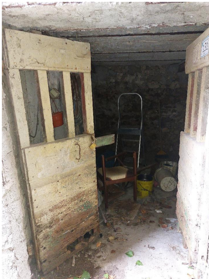
Locale deposito - piano S1