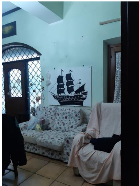
Foto interna del magazzino trasformato abusivamente in abitazione (Bene n.2)