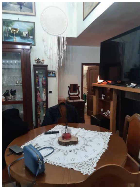
Foto interna del magazzino trasformato abusivamente in abitazione (Bene n.2)