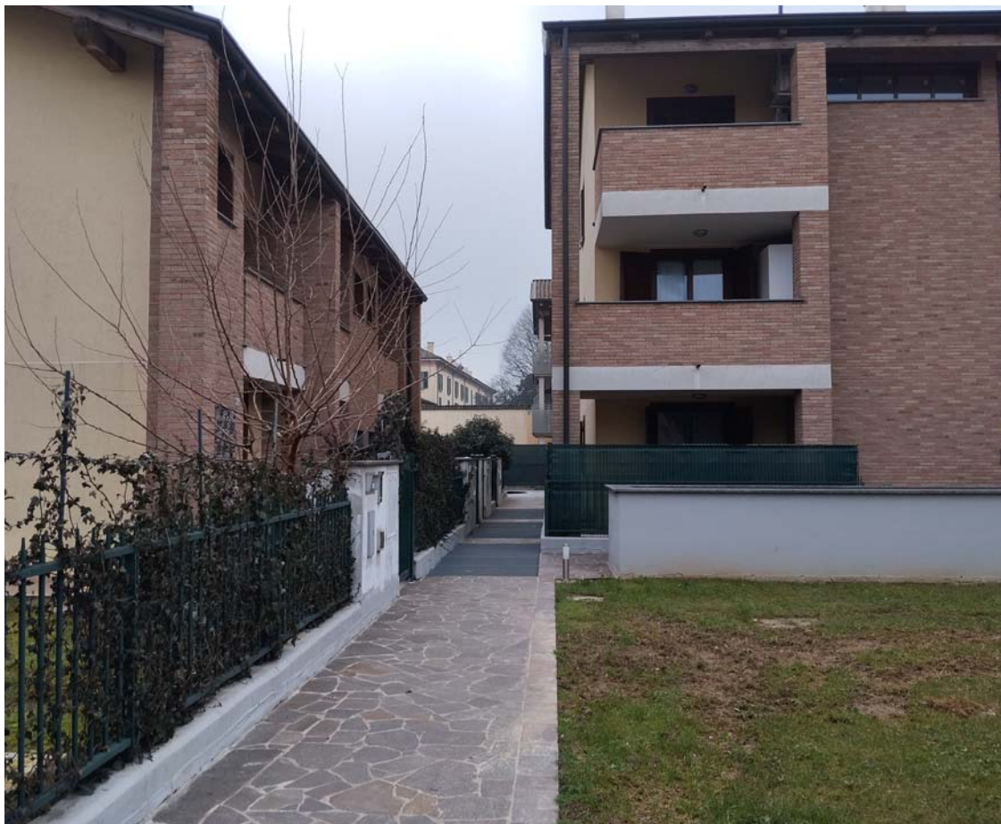
Ingresso pedonale all'unità esecutata