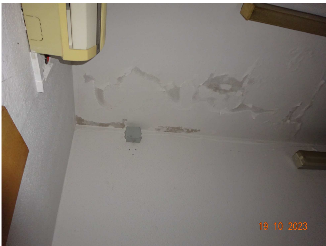
foto 12 – Piano terra: ingresso (particolare infiltrazioni umidità sul soffitto)