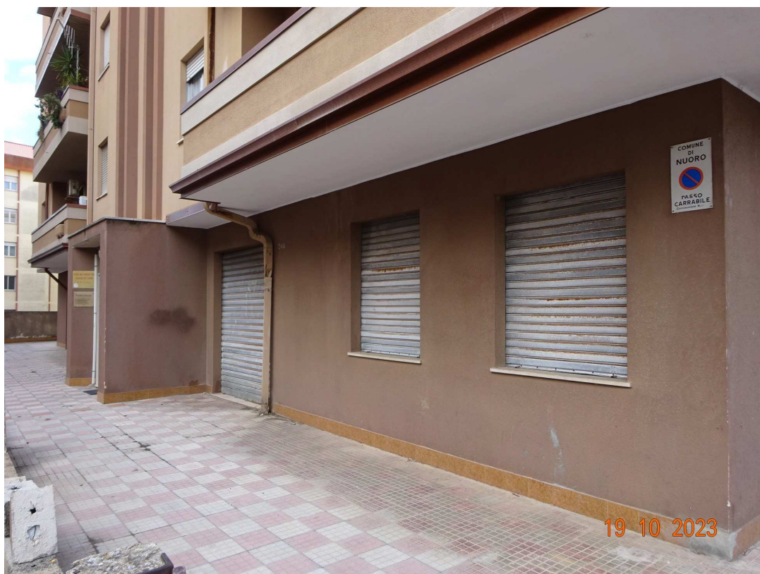
foto 5 – Esterno del piano terra con aree di pertinenza – lato Via Mons. Cogoni