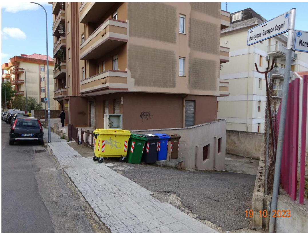
foto 7 – Rampa di ingresso al cortile interno dalla Via Mons. Cogoni