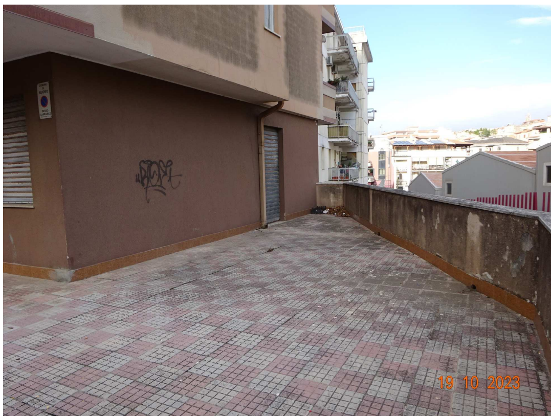
foto 6 – Esterno del piano terra con aree di pertinenza - angolo sud dell'edificio