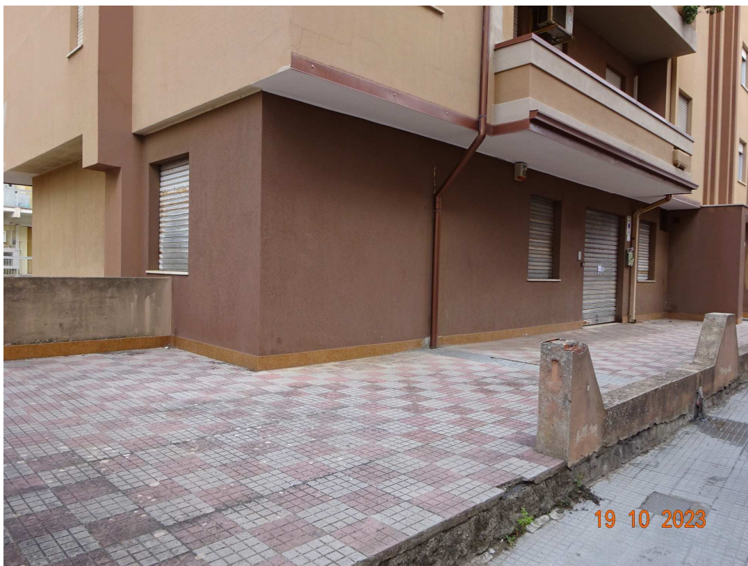
foto 3 – Esterno del piano terra con aree di pertinenza - angolo sud dell'edificio