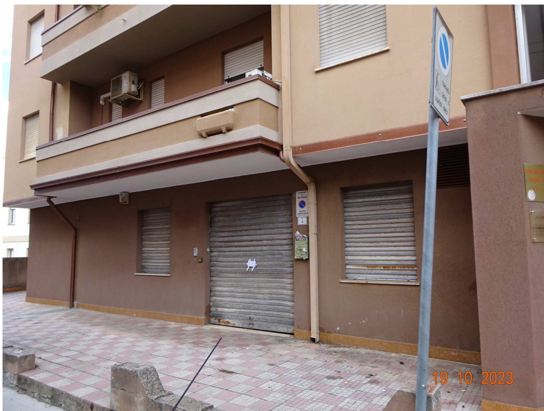
foto 4 – Esterno del piano terra con aree di pertinenza – lato Via Mons. Cogoni