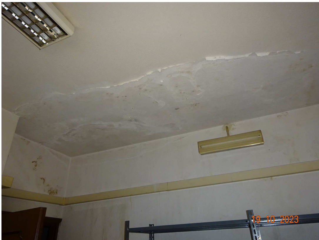
foto 14 – Piano terra: sala vendita (particolare infiltrazioni umidità sul soffitto)