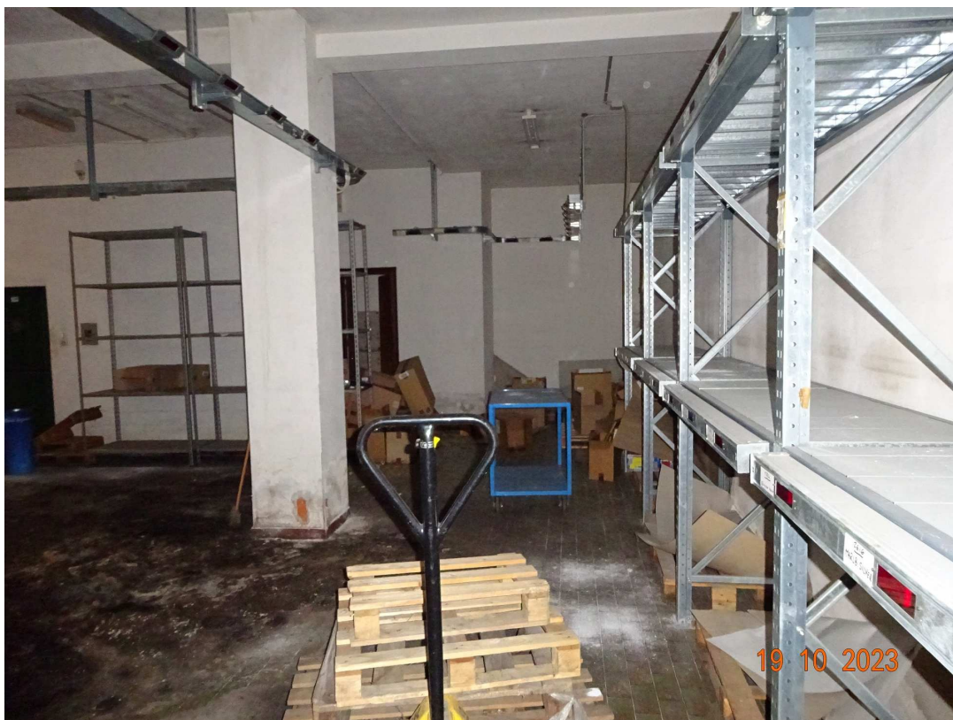
foto 29 – Piano seminterrato: magazzino con residui scarichi fognari