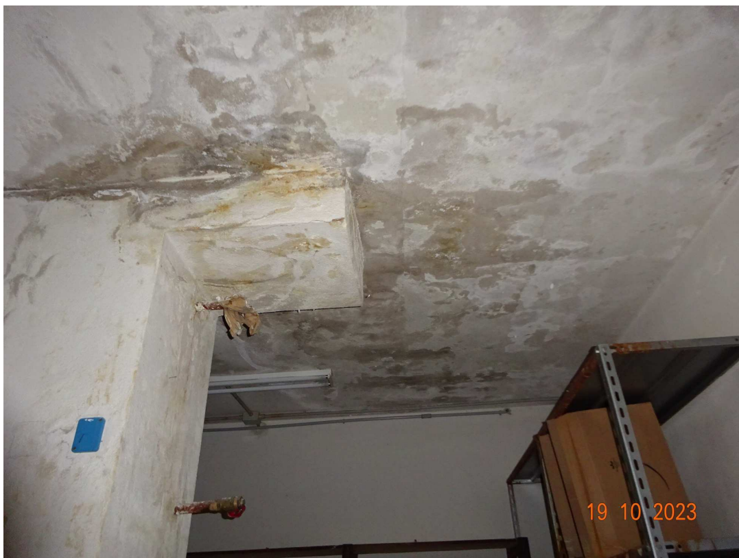
foto 17 – Piano terra: magazzino (particolare infiltrazioni umidità sul soffitto)