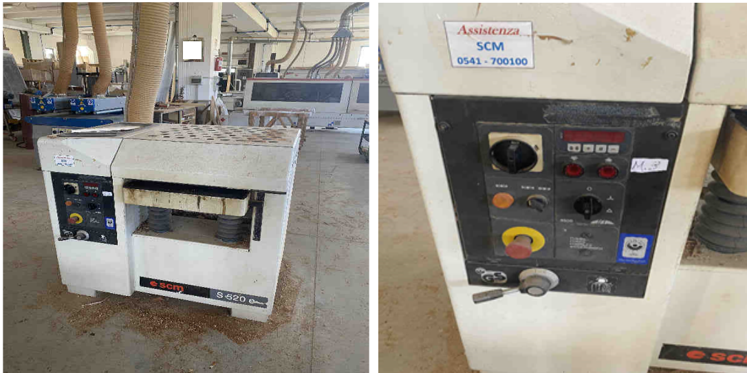
Pialla Spessore SCM S520 e – Cod. inventario “M3”