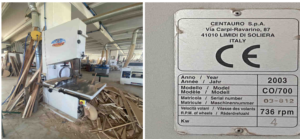
Sega a nastro Centauro – Mod. CO/700 – Cod. inventario “M5”

Di seguito si allegano le foto riproducenti la sega a nastro Centauro sopra indicata: