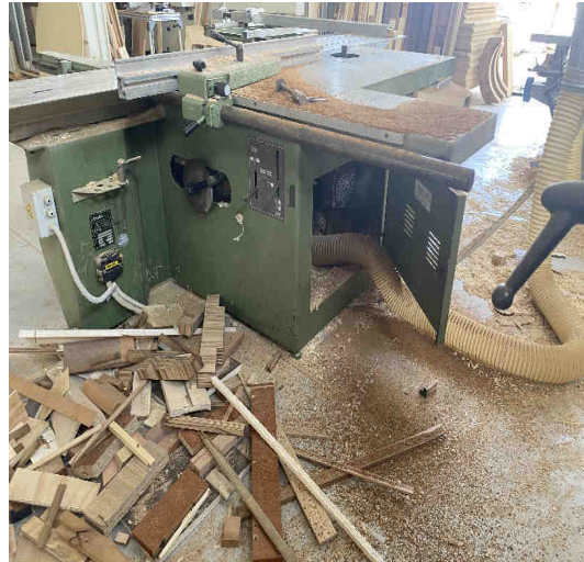
Tenosquadatrice – mod. Tenos 3 TS X3 – Casolin - Cod. Inventario “M6”