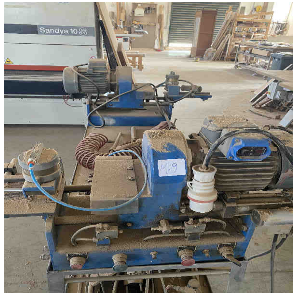
Macchine per stecche e lamelle – persiane messinesi – Cod. Inventario “M9”