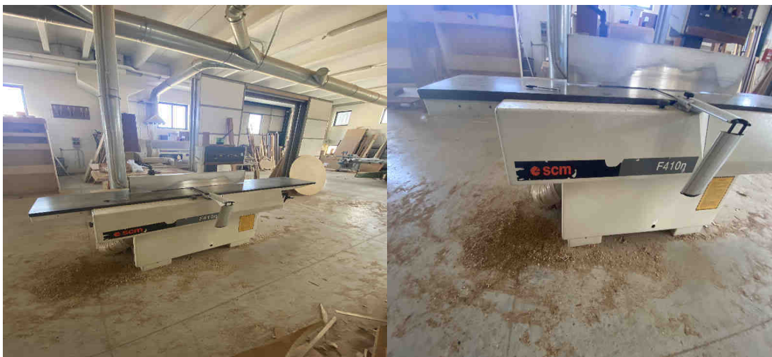
Pialla a filo SCM S520E – Cod. Inventario “M4”