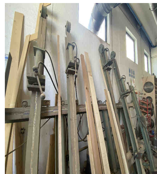
Strettoria per incollaggio pleodinamico - Orma – Cod. Inventario “M8”