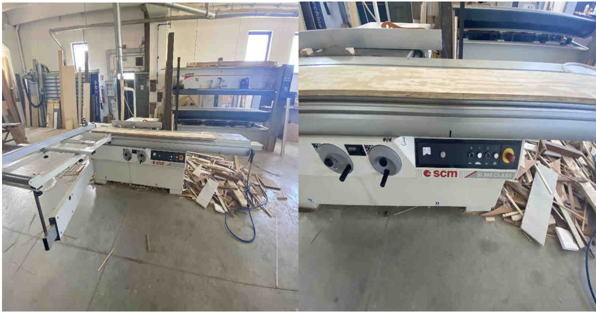
Sega circolare squadratrice marca: SCM - Tipo: SI300N “Cod. inventario M1”