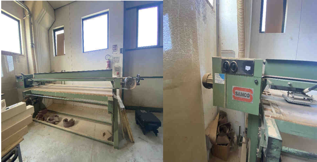
Levigatrice a nastro marca SCM S300 class – Cod. inventario “M2”